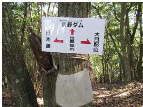
出湯岐れに到着。北側の興山園への表示はない。