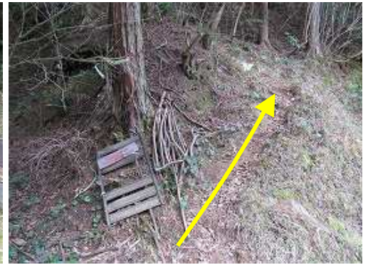
林道に入ると直ぐ、右斜面に登山口が現れる。