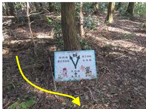
白木越分岐に出会う。大目配山は近い。