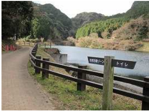
右に河内池を眺めて遊歩道を進む。