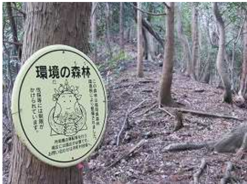
緩やかに尾根筋を上って行く。