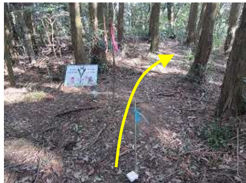
白木越分岐まで戻り、右へ向かう。