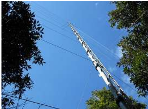
風況観測ポールが青空に映える。ひと休みして引き返す。