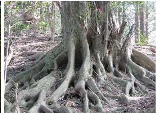
タコ足のように根を張る大木を抜ける。