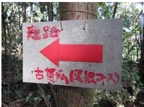
古賀ダムへの案内板。