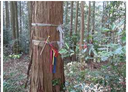
古賀ダム分岐に出会う。