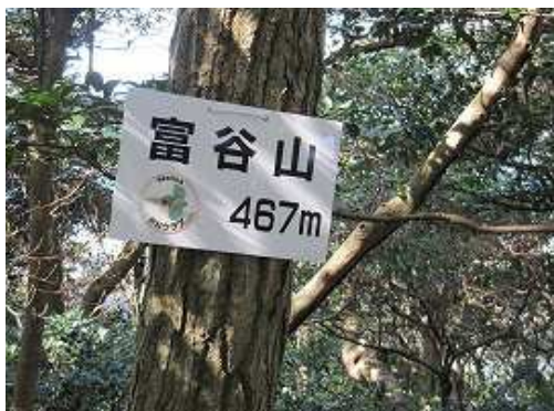
富谷山(467m)の山頂。展望は得られない。