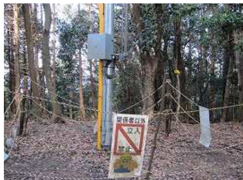
久山(510m)の山頂。四等三角点であるが展望は得られない。風況観測のボールが立っている。