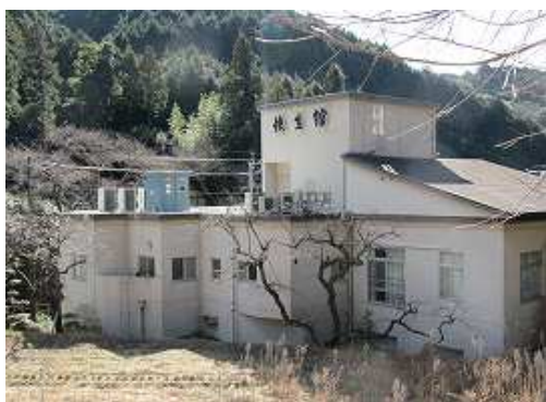
抜けると快生館が右手に見えた。左に回り道路に出る。