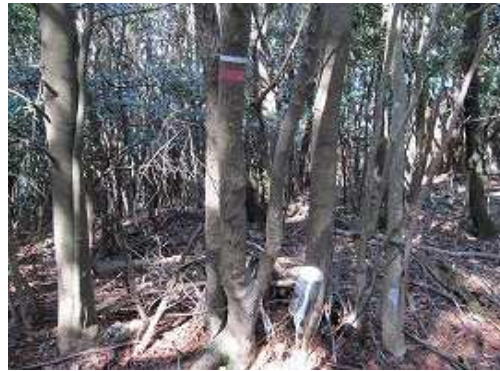
鬼王山(476m)の山頂。山名板もなく展望は得られない。