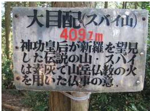
別名: スパイ山とも云われ、神功皇后伝説がある山でもある。一休みして、白木越分岐まで戻る。