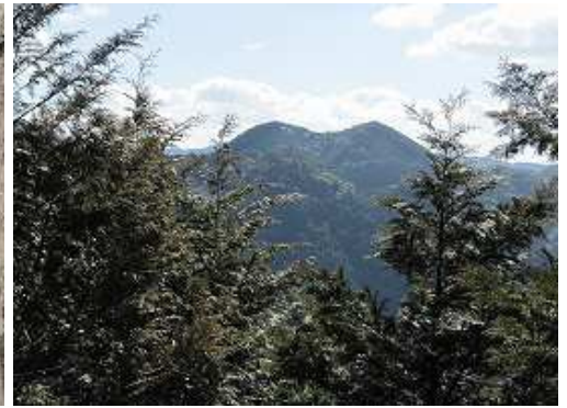
東に開けた所があり、南東方面が望める。