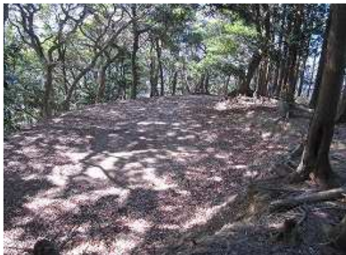
作業路終点に出会い、道なりにジグザグに下って行く。