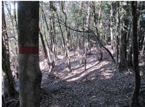
赤テープを拾いながら下って行く。