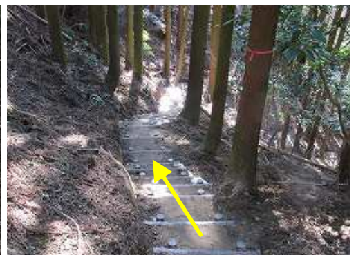
擬木階段を下って行く。