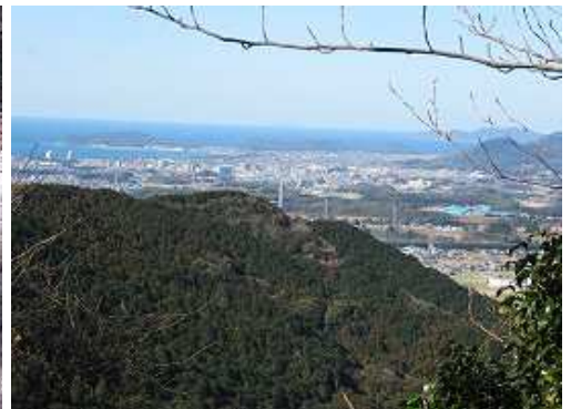
開けた所から津屋崎方面が望まれる。