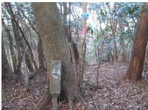
不入谷分岐に出会う。