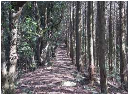
歩きやすい古道を進む。