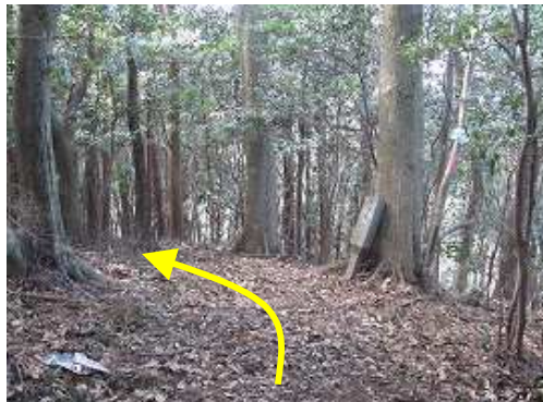
不入谷分岐を右に見送る。