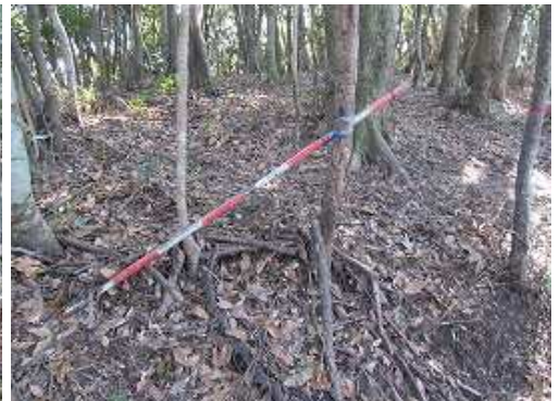
出湯岐れの案内板の北側に、ポールが目印の興山園への降り口がある。付近に赤テープ有。