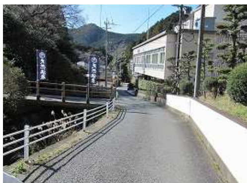
道路に出て右へ下って行く。