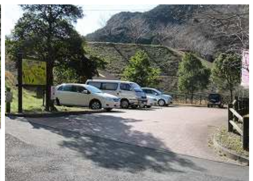
水辺公園Pに帰り着いた。