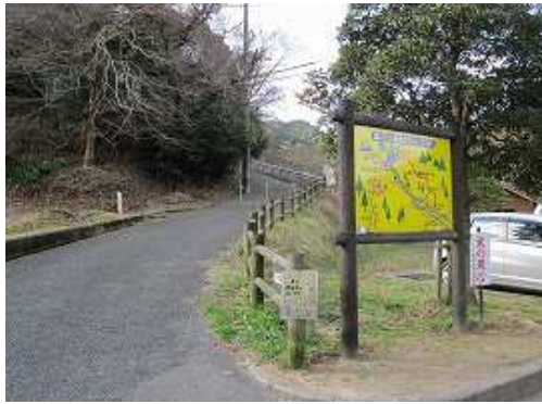
水辺公園駐車場に駐車し、歩き始める。10台程度駐車可能でトイレもある。

水辺公園P～河内池登山口～古賀ダム分岐～大目配山(410m)～白木越分岐～薬王寺峠～京王山(408m)～鬼王山(476m)～富谷山(467m)～出湯岐れ～不入谷分岐～久山(510m)～興山園降口～作業路終点～展望地～興山園登山口～興山園入口～水辺公園P