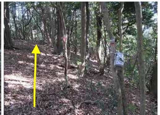
要所要所でアサヒビールのアルミ缶を目にする。この先で東に急な斜面を下って行く。