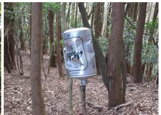
弱いコルに、また生ビールのアルミ缶が。