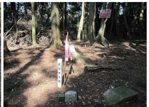
大目配山(410m)は三等三角点であるが、周囲を樹木に覆われ展望は得られない。