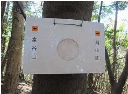
左側の幹にかかる案内板。