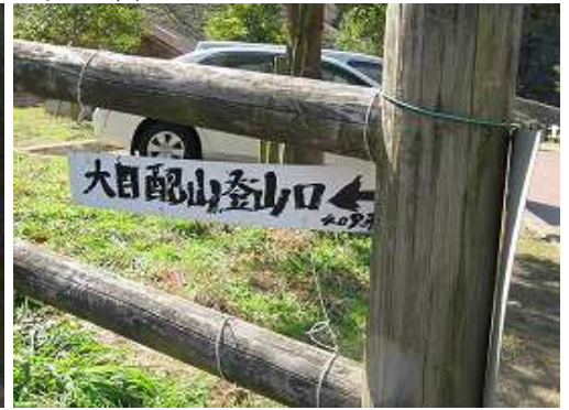
駐車場入り口の木柵の端部に案内板があるが見落としやすい。