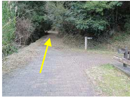
池の終わりで遊歩道と別れ、真っ直ぐ林道に入る。