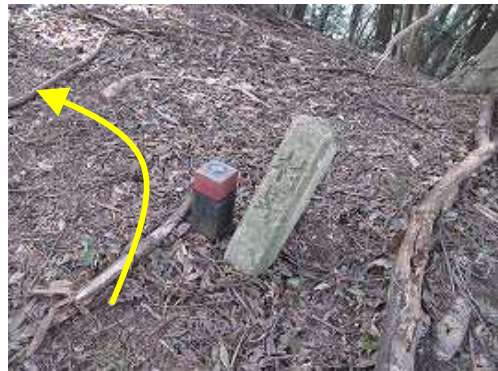
尾根上の村界杭を見る。