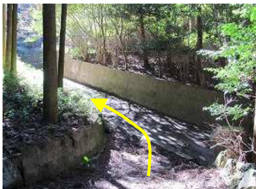
作業路入口の興山園登山口に到着。左へ向かう。