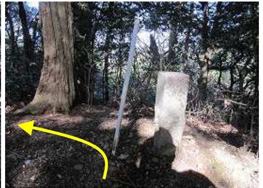
ひと登りすると杭に出会うので左へ向かう。