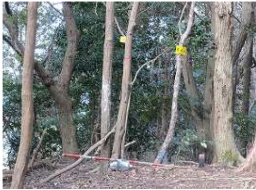
京王山(408m)の山頂。展望は望めない。