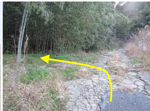
右の永田牧場の先から左の林道へ入ると、左右に竹林が広がる。