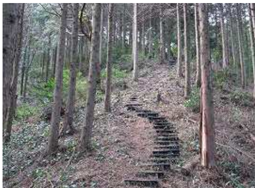
やや急な斜面のプラ階段を上って行く。