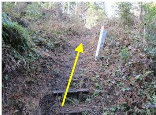
右側に15鉄塔への取付があるのでプラ階段を上る。