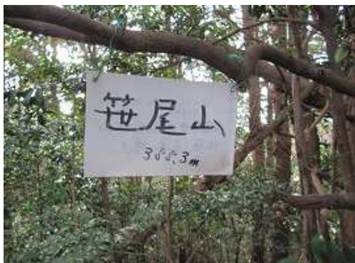
枝にぶら下がる山頂板。