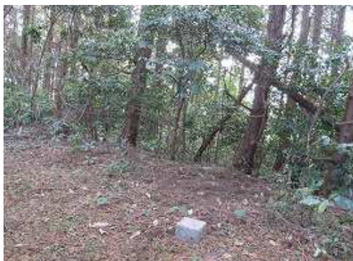
笹尾山(355m)の山頂。三等三角点であるが展望は得られない。