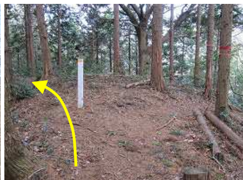
尾根まで戻り左へ尾根筋を下る。