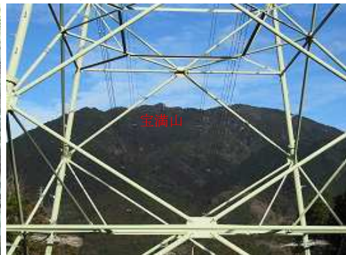
15鉄塔から宝満山を望む。