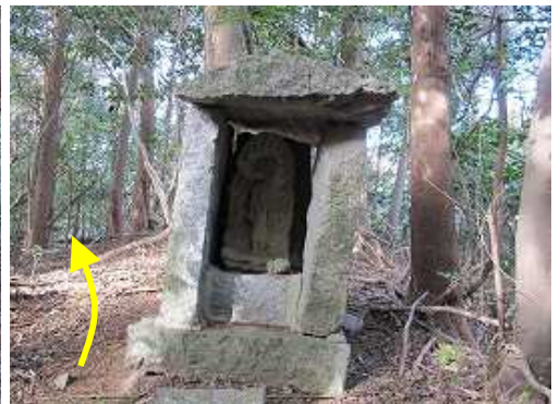
36番石仏は不動明王。左脇を抜け尾根中央部の白いプラ杭を辿り下って行く。