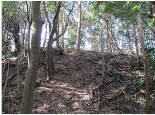
この上が龍ヶ城址。