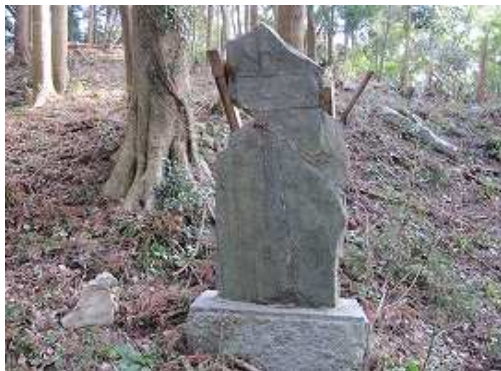
一段下った所には忠魂碑が建つ。