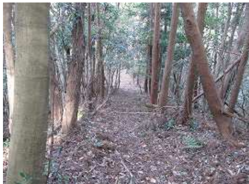
緩やかに下って行く。