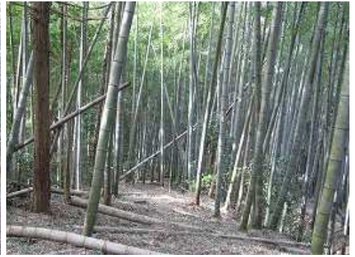
左右に広がる竹林を抜ける。