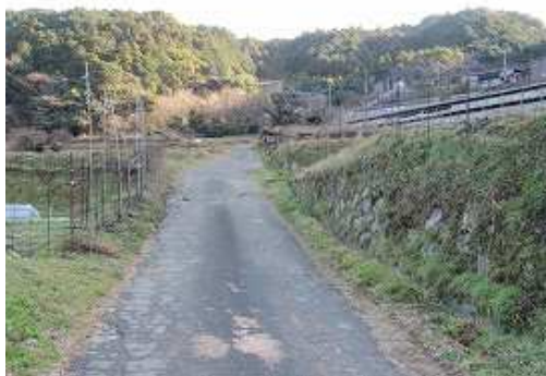
道路の空き地に駐車し、緩やかに道路を登って行く。右奥は永田牧場。

駐車地～15鉄塔取付～15鉄塔～尾根～笹尾山(355m)～15鉄塔～尾根～竹林～龍ヶ城址～36番石 仏～杣道出合～取付き～駐車地