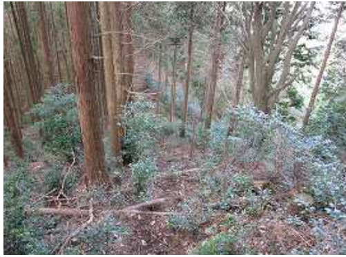
やや急な斜面を下る。