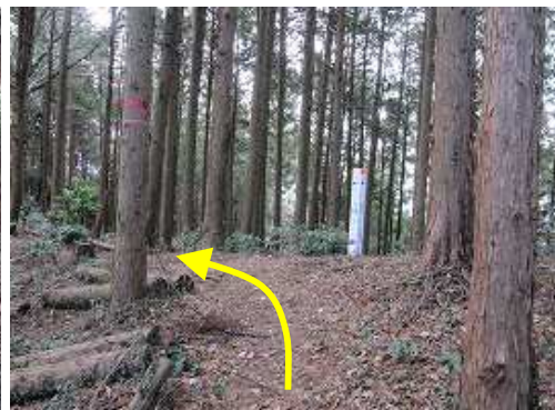
尾根に上り詰めたら、左へ向かう。