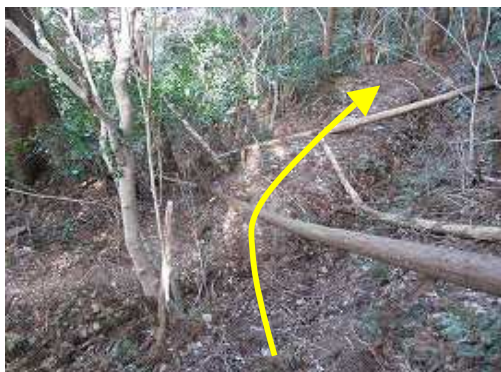
下り着いたら 柚道 に出合う。古い水路に沿って右へ向かう。