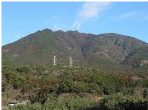
左手に裏からの宝満山を望みながら上る。