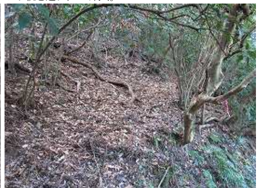
取付き点なのか？右の斜面に赤テープが見受けられる。