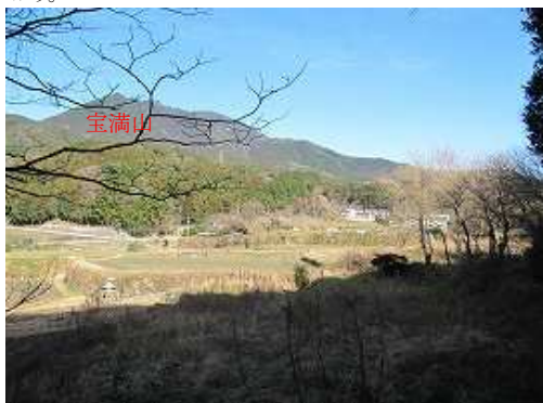
抜けると左に裏宝満山が見渡せた。