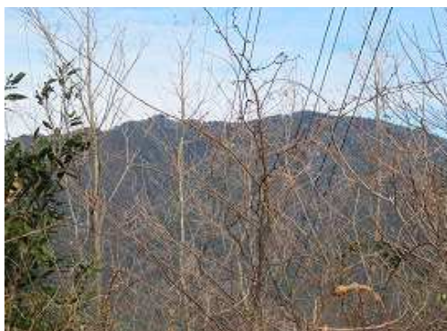
北に宝満山を望む。