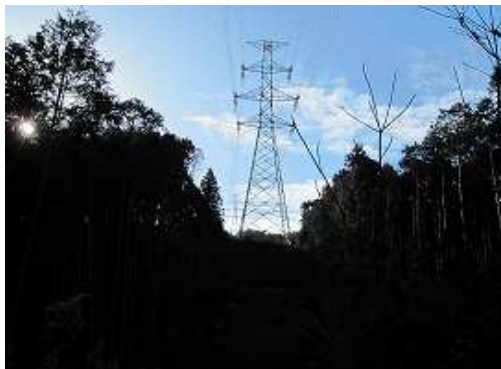
右にカーブを回り込むと送電鉄塔が正面に見える。