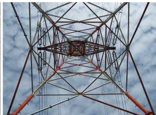
14鉄塔を真下から眺める。