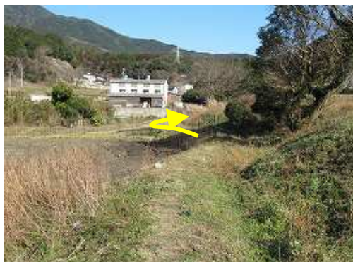
道路に出て右折する。