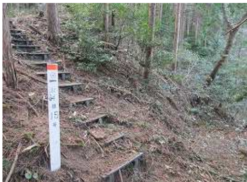
九電の巡視路のプラ階段が現れた。