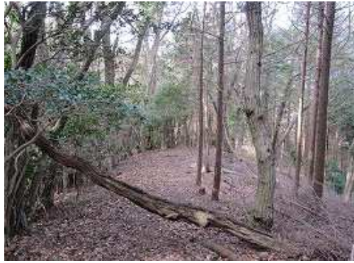
平坦路の落ち葉を踏みしめて行く。