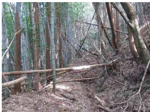
荒れた柚道を辿る。右の水路は落ち葉で埋まっている。