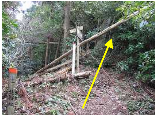
竜岩自然の家分岐に出合う。山頂は尾根筋を登る。