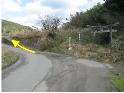
宝満川を渡り鳥居左手の坂道を上り、水路際を電柵に注意しながらルートに合流する。