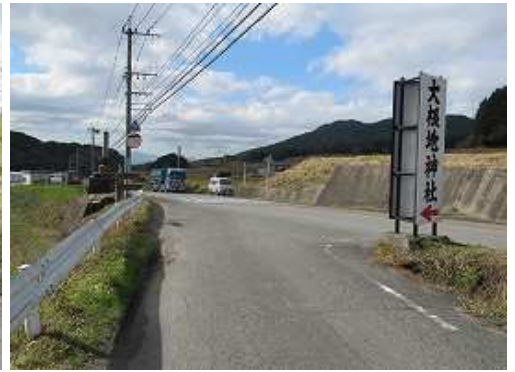
駐車地の香園バス停が見えて来た。