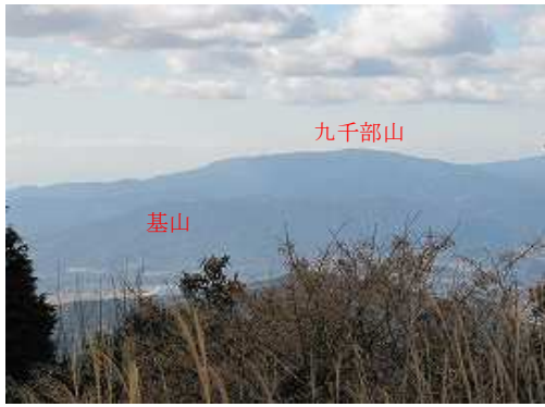
西に基山、九千部山を望む。