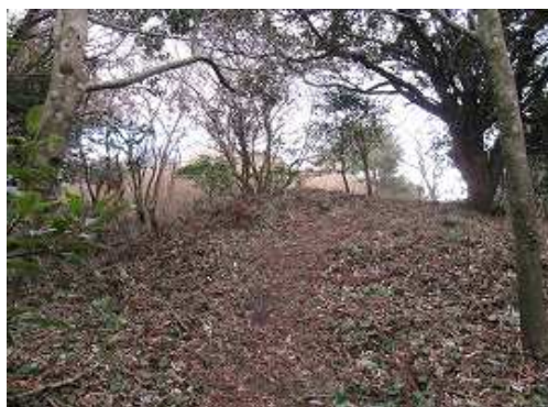
山頂部の西端部に上り詰めた。