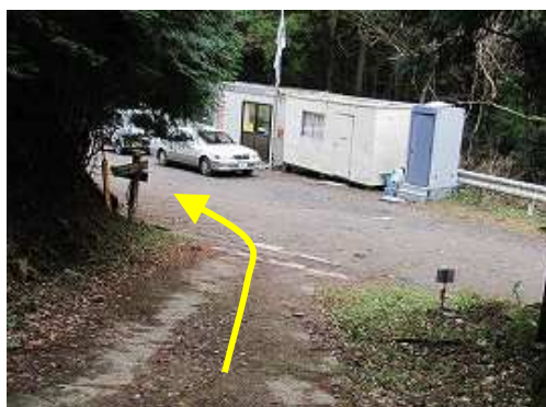
林道に出会い、左に下って行く。