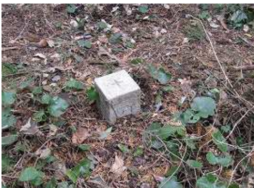
四等三角点(奥谷GH=476m)に到着。展望は得られない。