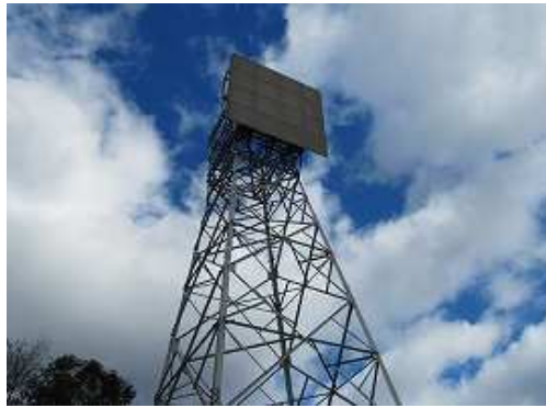
反射板を見上げる。