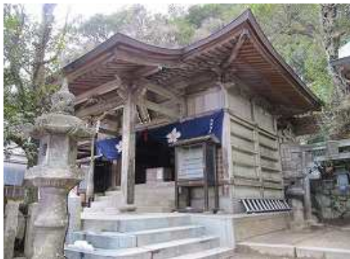
大根地神社に参拝する。