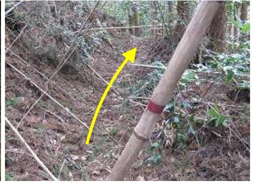
割と明瞭な踏み跡を辿る。赤テープも巻いてあるが古い。