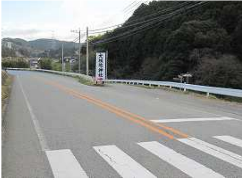
香園バス停の路肩に車を止め、大根地神社へ向かう。

香園バス停～73鉄塔～竜岩自然の家分岐～四等三角点～大根地山(652m)～大根地神社～扇滝～林道横断～林道出合～林道入口～ゲート～香園バス停