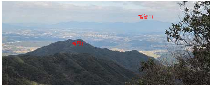
北には福智山が望める。