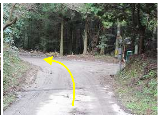
林道香園支線入口に出会い、左に下って行く。