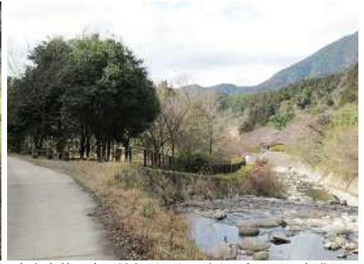
竜岩自然の家の端部が見えて来た。右の川は宝満川。