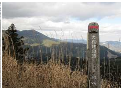
大根地山(652m)の山頂。270°の展望が得られる。