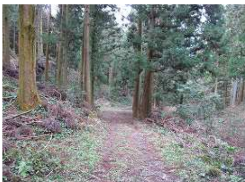
作業路に出会い右の大根地川沿い下って行く。