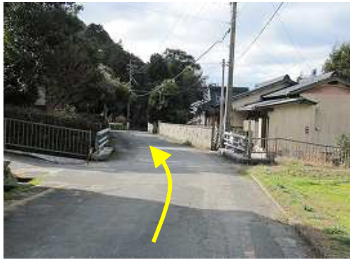
香園の集落を抜けて行く。