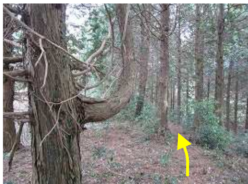
湾曲した枝を伸ばすヒノキの脇を抜ける。