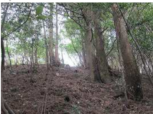
前方が開けて来た。