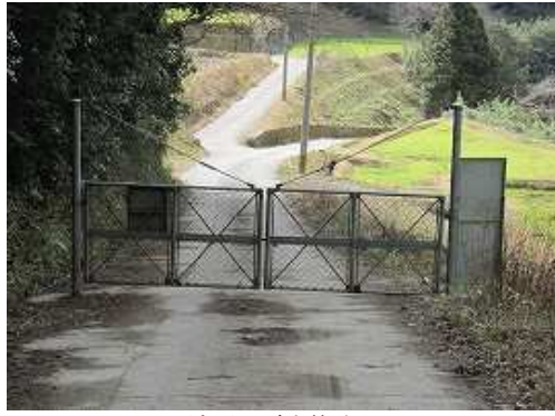
ゲートの脇を抜ける。