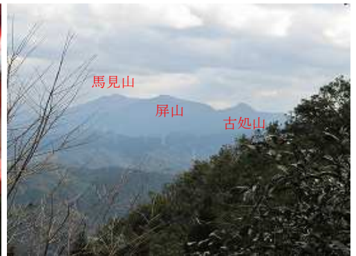
東に古処山から馬見山を望む。