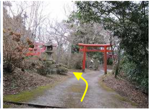
左折して大根地神社へ向かう。