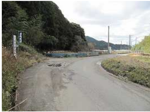
取付いた坂道まで来た。