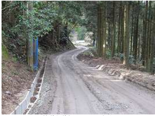
林道を道なりに下って行く。