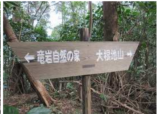
このような案内板が随所に現れる。