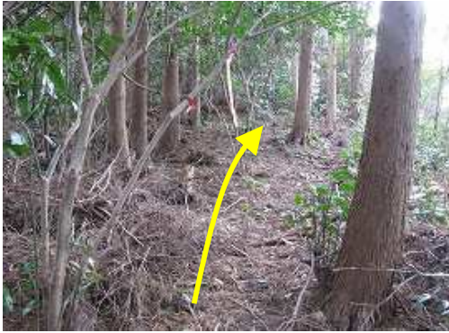
植林と自然林の境界付近に登路が伸びている。