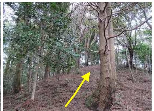
夫婦杉の左を抜け、緩やかに上って行く。