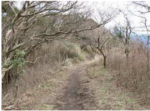
大根地神社へ向かう。