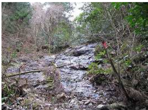
左に濡れた岩壁の下を通過する。