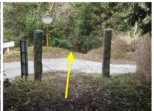
林道を横断して降って行く。