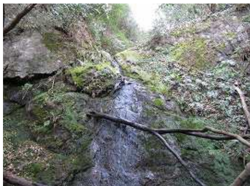
左から扇滝が落ちていたが、水量は少ない。