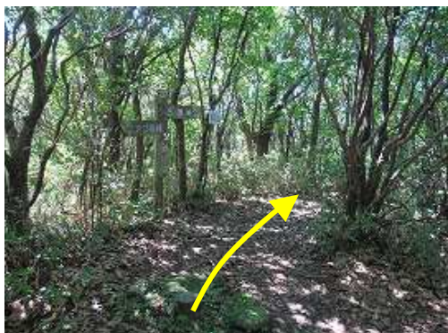
城ノ山を通過する。