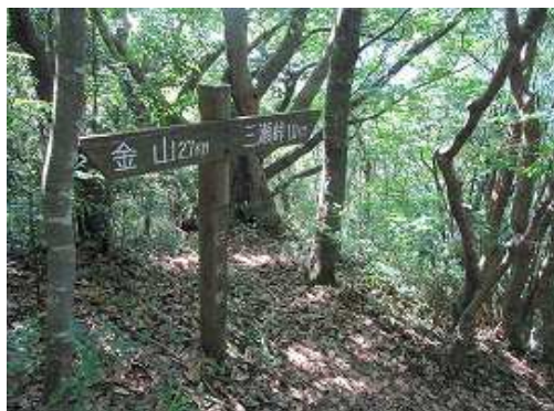
1km地点の標柱を過ぎる。