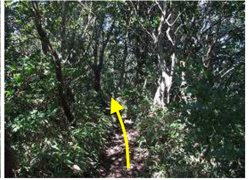
痩せ尾根を抜けると金山。