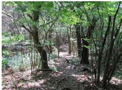
緩やかに下って行く。