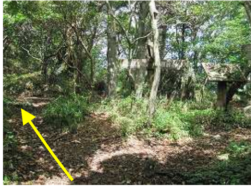
番所跡に到着。金山は左。