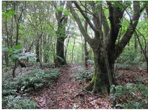
落ち葉の道を行く。