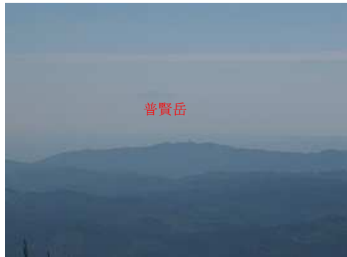
普賢岳が薄っすらと確認できた。