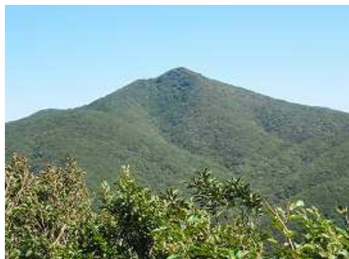
露岩から金山を望む。