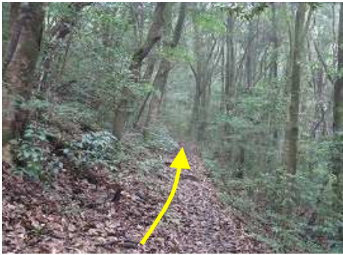
ガスっている自然歩道を緩やかに上る。