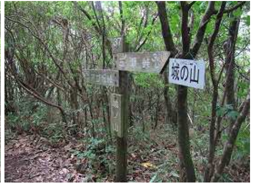
標高846mの城ノ山に到着。四等三角点であるが、樹木に囲まれて展望は得られない。