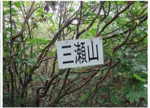
標高790mの三瀬山に到着。樹木に囲まれて展望は得られない。