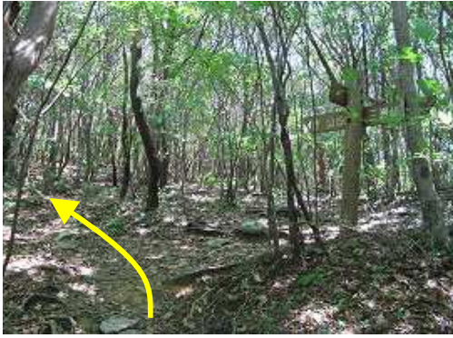
山中分岐を通過する。