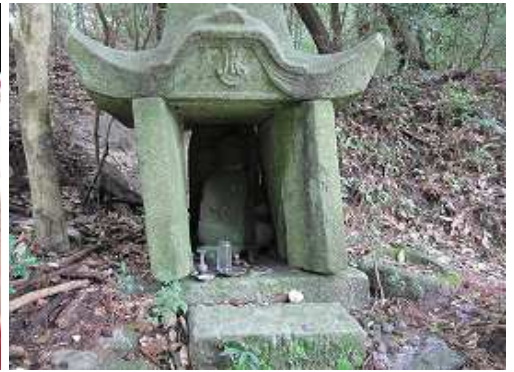
登山口から5mほど入ると左側に祠があるので、お参りして行く。