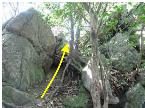
露岩への岩場を登る。