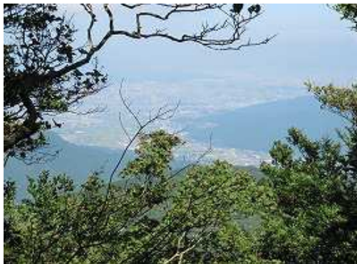
番所跡の開けた所から福岡市を望む。