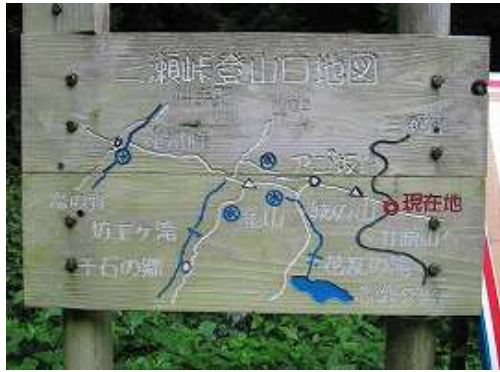
側に建つ案内板に目を通す。