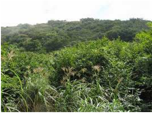
三瀬山から緩やかに下ると弱い鞍部着く。これから向かう城ノ山が望める。