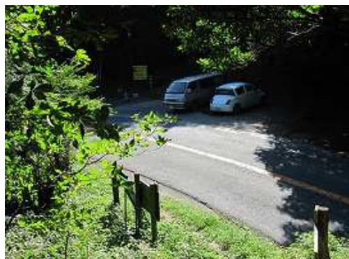
登山口に降り着いた。