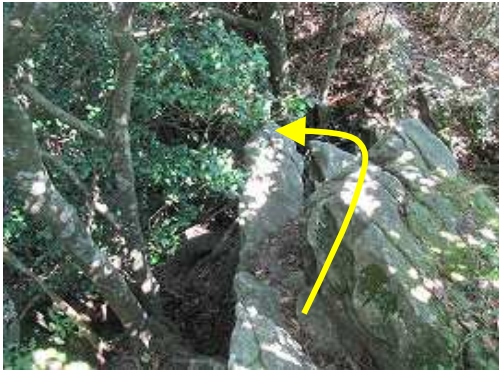
露岩の手前で左下へ2m程岩場を降る。直進すると露岩の展望台で金山が望める。