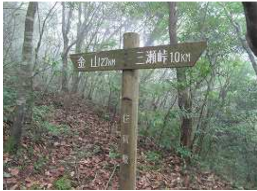
1km地点の標柱を過ぎる。