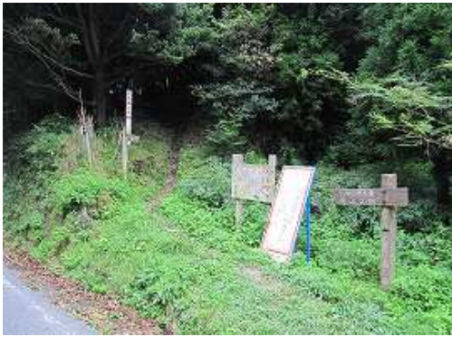
三瀬峠登山口から歩き始める。