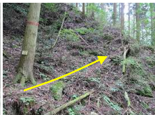
尾根コースは右側の斜面に取付く。