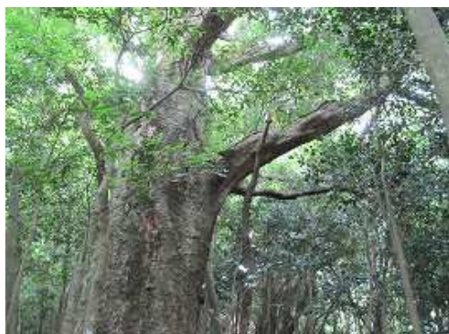
ケヤキの大木が立つ、緩斜面に到着。