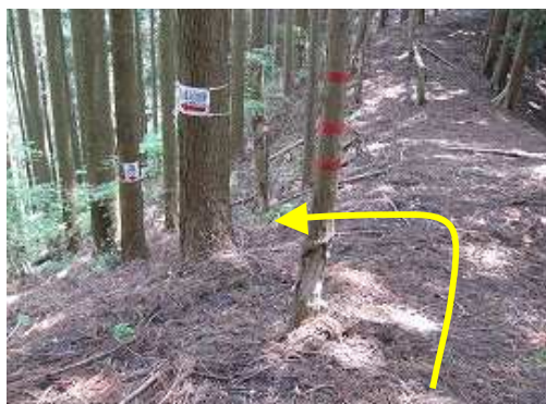
やっと傾斜が緩み平坦となる。標識は左へ下る。