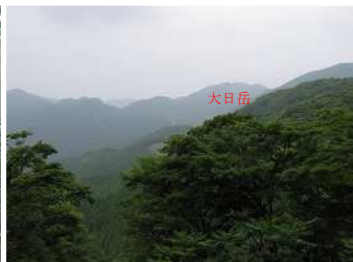
尾根端部の開けた所からは大日岳(830m)が望める。