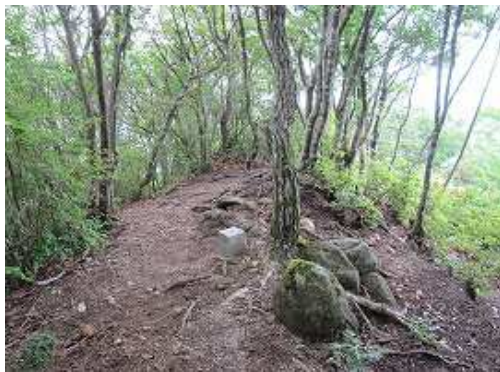
浅間山(832m)の山頂。四等三角点が設置されている。南方面に展望が得られる。