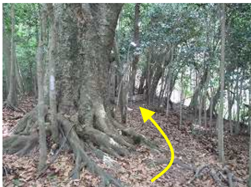
大ケヤキの側を抜けて行く。