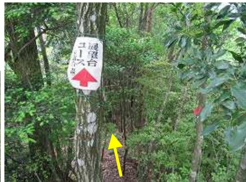
展望台コースの標識に従い下る。