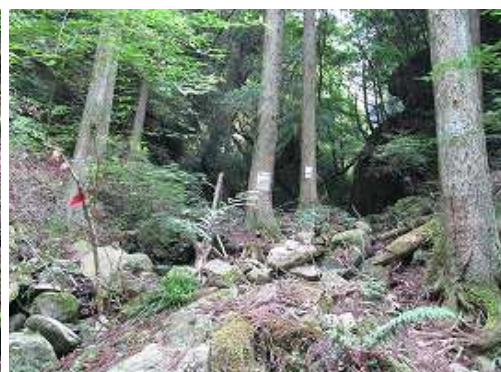
谷・尾根分岐に到着。