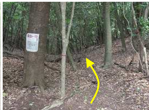
谷コースへの降り口。