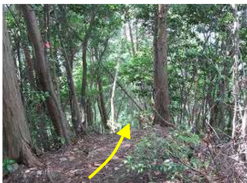
展望台へのコース。