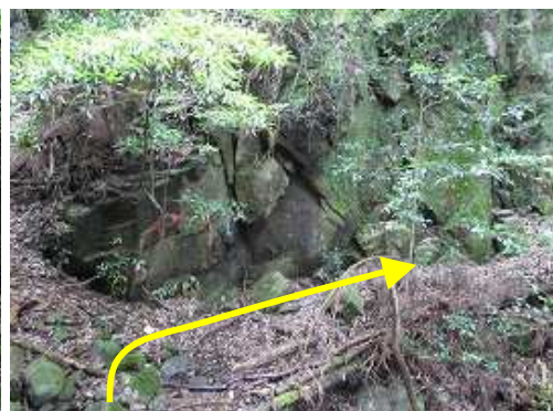
岩の下を右上へ緩く上る。