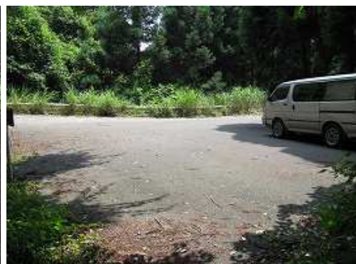
登山口に帰り着いた。