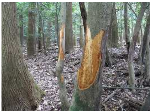
シカの食害で剥れた樹皮。