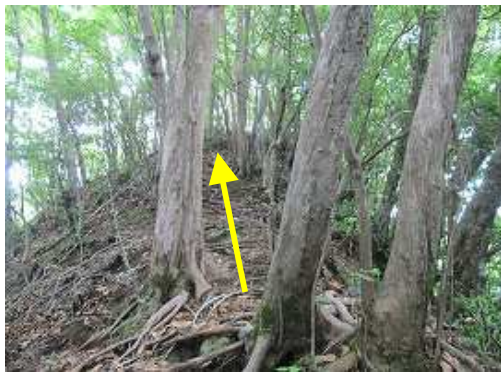
奥に山頂が見えて来た。