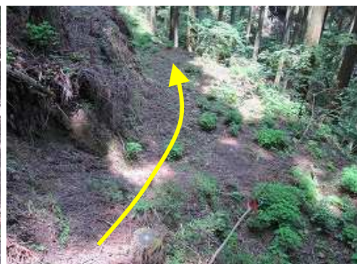
作業路に下り、奥へ向かう。