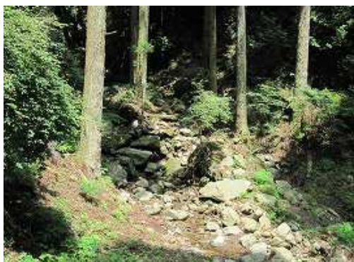
谷・尾根分岐に出会う。