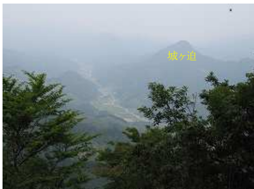
南西方向に城ヶ迫(546m)と下鶴集落を望む。