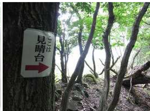
見晴台に立ち寄る。