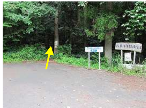
浅間山登山口 5台程度駐車できる広場がある。