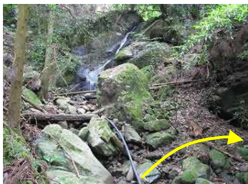
直ぐに正面に5m程度の斜滝を見る。左岸へ渡る。