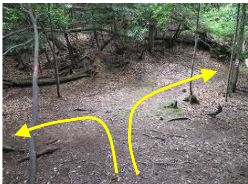
谷分岐に到着。右:展望台へ 左:谷コースを経て登山口へ