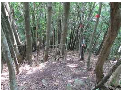
急斜面の滑りやすい下りが続く。