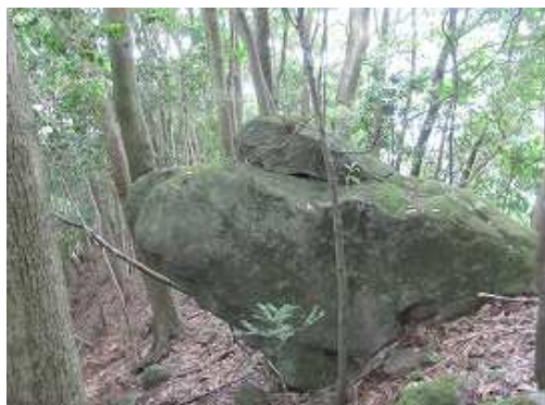
カエルの親子に似たカエル岩を通過する。