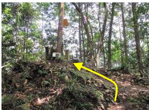
岳滅鬼分岐に到着。右:岳滅鬼山へ 左:展望台へ