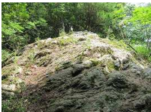
展望露岩に出会う。