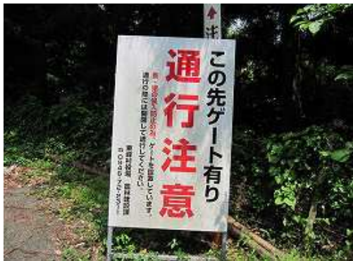
浅間山登山口へ向かう林道にはシカ・イノシシの侵入防止の為にゲートがあるので、自分で開けて閉めて通る。