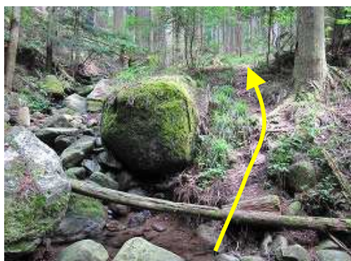
左岸に渡り、開けた所を緩やかに上る。