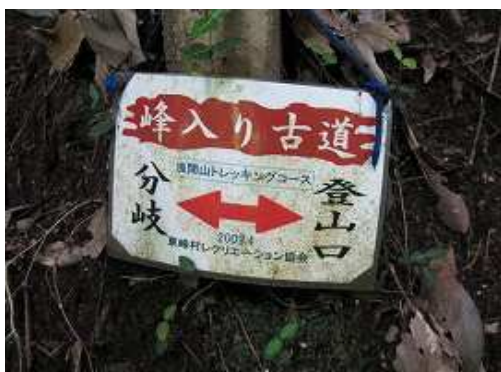
登山中、このような案内板を随所で見かける。滝の上部に降り立ち、右岸沿いに行く。