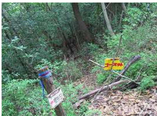
コース外の標識を見る。