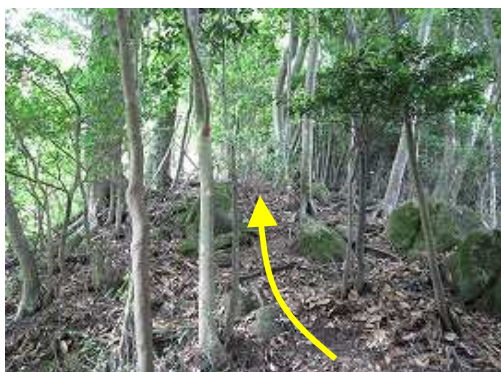
割と急な尾根の登りが続く。随所にテープがある。