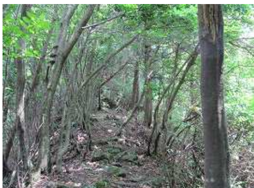
岳滅鬼山へのコース。