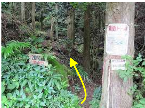
奥の登山口へ入る。