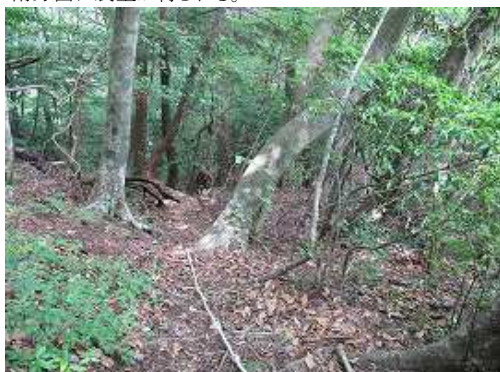
北方向に急な尾根筋を下る。