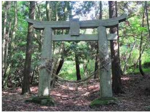
大権現の低い鳥居の抜ける。