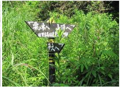
平之分歧に出会う。平之は右へ向かう。