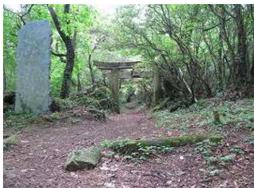
権現神社入口の低い鳥居をくぐる。石碑の方に下ればキャンプ場。