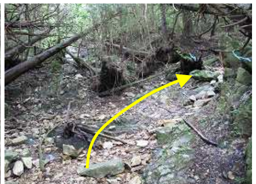
弱い沢を右方向へ抜ける。