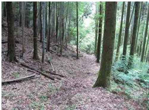
竹林の側を緩やかに下る。