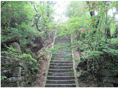
中段の石段を登る。