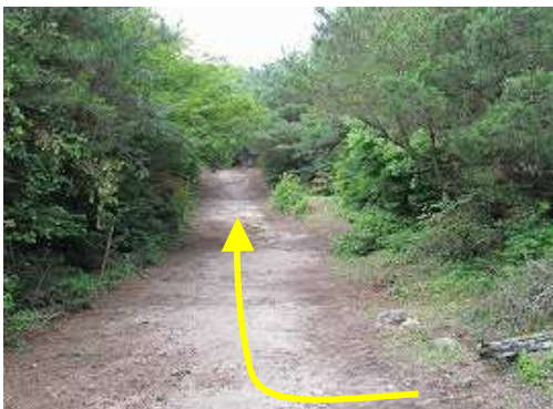
作礼山は奥の方。以前この辺りには滑り台があったが、撤去されていた。