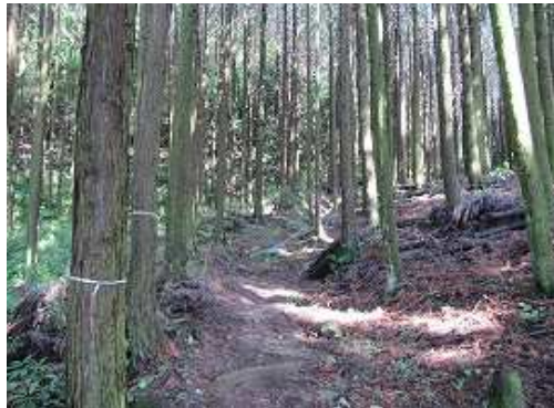
スギの植林帯の中を緩やかに上る。