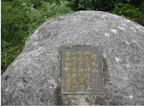
上宮裏の岩に埋め込まれた漢詩。