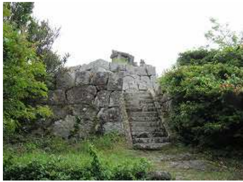
上段の石段の上に権現社上宮が見えた。