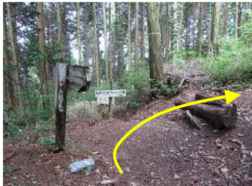
見返滝分歧に出会う。