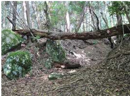
2本目の倒木の下をくぐる。