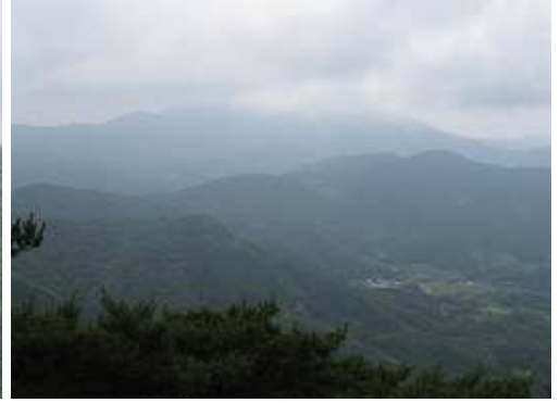
天山(1046m)は山頂部に雲がかかり山容が見えない。