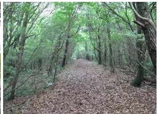
幅広い尾根筋を緩やかに下る。