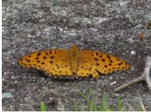
ツマグロヒョウモンが羽を休めていた。