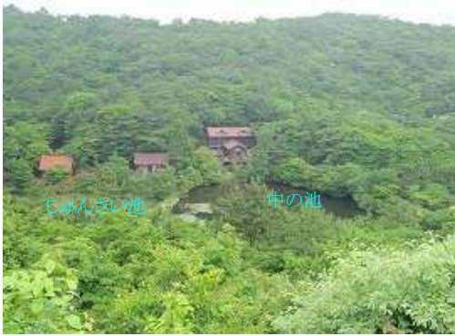
キャンプ場と池を見る。