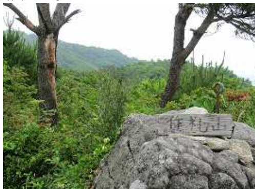
作礼山(887m)の山頂。北東の東峰から東の展望が得られた。南から西の展望はガスって得られなかった。