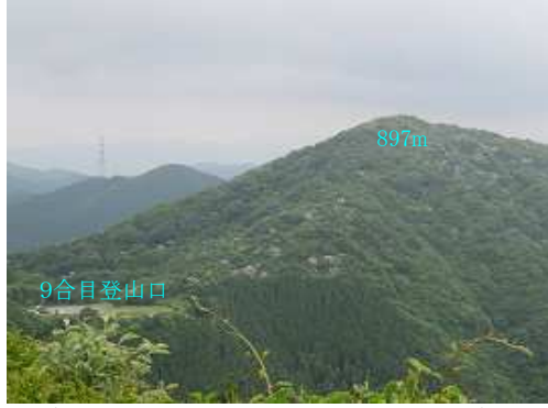
9合目登山口と897mピークを眺める。ヤマボウシが点々と散在して山腹に咲いている。