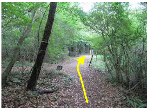
栗ノ木分歧に出会う。奥が東峰、左が作礼山となる。まず東峰へ向かう。