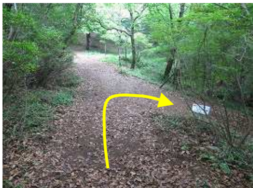
栗ノ木分岐まで戻り、右折して下って行く。