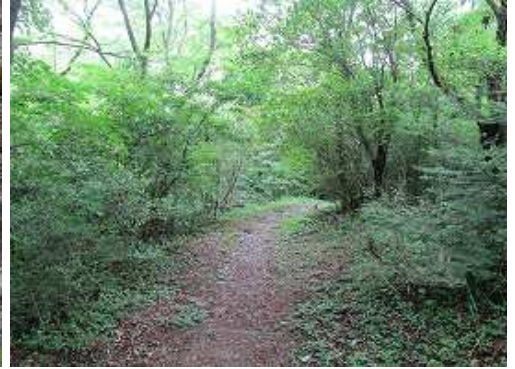
鳥居の先を右折してキャンプ場へと緩やかに下る。