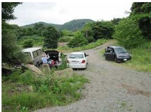
栗ノ木登山口に帰り着く。