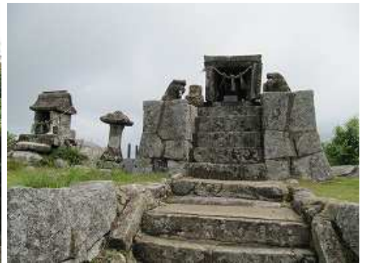
東峰に到着。大権現の上宮の社が鎮座する。ご神体は宗像三神。