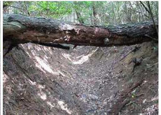
倒木の下をくぐる。