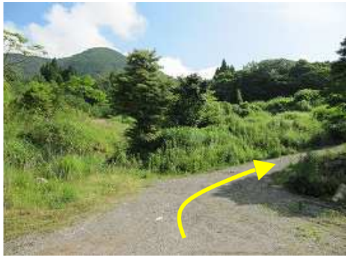
栗ノ木登山口から歩き始める。周辺の路肩に数台駐車できる。

栗ノ木登山口～鳥居～平之分歧～見返滝分歧～展望岩～栗ノ木分歧～東峰(権現神社上宮)～じゅんさい池～作礼山(887m)～栗ノ木分歧～展望岩～見返滝分歧～平之分歧～鳥居～栗ノ木登山口