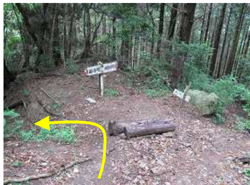
見返滝分岐まで下って来た。