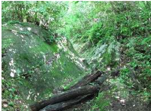
ガリー状の浸食路を緩やかに上る。