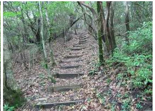
階段を緩やかに上る。