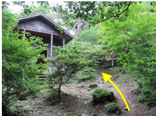
バンガローを抜けて行く。奥のバンガロー(市営)は解体中である。