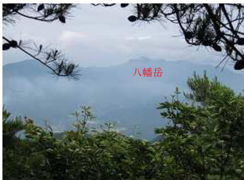
南南西の方向に八幡岳(764m)が見える。