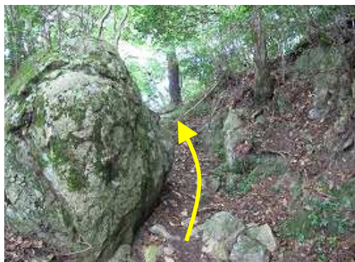
丸岩の間を抜ける。