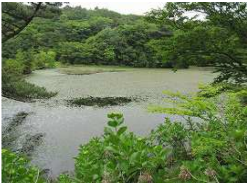
じゅんさい池を眺める。