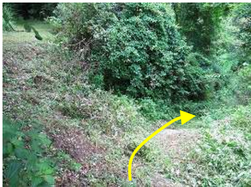
平之分岐を通過する。