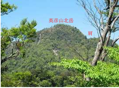
P912mから見た北岳。右の小段の所に肩の一本杉が確認できる。