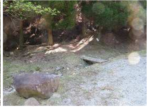
鷹ノ巣登山口を左に見て通過する。