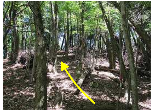
傾斜が緩んで来ると山頂は近い。