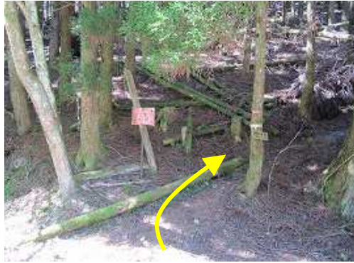
英彦山の裏取付に到着。右のスギの植林帯に入り緩やかに上って行く。