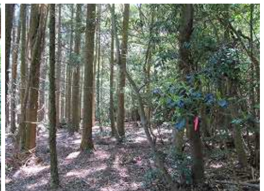
左にスギの植林帯が広がる。右側の植林境にそうように赤テープが見られる。