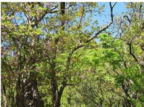
尾根筋から振り返ると樹間越しに英彦山南岳が望める。