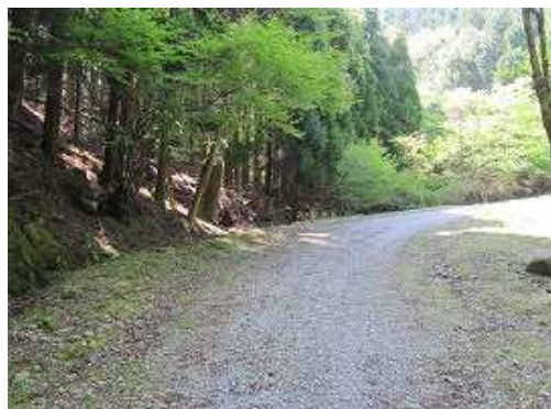
裏取付きが見えて来た。