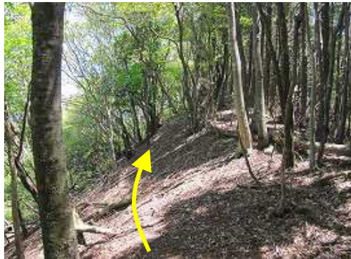
左斜面が明るい場所を通過する。