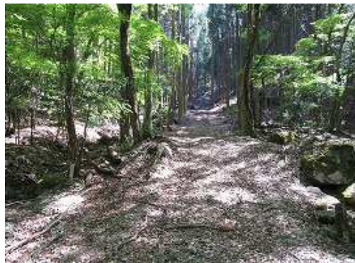
芎又山登山口に到着。作業路を詰めて行く。