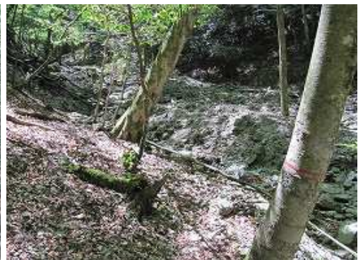
沢に降り立ち、上流側を見る。