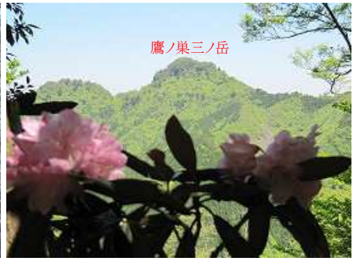
左に樹間越しに鷹ノ巣三ノ岳が望める。