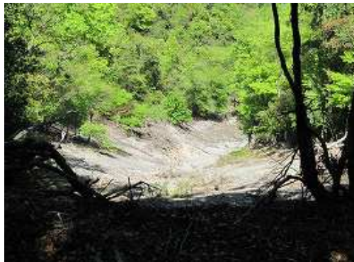
ブナ大木付近の滑り斜面を見る。