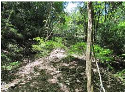
沢の対岸の上部に林道が見えるので、斜面を登る。赤テープ有。