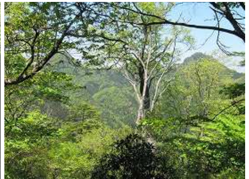
P912mへ立ち寄り、樹間越しに鷹ノ巣三山を見る。