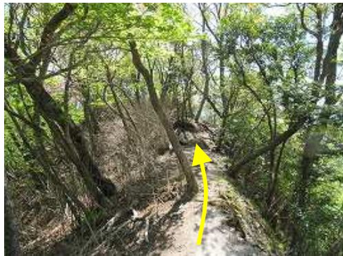
尾根筋を左へ向かう。