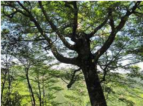
左側にブナの大木を見る。傍に斜面天端が迫っており、いずれ崩落する可能性が大きい。