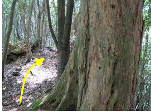
大きな朽木の左を抜ける。