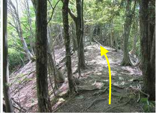
開けた尾根筋を抜ける。