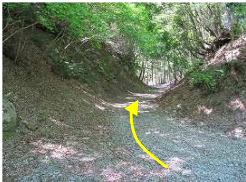
駐車地へ向けて薬師林道を歩く。