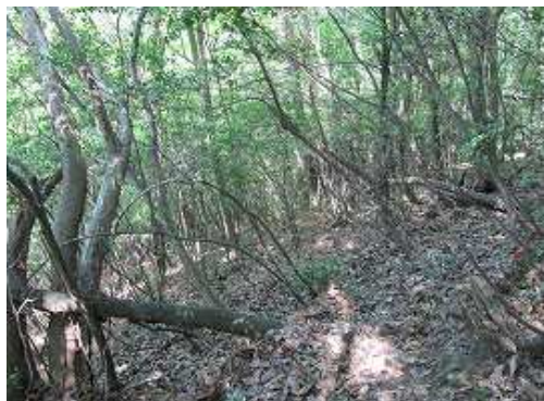
落ち葉が滑りやすい急斜面を赤テープを探しながら下って行く。このルートは熟達者向きである。