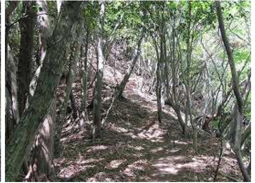
小尾根を緩やかに上る。