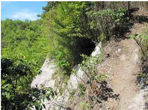
苺又分岐の尾根に着く。