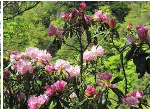
シャクナゲが咲きそろそろ。