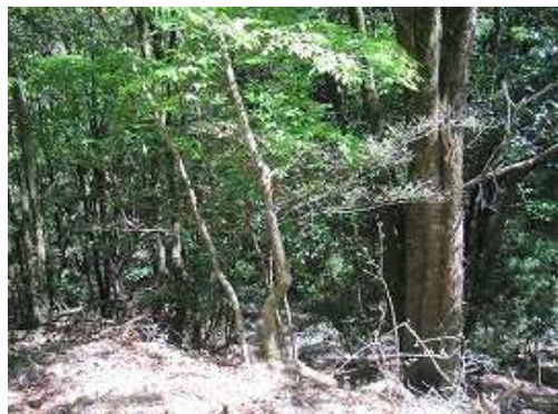
沢側の枝には赤テープが巻いてある。