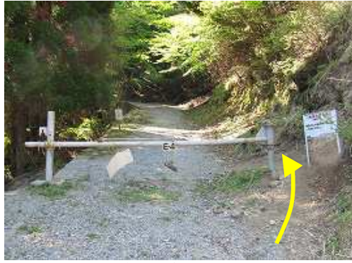
ゲートの右側を通る。