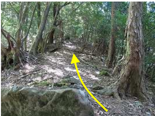
岩に積まれたケルンに出会う。直進して尾根筋を上る。