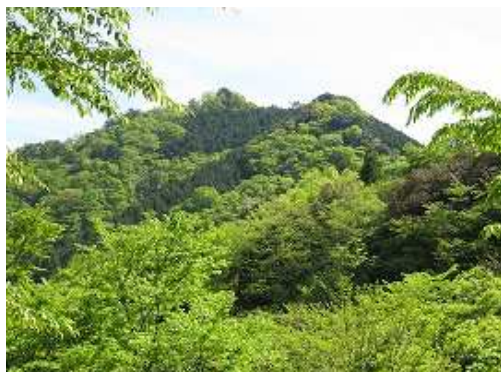
林道から振り返る芎又の山並み。