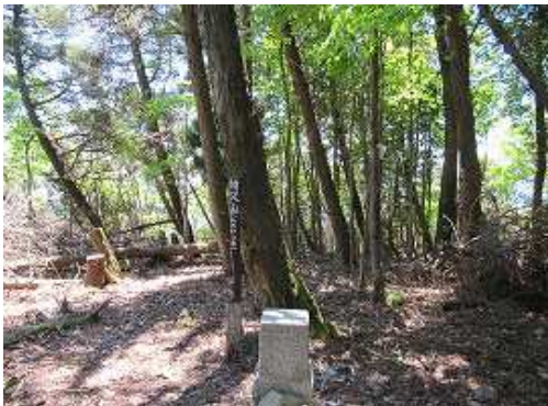
苧又山(960m)の山頂。三等三角点であるが、展望は得られない。これより掃路