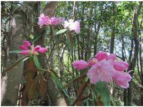
苧又山登山口への分岐に到着。周囲にはシャクナゲが咲いていた。