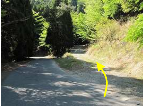
鷹ノ巣駐車場に車を止める。左手に薬師林道が見える。

鷹ノ巣駐車場～鷹ノ巣登山口～裏取付～苺又分岐～ケルン～分岐～林道分岐～苺又山(960m)～林道分岐～沢～林道出合～苺又山登山口～裏取付～鷹ノ巣駐車場