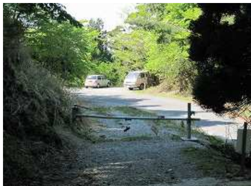
駐車地が見えて来た。