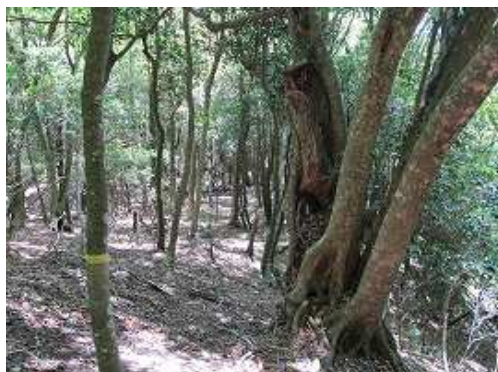
気持ちの良い尾根筋を緩やかに下る。