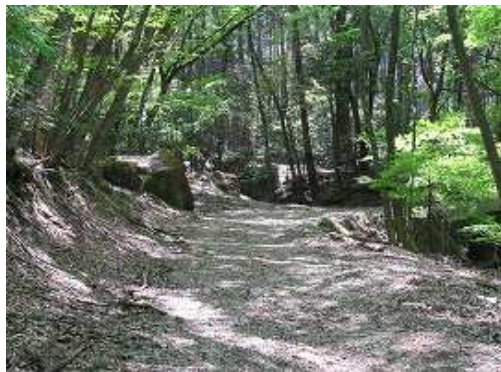
芎又山登山口が前方に見えた。