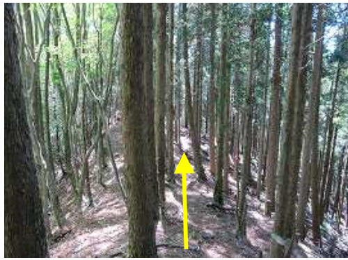
分岐から苧又山へは尾根筋のスギの植林帯の中を行く。