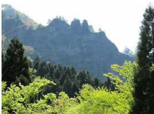
林道からの望雲台。