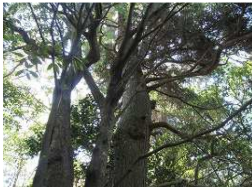
カヤの大木を見る。