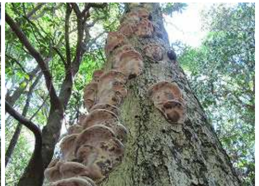
一列に並んだサルノコシカケ