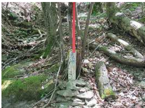
そばにある案内板。