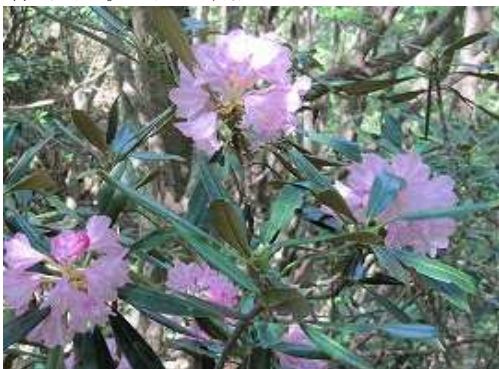
林道分岐から先の尾根筋のシャクナゲ。