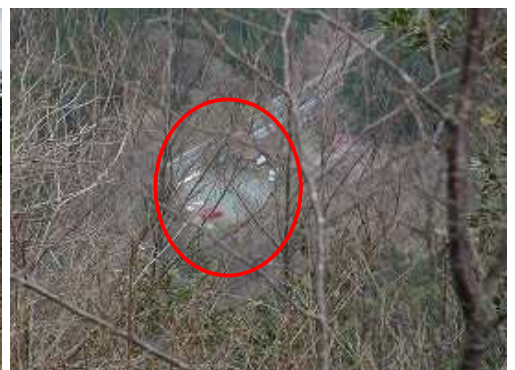
丸印が憩いの森展望所。