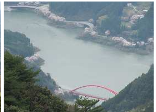
日向神ダムと鶴橋。湖岸の桜は満開。