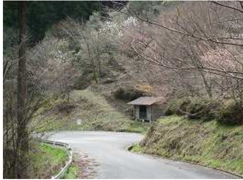
林道の左の奥には数台駐車できるスペースがある。