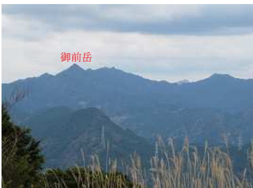
東方向には、御前岳、釈迦岳が見える。