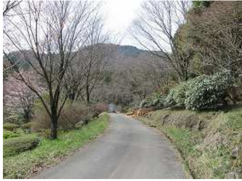
緩やかな林道を左に向けて歩き始める。