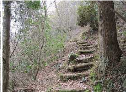
丸太階段に取付いて上って行く。