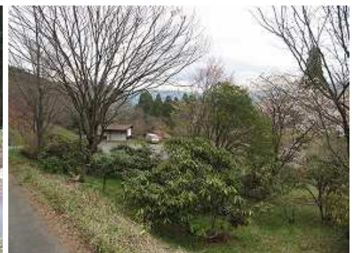
駐車地が近づいた。