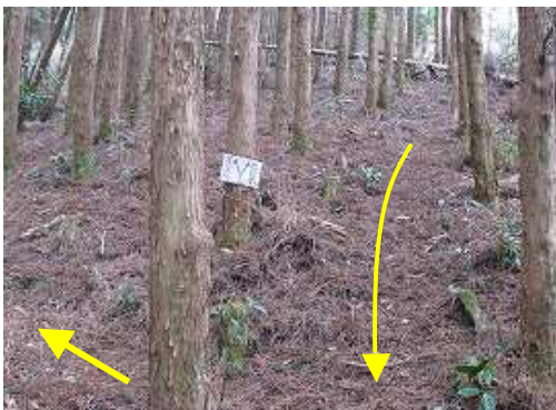
展望台分岐。右から下って来て左方向に、スギの植林帯を抜けるが、小枝のヤブがうるさい。