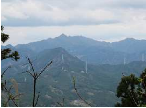
抜けたコルから左手に御前岳が望める。