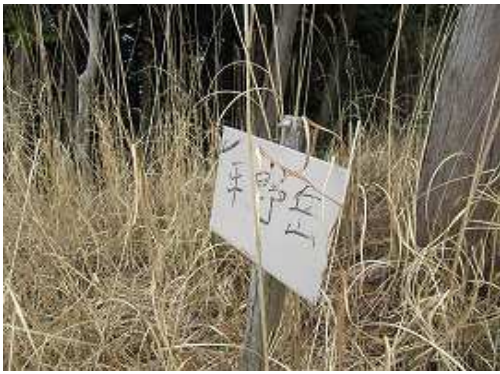
南側のカヤの中に立つ平野岳への案内を見て、急斜面を下る。