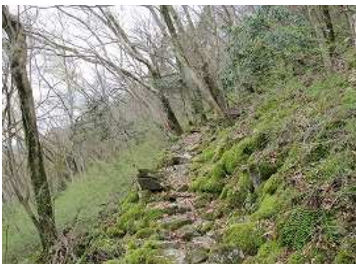
苔むすガレ場を抜ける。