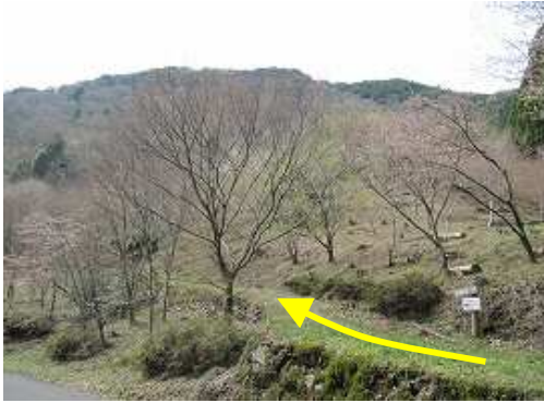
林道に出会う。正面に石割岳が見える。横断し左へ斜面の遊歩道を上って行く。