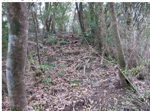
頂上直下のトラロープが張られた急な斜面を登ると山頂部である。