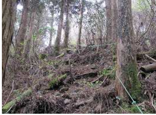
急な斜面を上り詰め、残置ロープが現れると平野岳はスグ。