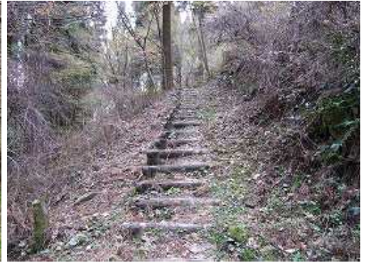
緩やかに丸太階段を上って行く。