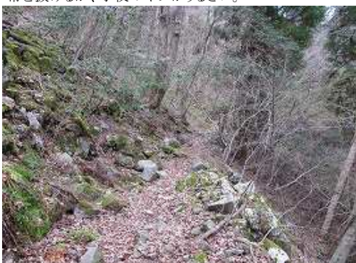
左側の道をジグザグの下って行く。遊歩道となり林道上の道に合流する。