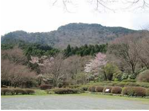
憩いの森展望所から石割岳の山頂が望まれる。10台程度駐車可能。

憩いの森展望所～林道横断～5合目～石割岳(942m)～展望所分岐～平野岳(895m)～展望所分岐～5合目～林道横断～憩いの森展望所