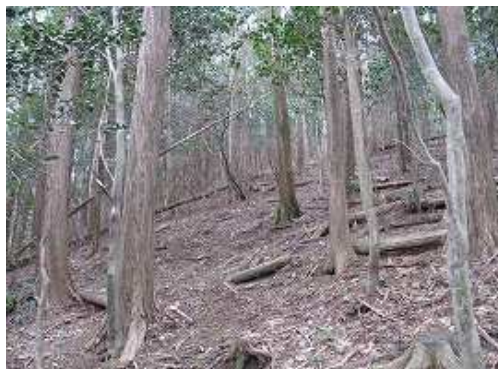
石割岳山頂の尾根筋のコースが右から出合う。