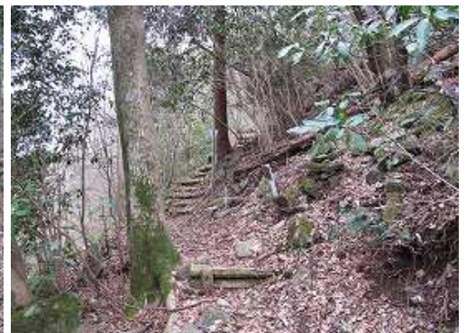
5合目に到着。奥の階段は上りに歩いた。