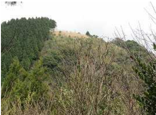
石割岳の山頂を望む。