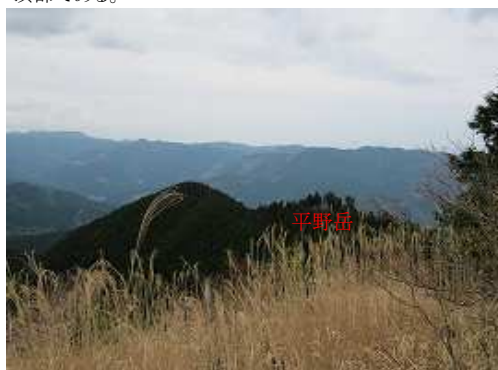
これから向かう平野岳。