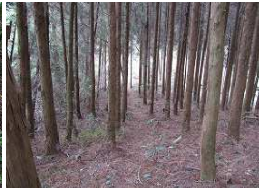
スギの植林帯を抜ける。抜ける手前に展望台分岐がある。