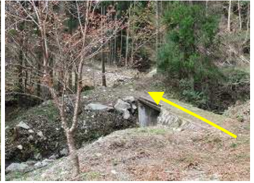
林道の終点部では伐採作業中であつた。左へ沢を渡り上って行く。