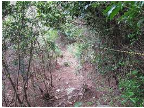
トラロープが張られた急斜面の下りが100mほど続く。