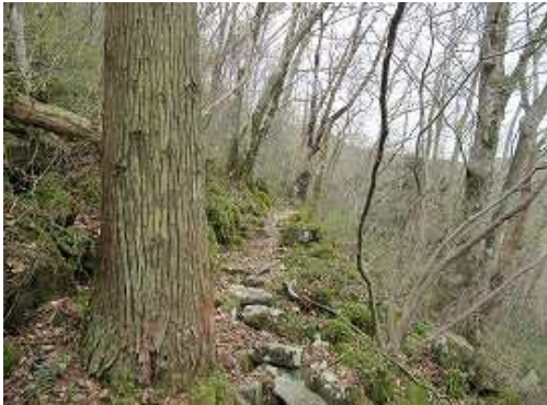
石割岳の北斜面を緩やかにジグザグに上って行く。