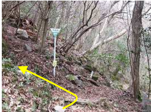
5合目に到着。上りは左側へ進み、下りには右奥から降りてきて、右下へ下って行く。