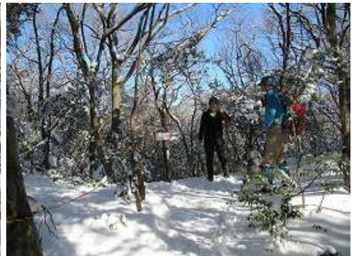
尾根分岐に上り上がる。右に尾根筋に沿って緩やかに上る。