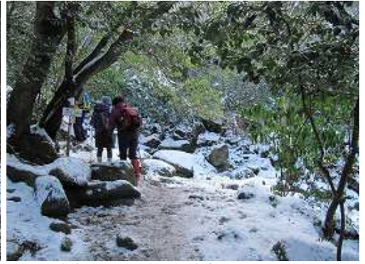
うさぎ道取付に到着。うさぎ道は沢を渡り対岸へ。