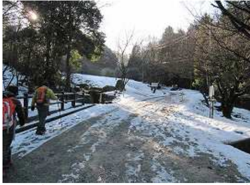
昭和の森Pに駐車し、猫石キャンプ場方面へ凍った道路を歩き始める。

昭和の森P～河原谷合流～うさぎ道取付～難所ヶ滝～尾根分岐～難所ヶ滝分岐～頭巾山入口～頭巾山(901m)～頭巾山入口～三郡山(936m)～樺谷B分岐～樺谷B取付～樺谷分岐～頭巾山取付～砥石山分岐～昭和の森P