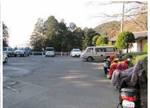
昭和の森駐車場に帰着いた。