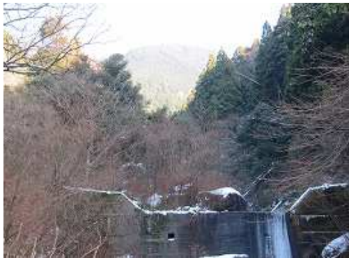
砂防ダムの奥に頭巾山を望む。