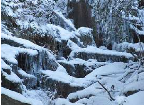
右側からの小さな沢の上部の小滝を見る。