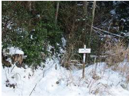
ツキ谷B取付に到着。林道を右へ20m進むと案内板がある。