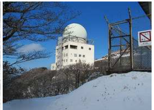
ドームの建つエリアに到着。フェンスに沿って右に回り込む。