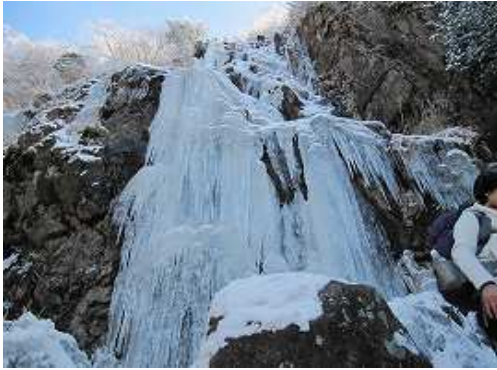
難所ヶ滝 氷結は今一の感じであるが、それなりに楽しめる。