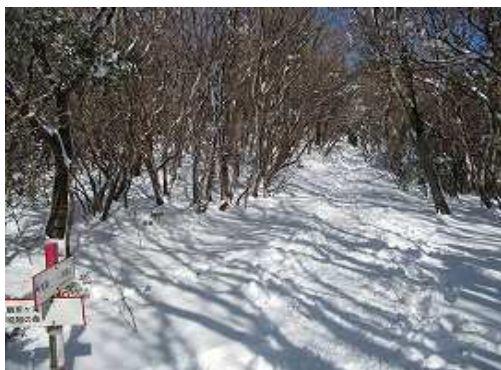
難所ヶ滝分岐に出会う。南北に走る縦走路である。