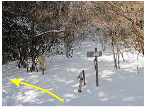
ツキ谷B分岐に到着。左方向へ杉の植林帯の斜面を下る。