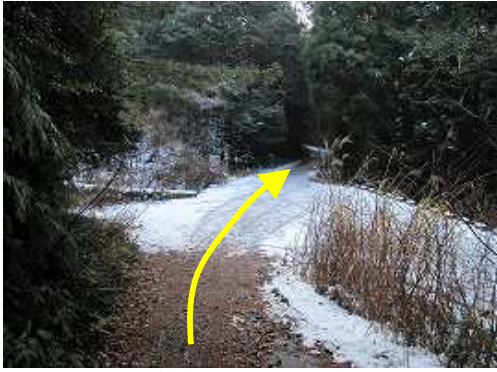
河原谷に合流し、沢沿いに緩やかに上る。