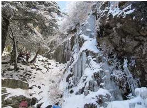
左側の壁の氷結も小さい。