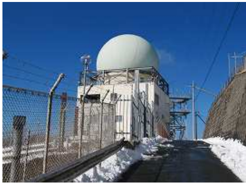
道路を歩いてドームの横を抜ける。