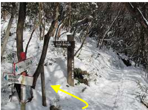
頭巾山入口 頭巾山は左へ100m程度。