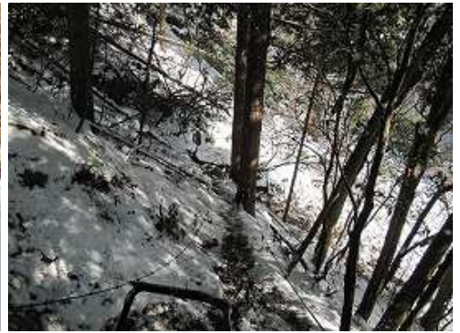
残置ロープを下ると沢に出会う。