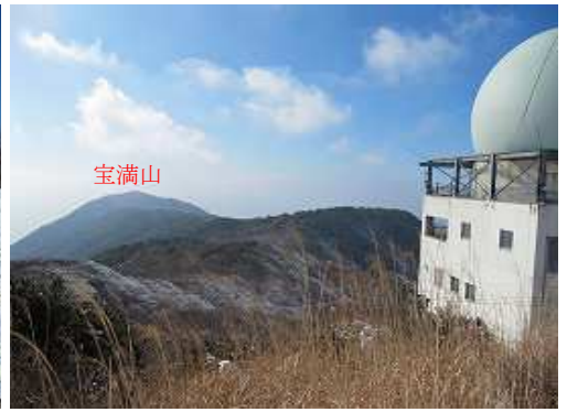
宝満山方面の眺め。