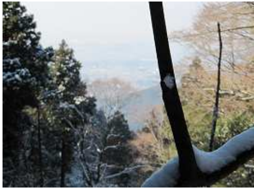
谷間から福岡方面を望む。