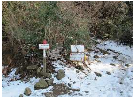
左側に頭巾山取付を見送って下る。