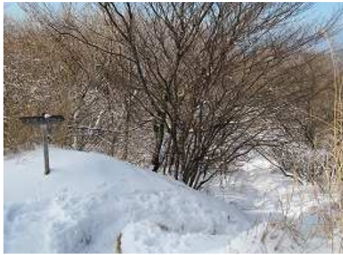
縦走路を砥石山方面へと下る。