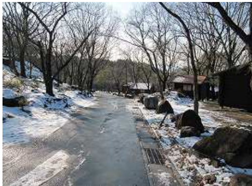
昭和の森キャンプ場のバンガローを抜ける。