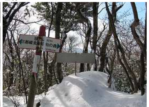
頭巾山(901m)の山頂。展望は得られないが枝越しに宝満山方面などが望まれる。