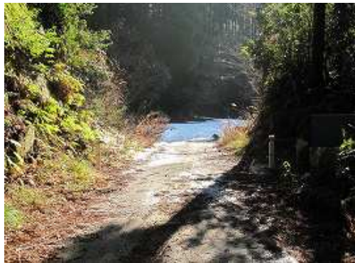
林道のクサリを越える。