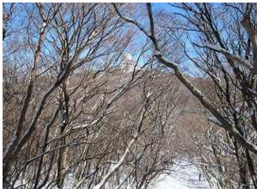
樹間越しに三郡山のドームが見えた。