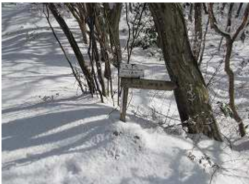
天の泉への分岐を通過する。