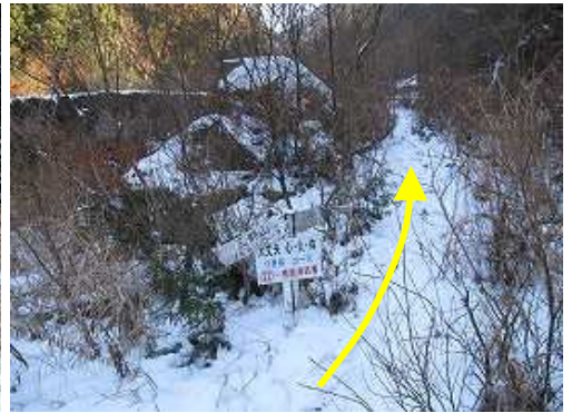
ツキ谷分岐。左はツキ谷Aコース。矢印はBコース。林道を下って行く。