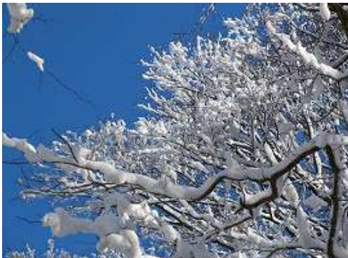
青空に雪をまとった枝が映える。