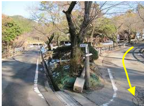
砥石山分岐を通過すると駐車場は近い。矢印から下ってきた。