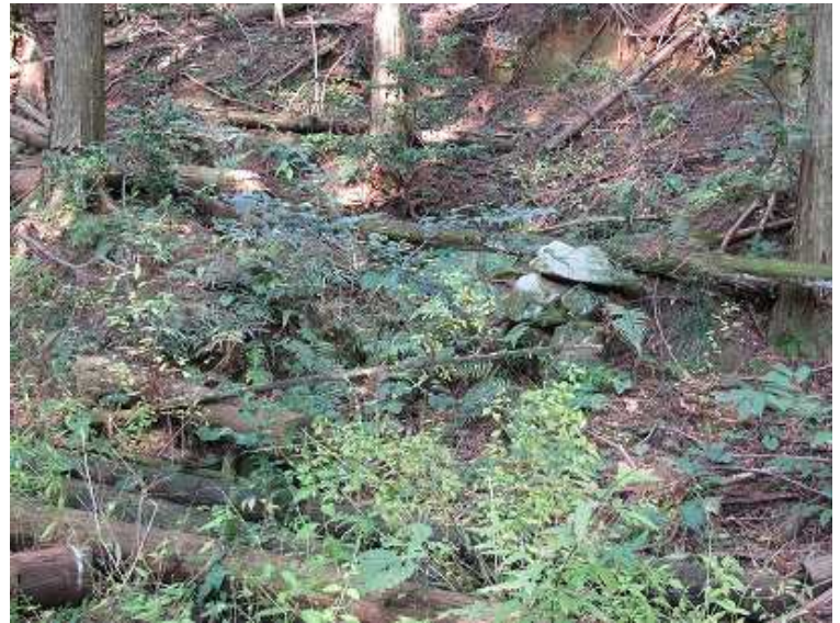
10:35 右側に炭焼き窯跡を見る。