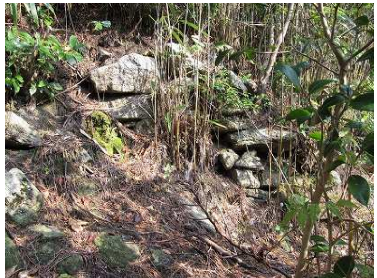
10:21 山頂直下に残る鷲ヶ城の石垣。