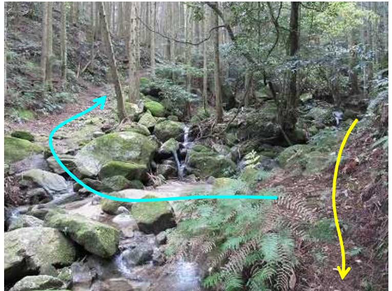
11:44 左岸に沿って下ると右岸に明瞭な切り出し道が東方向に伸びているようだ。矢印のように下ってきた。