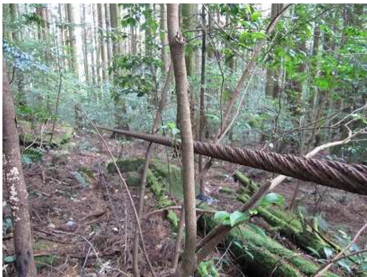
10:51 およそ南北に太いワイヤー(40mm位)が張られていた。