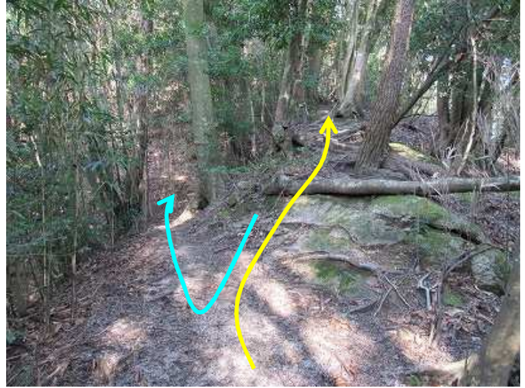
10:01 分岐に着く。山頂は尾根筋を行く。左の斜面は周回コースで、途中から右斜面を登り尾根に達し、檜木畑へ向かう。