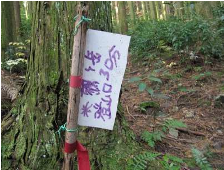
スギの根元に案内板が付けられている。植林の中を緩やかに上って行く。