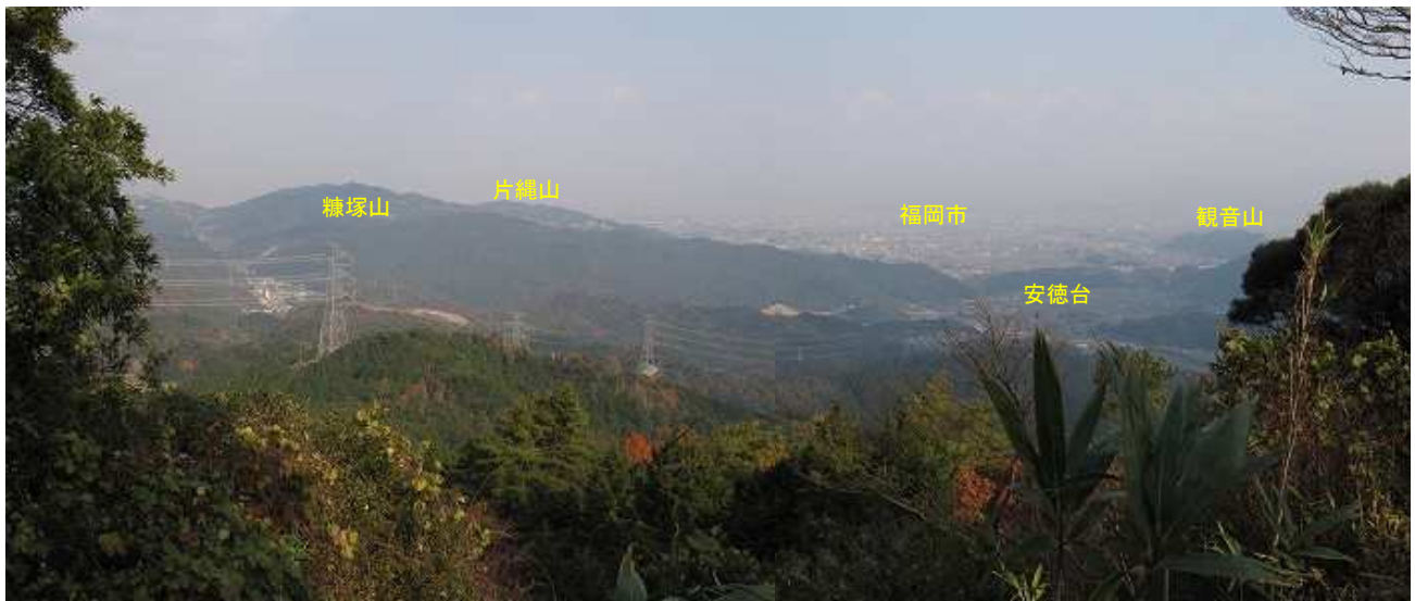
山頂から北方向の眺め。