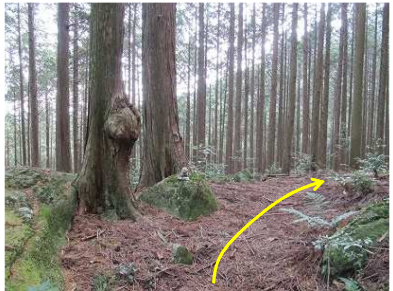
10:41 コブ付のヒノキの横を抜ける。