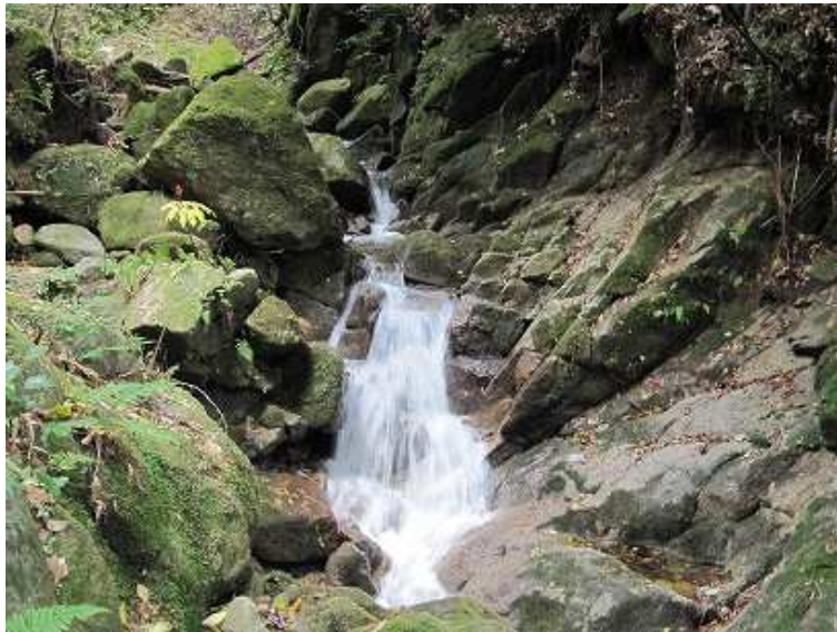
11:08 落差2mの滝が落ちる。途中に残置トラロープの架かる所があるが、左岸側の斜面に取りつき、ここを抜ける。