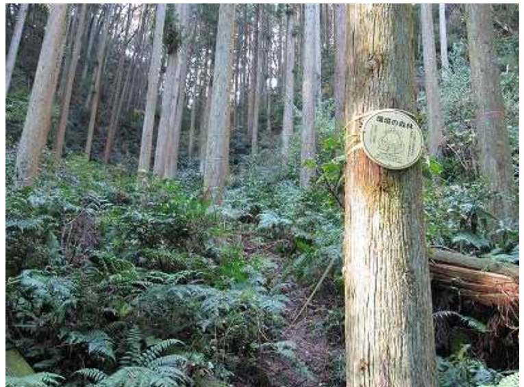
9:51 黄色のビニールテープが張られたヤブ混じりの中を左方向に巻くように行き、小尾根に上がり右へ尾根筋を緩やかに上る。