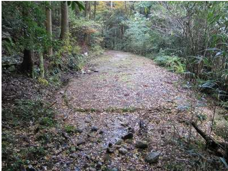
11:46 仲ノ畝林道の終点に出会う。