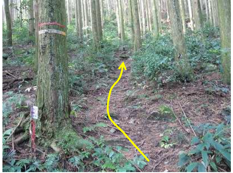
9:40 仲ノ畝登山口に到着。路肩のスペースに車を止める。