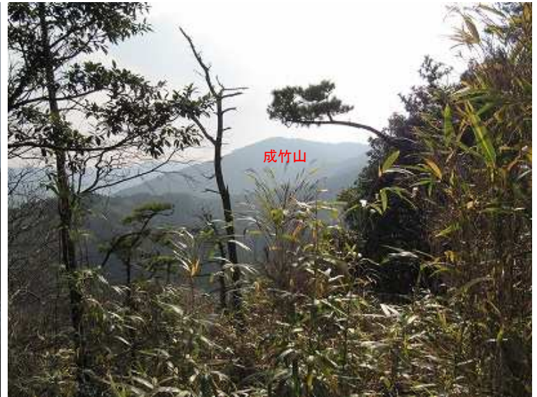
南東方向には成竹山(580m)が望める。