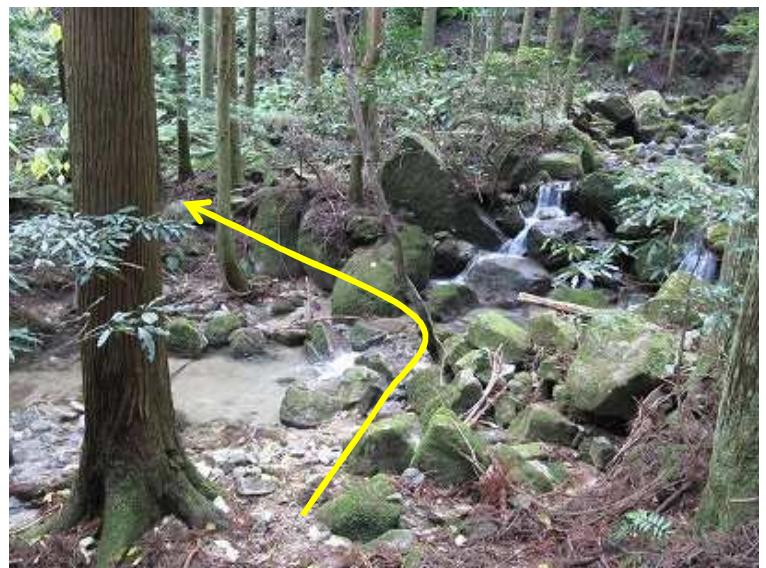
10:52 沢を渡る。この沢に沿って赤テープを見つけながら下る。この時点で檜木畑へは行けないと判断した。