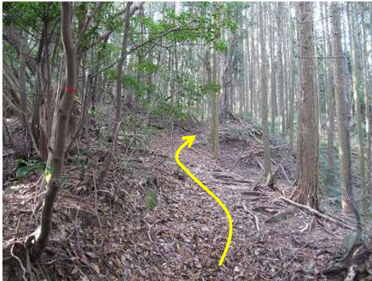
10:31 分岐から山腹を巻いて弱い鞍部に達する。尾根の左斜面を巻くように赤テープが付いていたので、これを伝う。