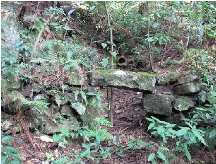
9:47 右側に炭焼き窯跡を見る。