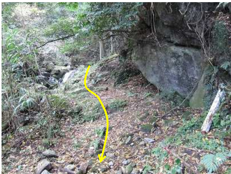
矢印の方から下ってきた。