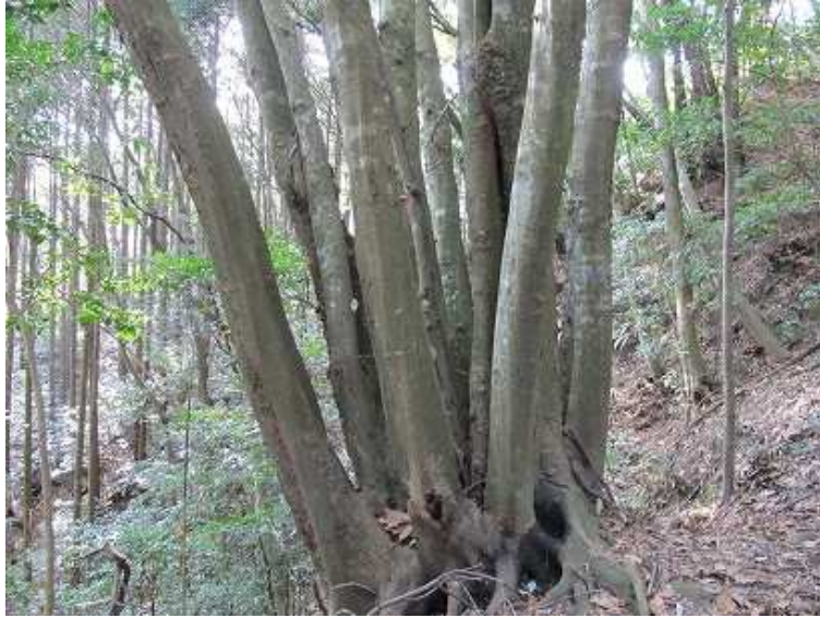
9:59 左側に12本の枝を伸ばすシイの木の横を通る。