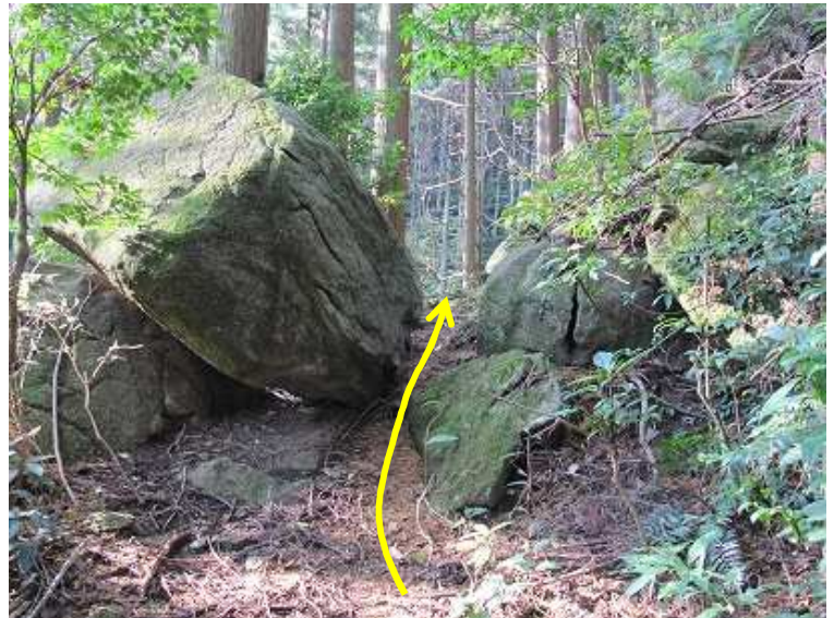
9:45 大岩の間を抜ける。