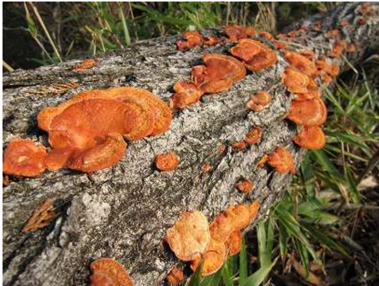
クヌギに付いたキノコ。