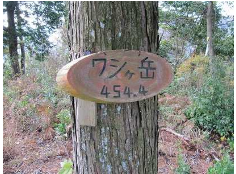
鷲ヶ岳(454.4)の山頂プレート。