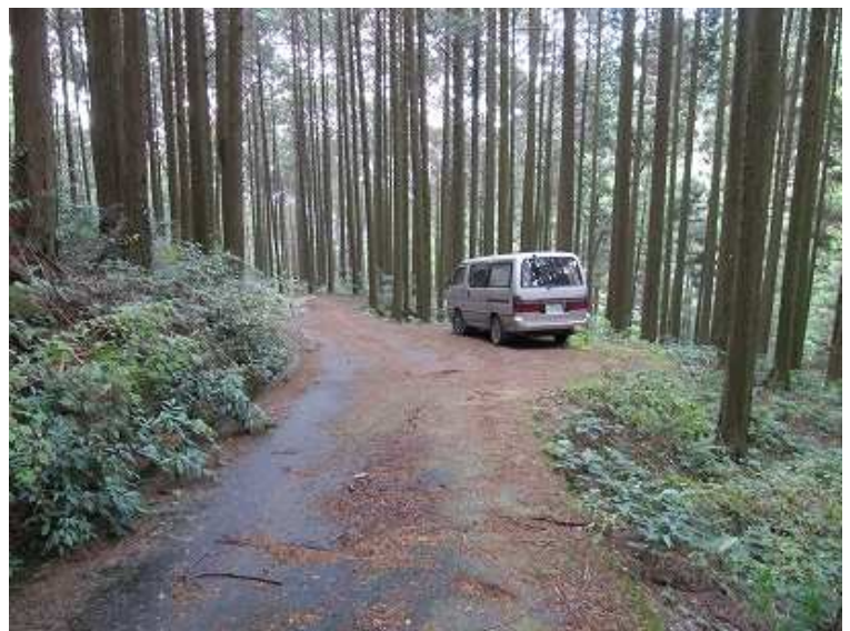
11:52 登山口に帰り着いた。