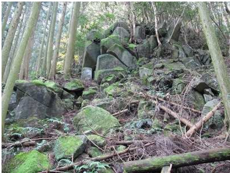
10:37 右側の斜面に巨石が連なっている。