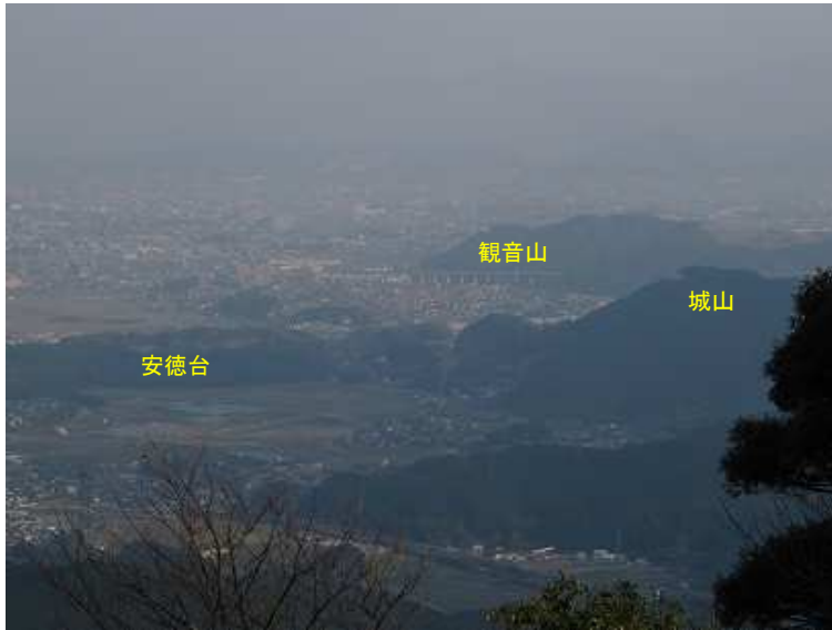
観音山方面をアップする。