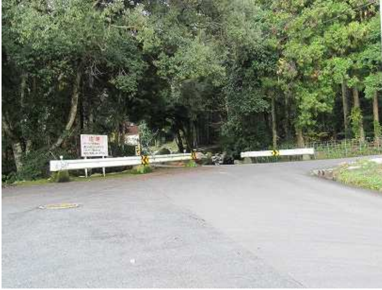
9:27 仲ノ畝林道入口に着き、ガードレールの切れ間から林道へ入り沢沿いの上って行く。

仲ノ畝登山口～分岐～鷲ヶ岳(454m)～分岐～炭焼窯跡～沢～滝～右岸道有～仲ノ畝林道終点～仲ノ畝登山口