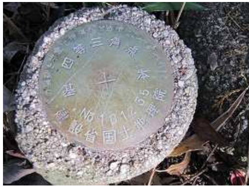
四等三角点が設置されている城山山頂(195.4m)