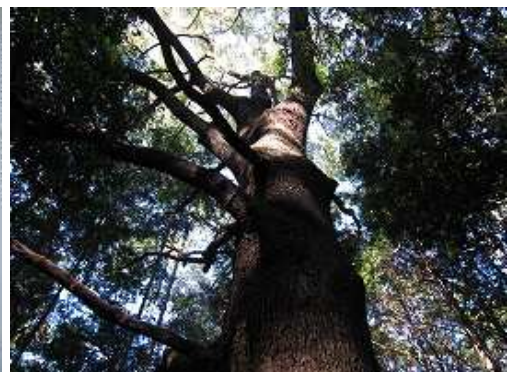
階段を上り終え、その先の左側には立派なタブノキが聳っていた。