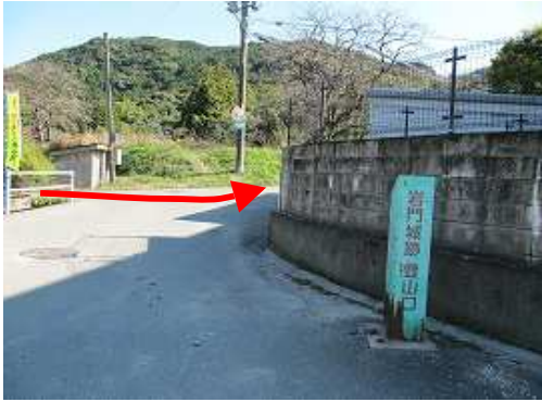
三叉路を左へ向かう。右に少し折れた所に岩門城跡登山口の案内が立っている。