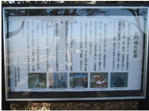
北の曲輪に立つ案内板。