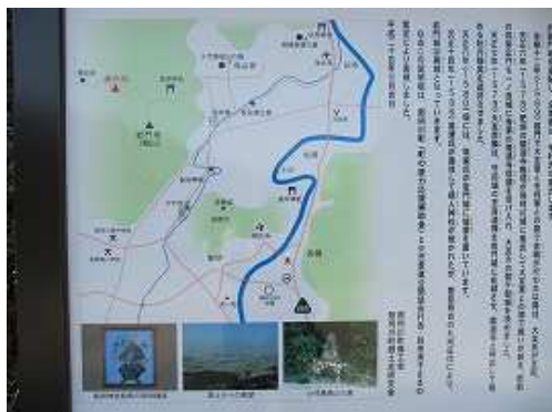
傍の案内板に目を通し、引き返す。