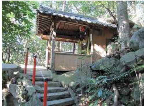
赤鳥居が並ぶ石段を上り詰めると高津神社。社務所の右を回り込んで先へ向かう。