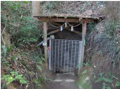
山からの湧水を溜めた水ノ手。