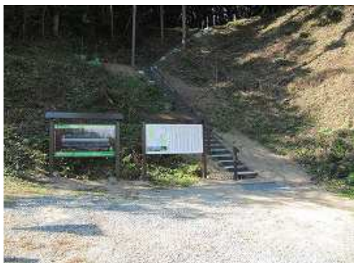
梶原口。4〜5台程度駐車可能。