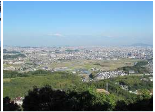
北側の展望 眼下に安徳台と福岡市街。