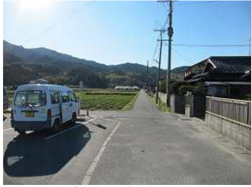
横の南へ伸びる道路を歩き始める。