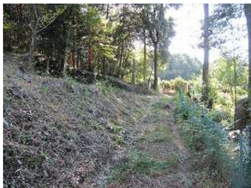
神社下分岐から降り、竹林を抜けて神社下へ戻って来た。