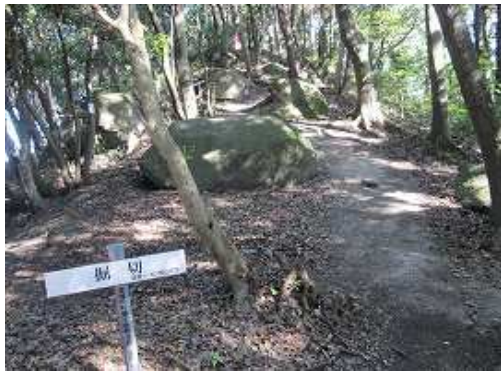
幅約24mの堀切。奥が山頂。