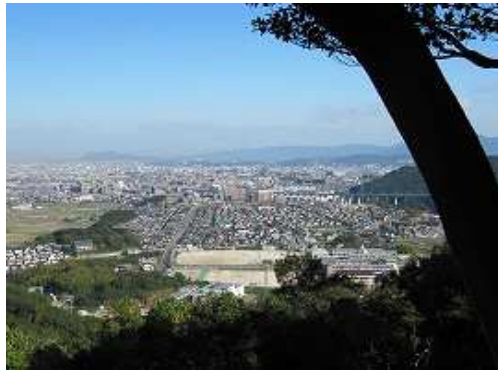
北側の展望 九州新幹線と博多南駅方面。