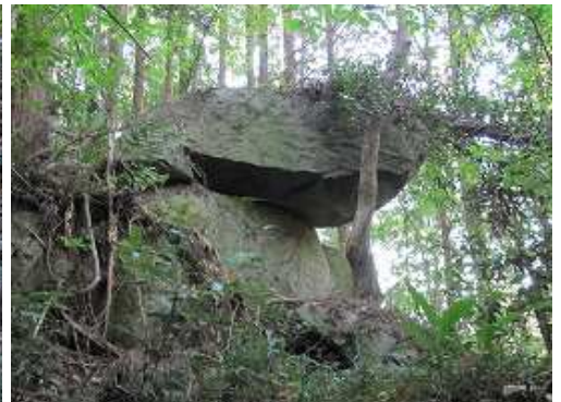
茶臼岩。大岩の上に平たい一枚岩が載っている奇岩。物見場だったのかも。