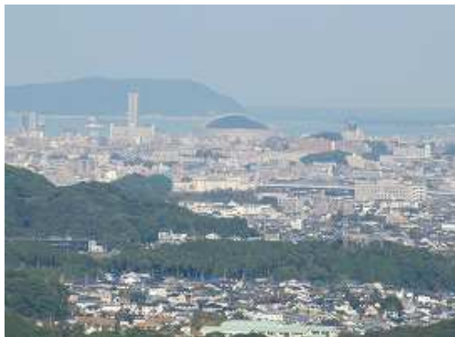
北側の展望 福岡ドーム。