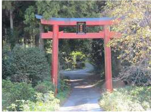
高津神社の赤鳥居をくぐる。