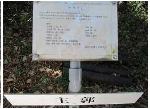
岩門城の主郭であった場所で、平坦面積約180㎡。曲輪群の最高峰に位置している。