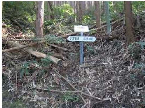
竹林を抜ける神社下分岐を通過。