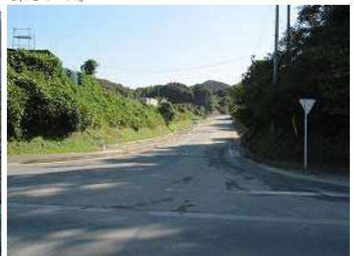
梶原口入口。県道575号の白水木材の前から入る。道なりに1.5km進むと右側に梶原口がある。