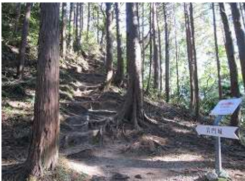
尾根へ着いた。山頂は左へ向かう。右へ向かえば梶原口へ至る。