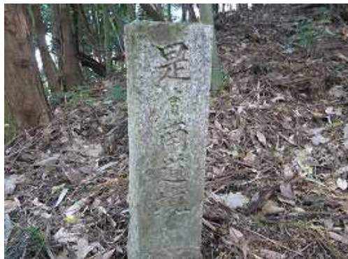
梶原口への途中で見かけた左側に立つ境界石柱。