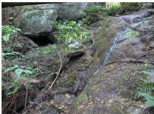
尾根まで戻り茶臼岩を過ぎ、右へ10m程下ると岩の中央部に細い一筋の水が流れるソウメンの滝(仮称)。