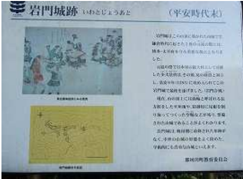
傍に立つ岩門城跡の説明板を読んで石段を上る。左のワダチは上部で合流する竹林を抜けるコース。