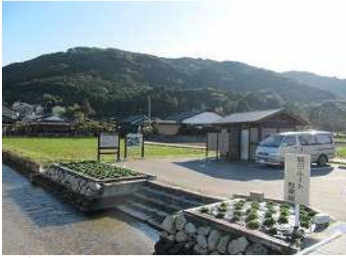
裂田の溝Pに車を止める。奥の山並みが城山(岩門城跡)。

裂田の溝P～神社下～高津神社～神社下分岐～茶臼岩～尾根～城山(195m)～北の曲輪～梶原口～尾根～神社下分岐～神社下～岩門城跡登山口～裂田の溝P