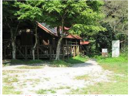
キャンプ場に到着。平日にもかかわらず、にぎやかしい。