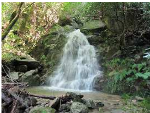
F7 花乱の滝 落差5m程度。