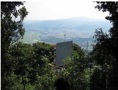
反射板越しに筑紫野市街地を見る。