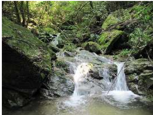
F5 夫婦の滝 2条の落差1m程度。