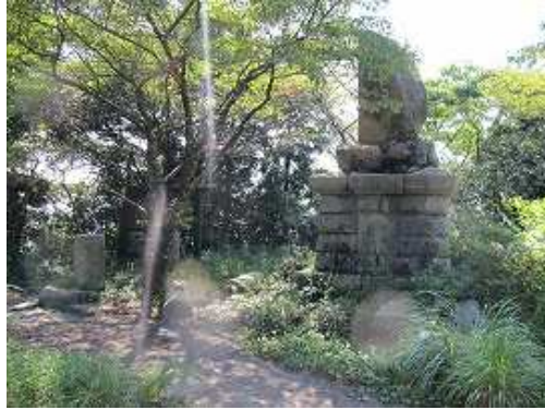
中宮跡。左側に行者道の入口がある。