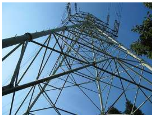
大行事原に聳える18号鉄塔。緩やかに下ると山口分岐に出会う。左折して林道を歩く。