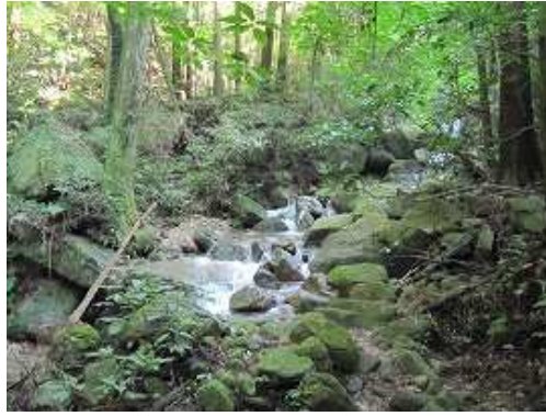
最初の渡渉地を入溪点とした。