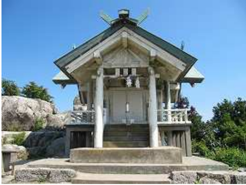
宝満山(829m)の山頂に鎮座する竜門神社上宮。