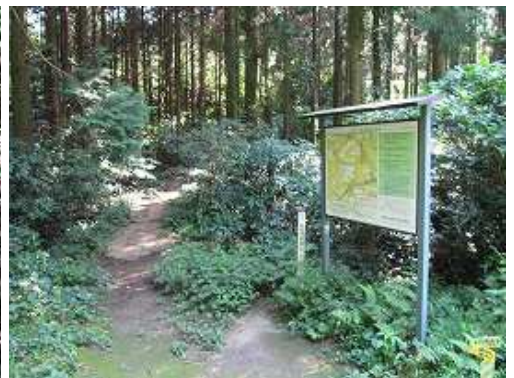
鳥越峠(鳥追峠)に到着。