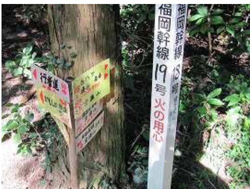
18号鉄塔入口への案内板。スギの植林帯を抜け緩く下る。