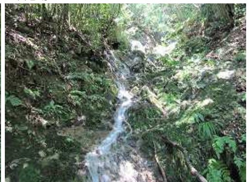
F12 斜滝 落差15m程度。ワラジのフリクションがよく効いて快適に上る。