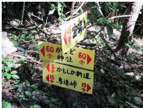
かもしか新道分岐に出会う。右へ下る。