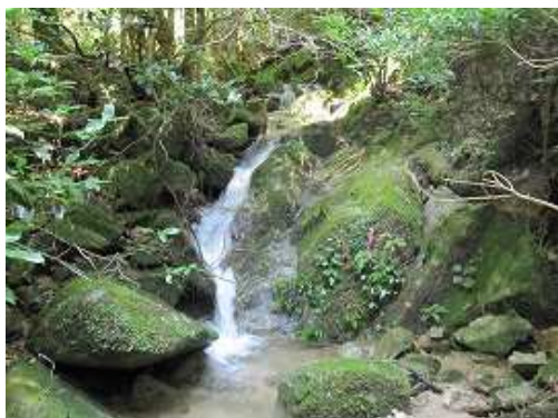
F10 斜滝 落差3m程度。