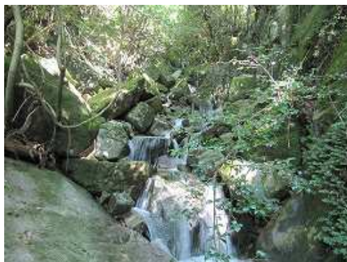
F11 爆音の滝 多段の滝で落差1m程度。この先で左の沢に入る。