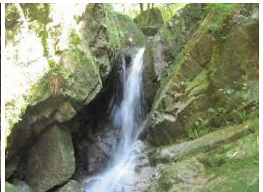
F9 黎明の滝 落差3m程度。右側のトラロープを利用して高巻く。