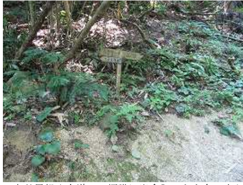
大谷尾根や女道への標識に出会う。これを右へ向かう。