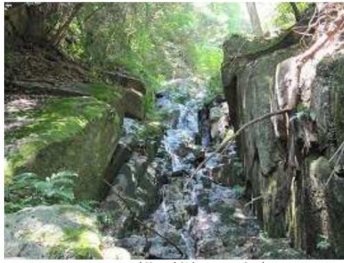
F14 スラブ状の斜滝で20m程度。