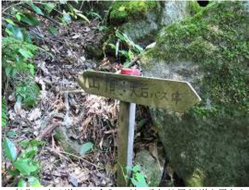
南北に走る道に出会う。下れば大谷尾根道と思われる。これを右へ上る。