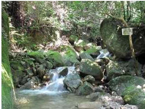
F4 扇の滝 落差1m程度。