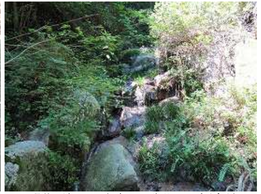
F15 段状の滝で10m程度。この先谷はヤブが多くなる。