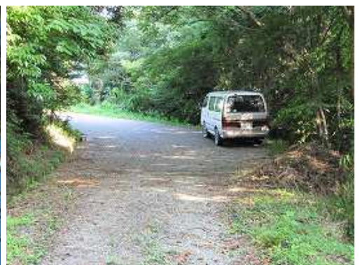
猫谷川登山口に帰着いた。