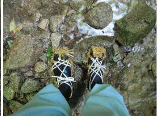
本日の足ごしらえは自作のワラ縄製のワラジを使用した。全く滑らずキャンプ場まで十分に対応してくれた。