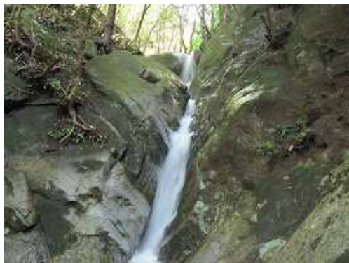
F8 養老の滝 ルンゼ状の滝で落差10m程度。