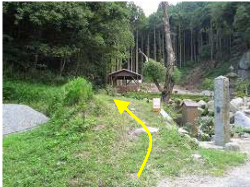
シラハケ登山口 2台駐車可能。開けた所は石仏を置いたりして壺場を創っているようだ。