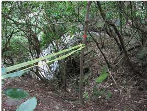
堤谷の左岸に降りる。