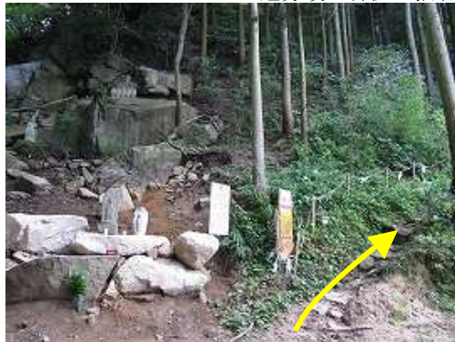
広場を横断してシラハケ尾根へ取付く。