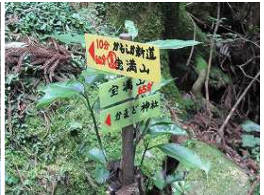
かもしか旧道分岐