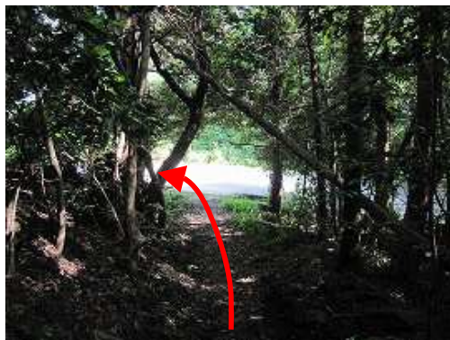
猫谷川登山口が見えた。林道を左へ歩くとシラハケ登山口へ至る。