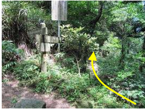
女道分岐に到着。キャンプ場まで緩やかな水平道が続く。