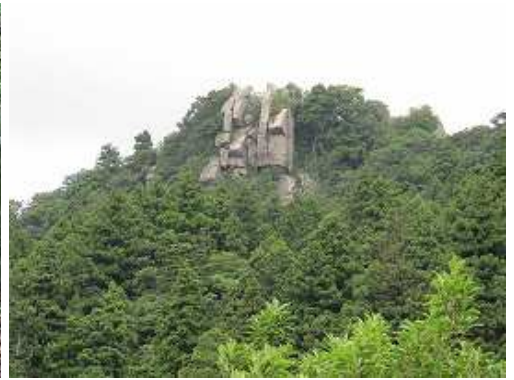
剣の岩から宝満山頂部を望む。