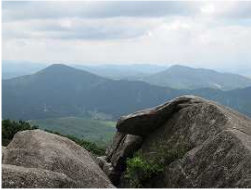
剣の岩から大根地山と砥上岳を眺める