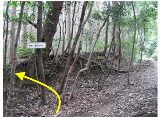
堤谷ルートの下降口。左の斜面を下る。