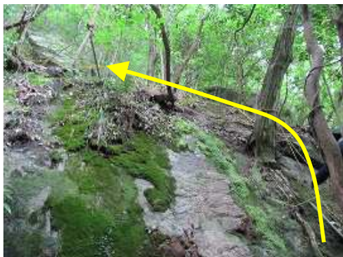
初音の滝の右側の壁を上る。