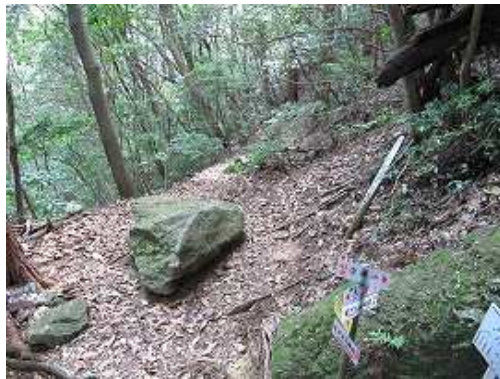
かもしか新道分岐