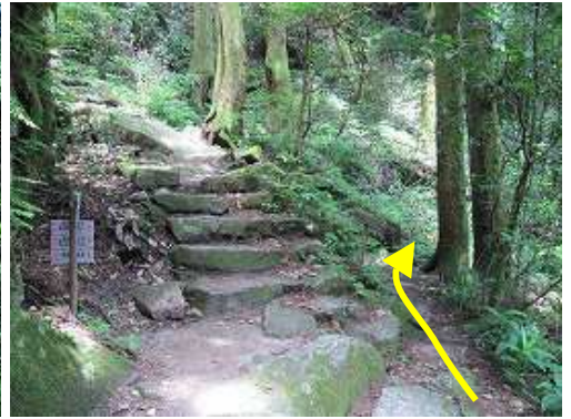
大谷尾根分岐。石段を登ればキャンプ場へ至る。石段の先右側に水場あり。