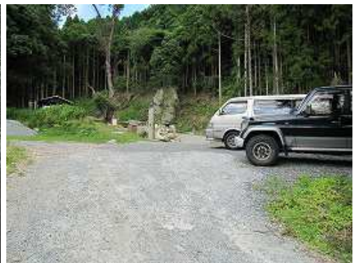
出発地に戻り着く。