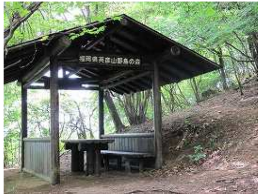
野鳥観察小屋到着。強い風が吹きわたっている。