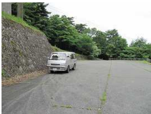
駐車場へ帰り着く。