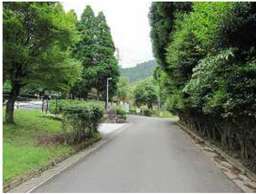
野営場の右を回りバンガローを抜ける。