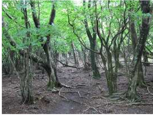
左へ回り込みひと登りすると傾斜も緩み、シオジ林が広がる。