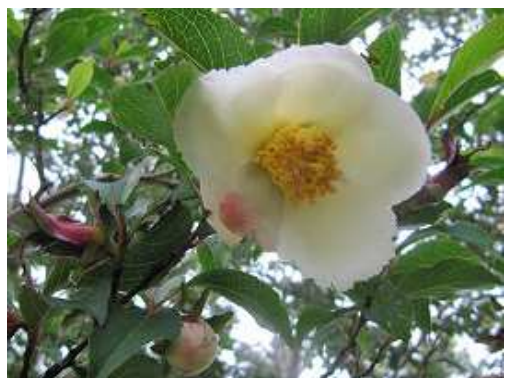
ヒコサンヒメシヤラ