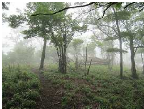
枯死木草原の端部にあがる。ガスって展望が利かない。時折雨が落ちてくる。