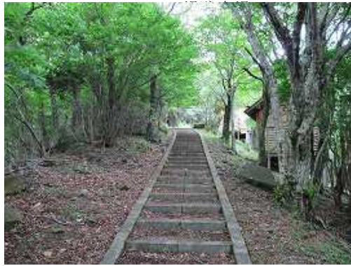
石段に取りつく。風が強くと折シロウドンがパラパラと落ちてくる。