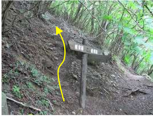
観察路分岐に到着。北西尾根は直進する。