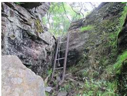
大岩のハシゴを越える。