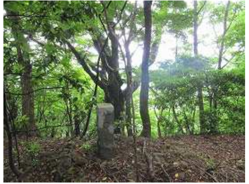
尾根東側の端部にある「八〇」の石柱。付近にはブナの古木が多い。