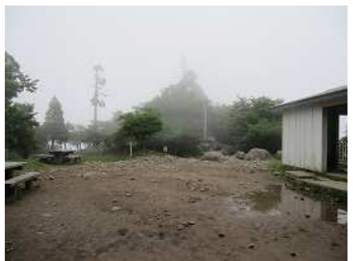
中岳広場に到着。右の小屋で昼とする。