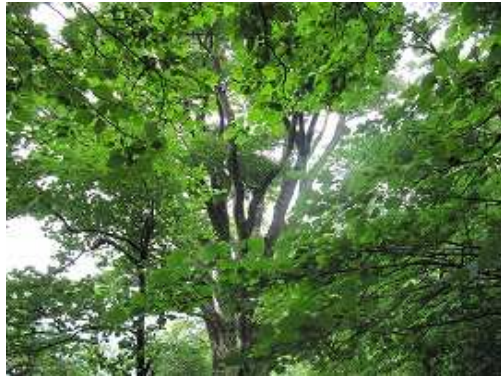
ブナの青葉がすがすがしい。