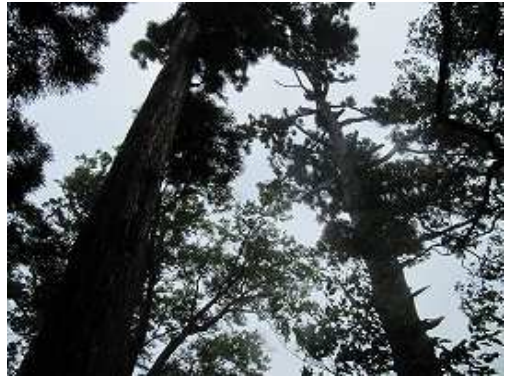
天然杉の傍を通過。