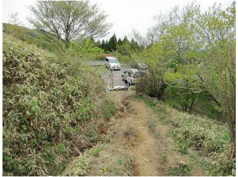
12:49 駐車場へ戻り着いた。