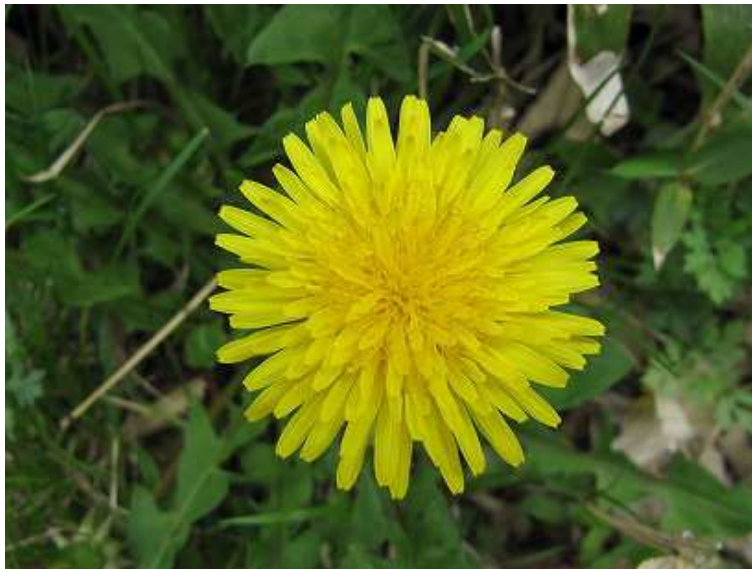
セイヨウタンポポ