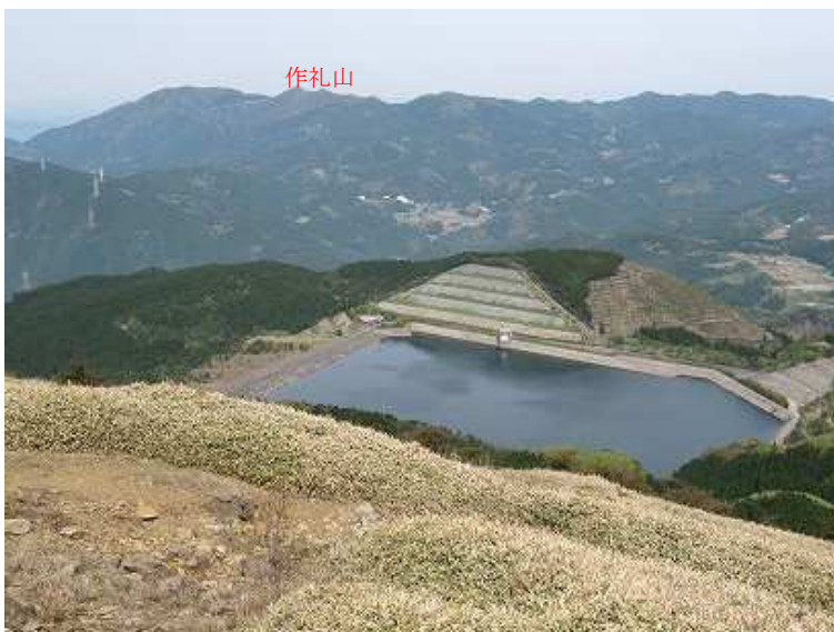
9:44 眼下に天山揚水ダム。奥の山並みは作礼山。