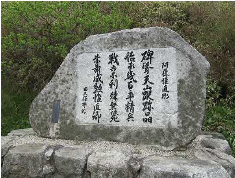
駐車場横に建つ阿蘇惟直の石碑と説明板。