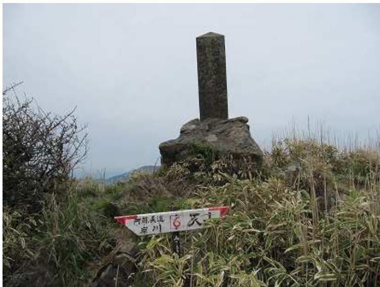
11:41 あめ山(996m)の山頂に建つ植林記念碑。