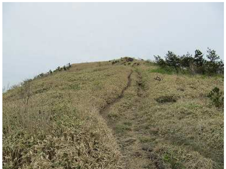
11:36 緩やかに笹の草原を上る。