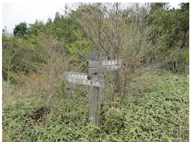
12:16 天川駐車場への分岐。