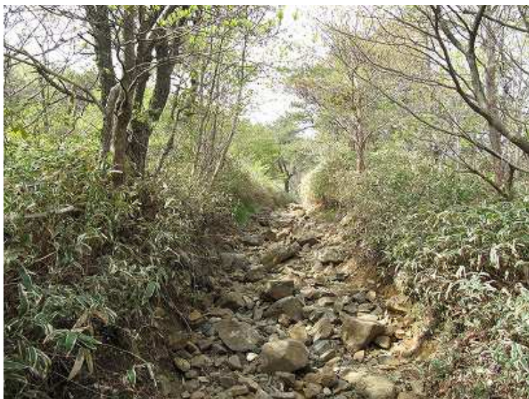
9:32 歩きにくい石ゴロの道。