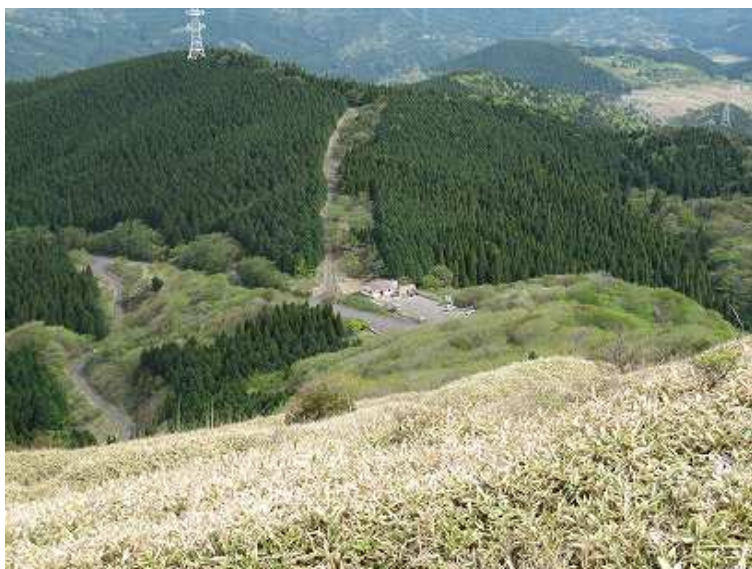
9:43 灌木を抜け振り返ると天川駐車場が見えた。