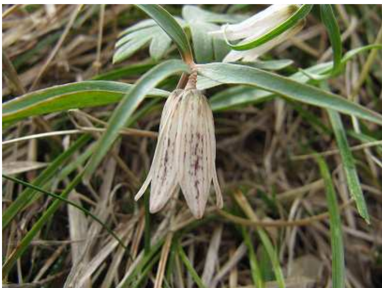
ホソバナコバイモ