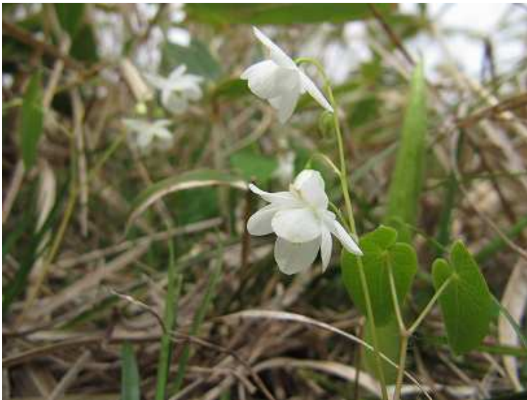
バイカイカリソウ