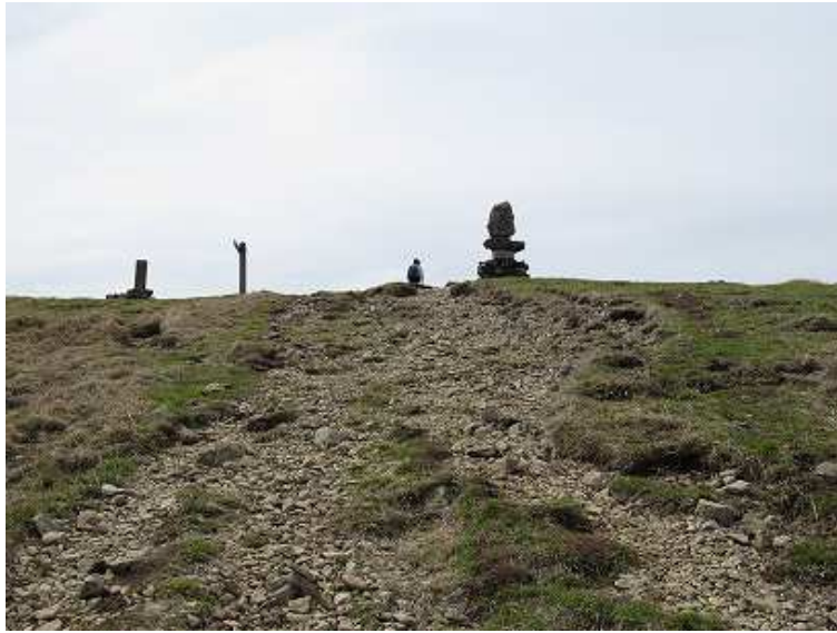
9:45 山頂の石碑が目前に。