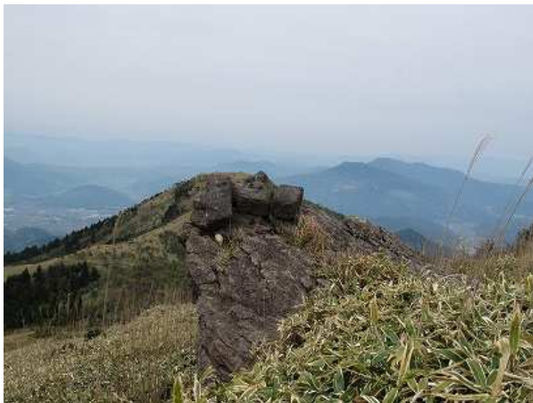
11:17 東端までオキナグサを探しながら進み、引き返し山頂からあめ山へと向かう。岩の上に横たわる石仏3体。その背後があめ山。