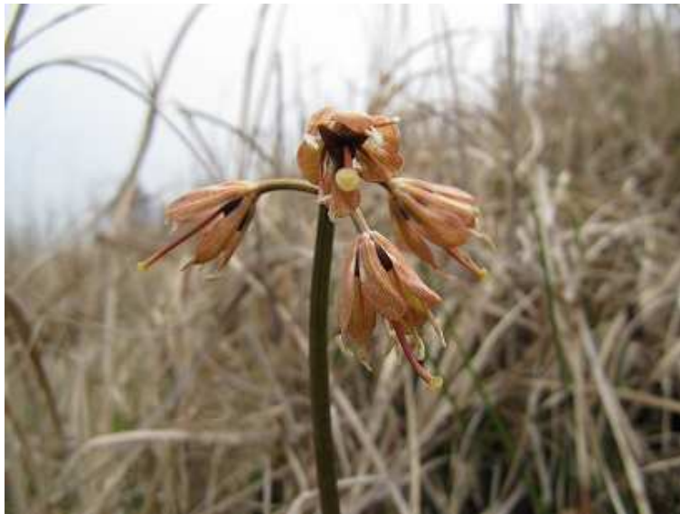
ツクシヨウジョバカマ