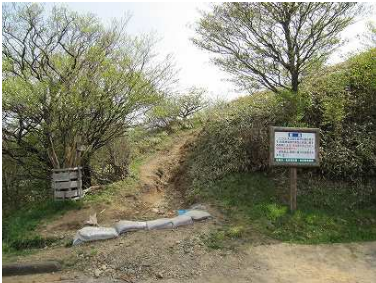
9:23 天川駐車場の横から取付く。20台ほど駐車できる。トイレも完備。近くに阿蘇惟直の石碑が建つ。

天川駐車場～あめ山分岐～天山(1046m)～東端～天山～岸川分岐～あめ山(996m) ～岸川分岐～あめ山分岐～天川駐車場