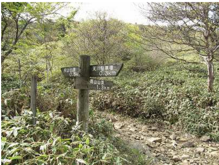
9:33 あめ山への分岐。右に山腹を巻いて岸川分岐に到り右に上るとあめ山へ到る。