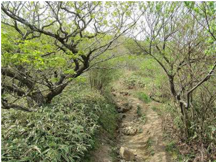
9:24 水道となる登山道を進む。