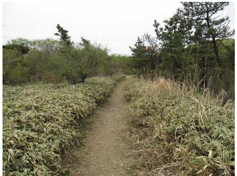
11:29 石ゴロの下りを終えると平坦となる。