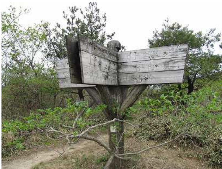
11:30 岸川分岐の大きな案内板。