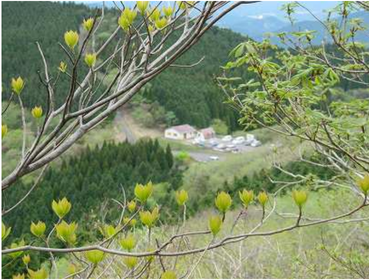
12:38 天川駐車場が見えてきた。