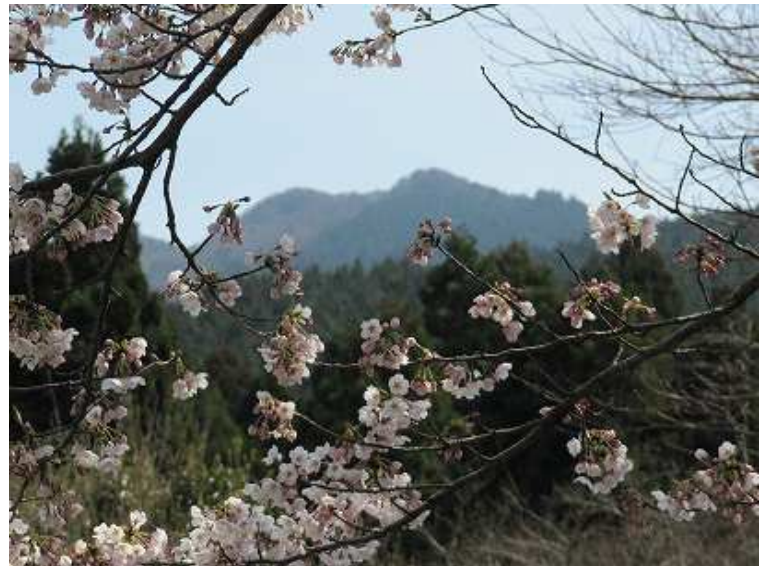
サクラ越しの尾根