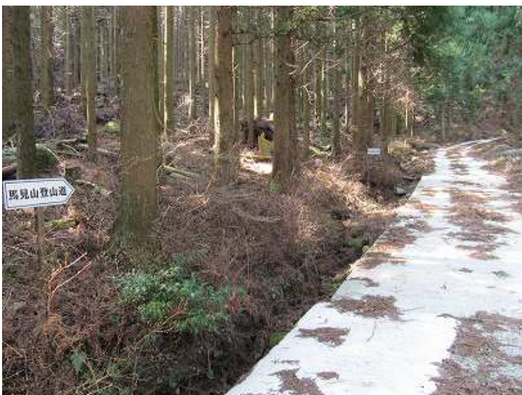
9:41 林道に出る。右へ20mほど進み左の植林帯へ。指導標あり。