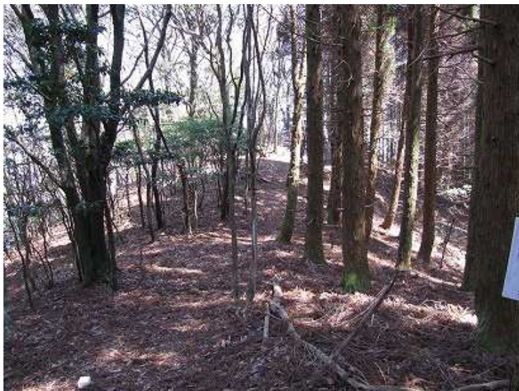
11:12 ブナ尾根分岐からブナ尾根方面。