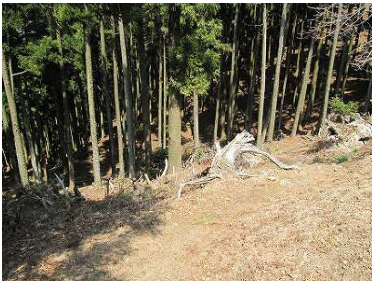
宮小路登山口への降り口