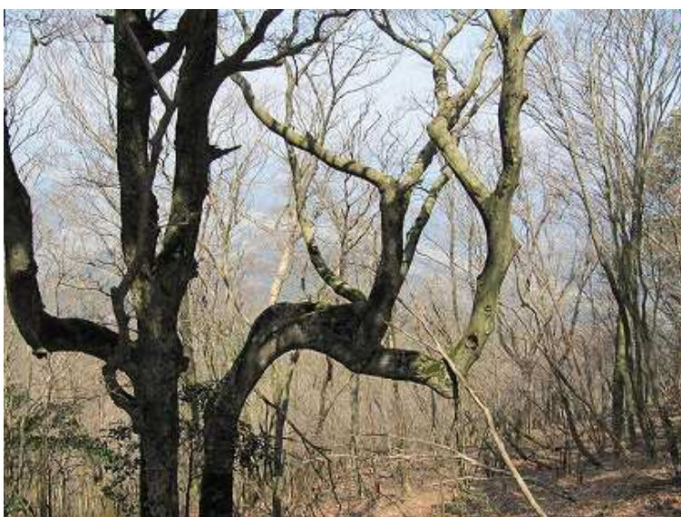
12:16 縦走路の右側にある見事な枝ぶり。