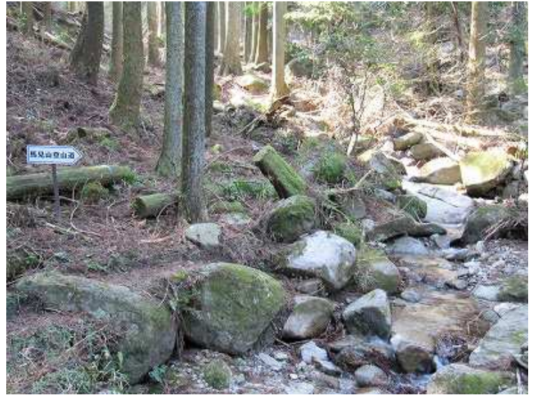
9:09 沢の右岸に沿って緩々と植林帯を進む。