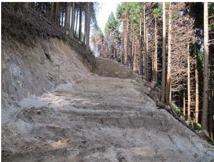
10:01 そのまま工事中の林道を辿る。