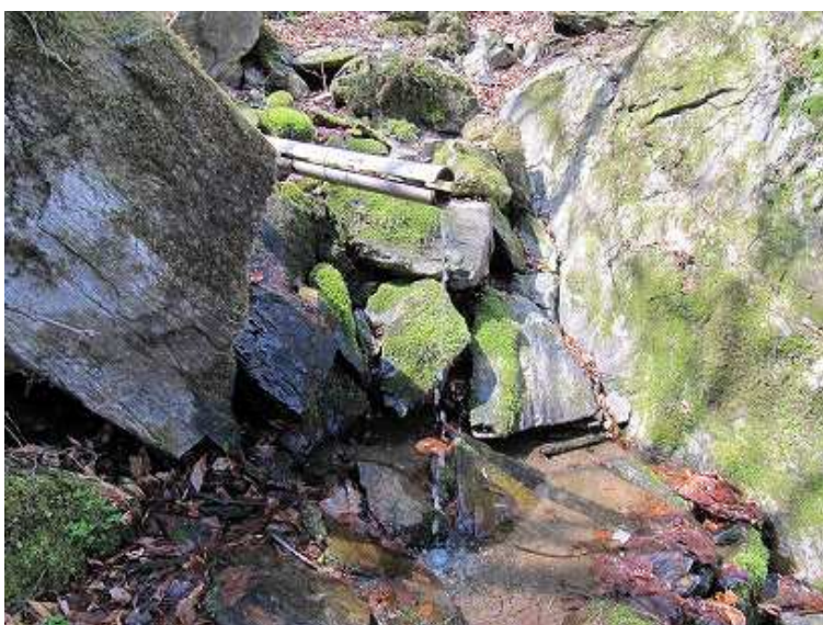
水場。冷たくて甘い。