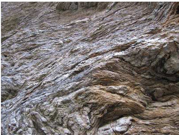
結晶片麻岩のようだ。