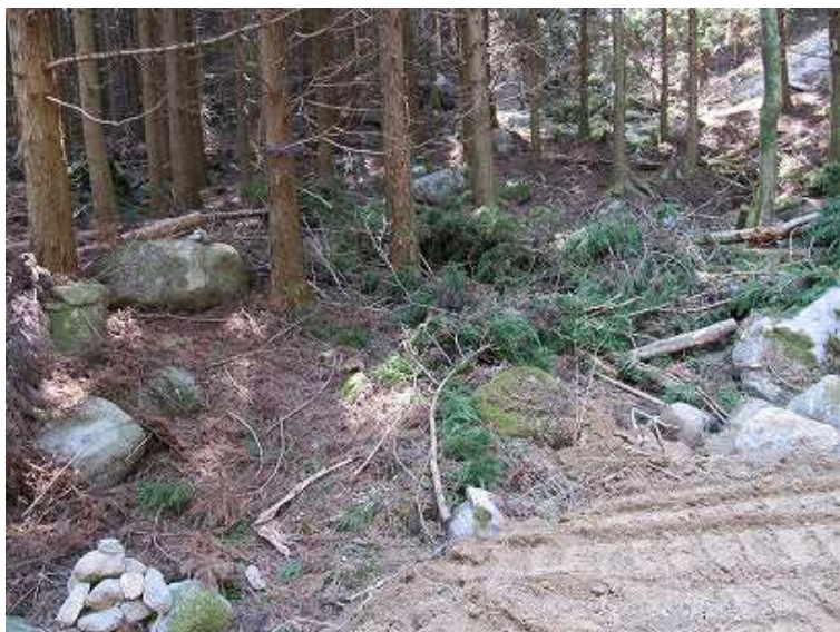
9:52 ブナ尾根分岐入口。左の植林帯を3分ほど上るが、間違いに気づき引き返した。