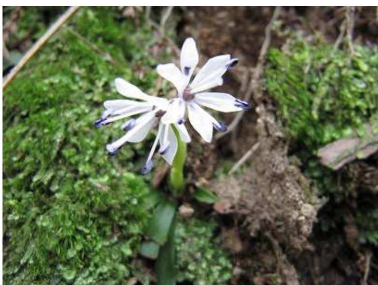
ツクシショウジョバカマ