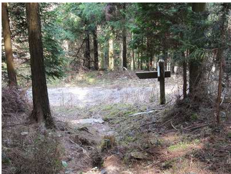
13:37 林道に出る。左へ行くと宮小路登山口。