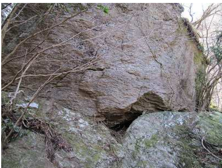
10:40 石仏大岩。中央の窟に石仏が安置してある。入口は狭い。