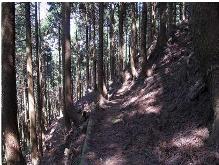
13:11 杉の植林帯の中を山腹に沿って下る。