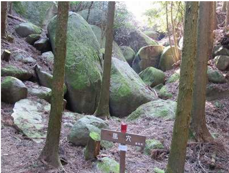
9:25 風穴到着。お尻に似た岩の間から、涼しげな沢の音が聞こえ夏は冷たい風が辺りを充たす。