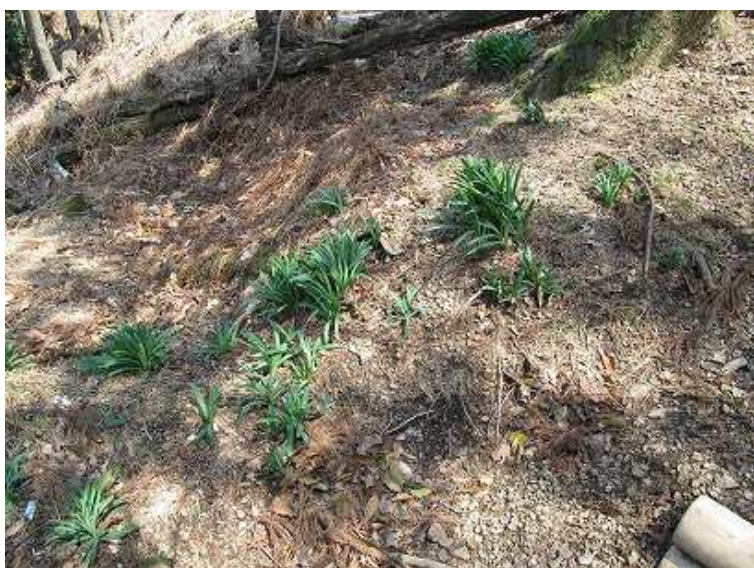
オオキツネノカミソリ