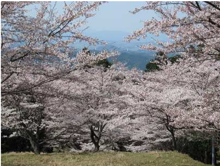
サケ孵化場のサクラ