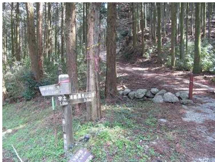
13:43 宮小路登山口。 舗装路歩きで駐車地へと戻る。