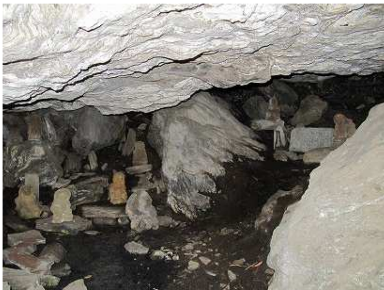
沢山の石仏が奉納安置されている。