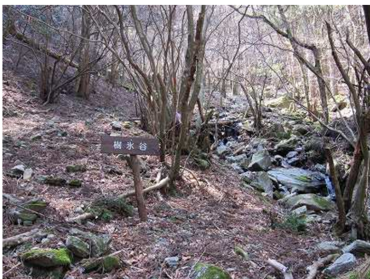
10:26 樹氷谷。冬は樹氷が見られるのか？