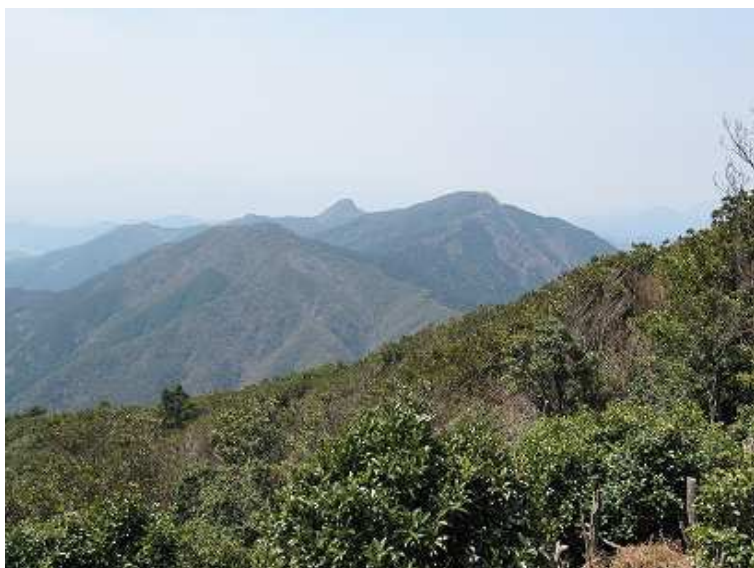
12:05 東展望所から古処山、屏山。