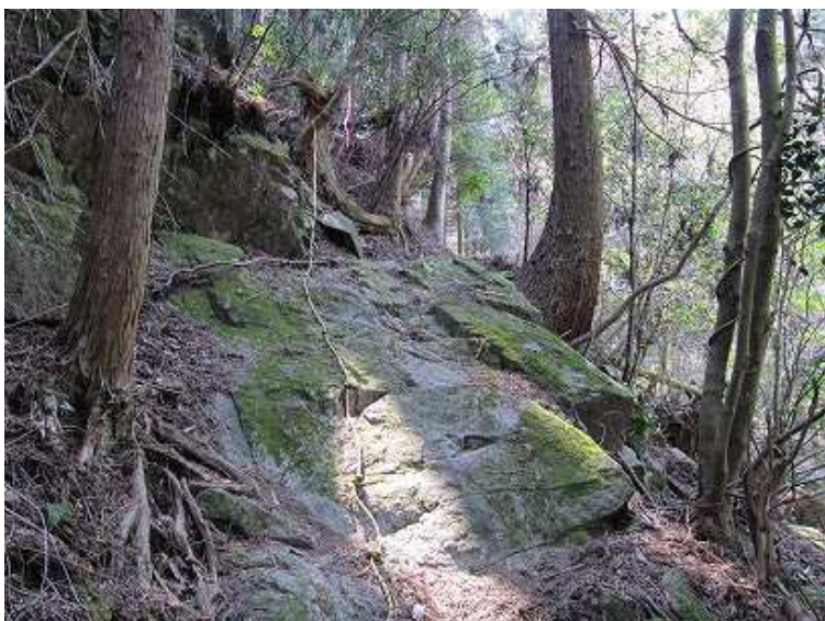
10:15 残置ロープが現れた。付近はブナやシオジの自然林となる。