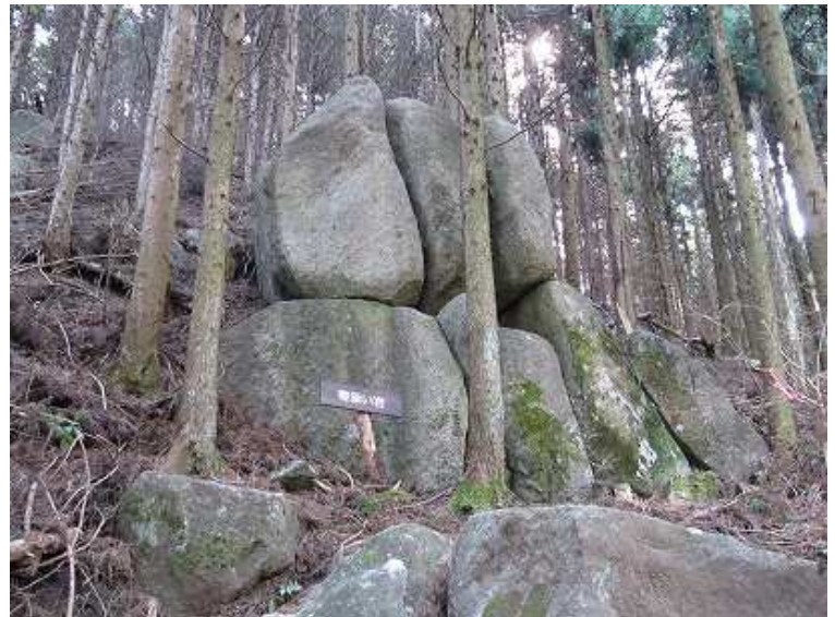
9:36 寄添い岩の側を通過する。この付近には大岩がゴロゴロしている。