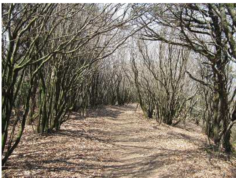
12:13 なだらかな縦走路。