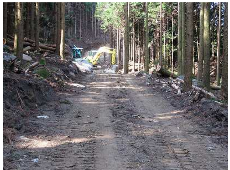
9:51 建設中の林道に出会う。現場内立ち入り禁止なのか合流部にトラロープが張られていた。