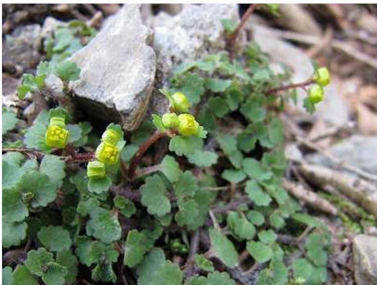
ヤマネコノメソウ