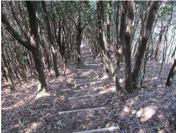
12:21 急な丸太階段を下る。