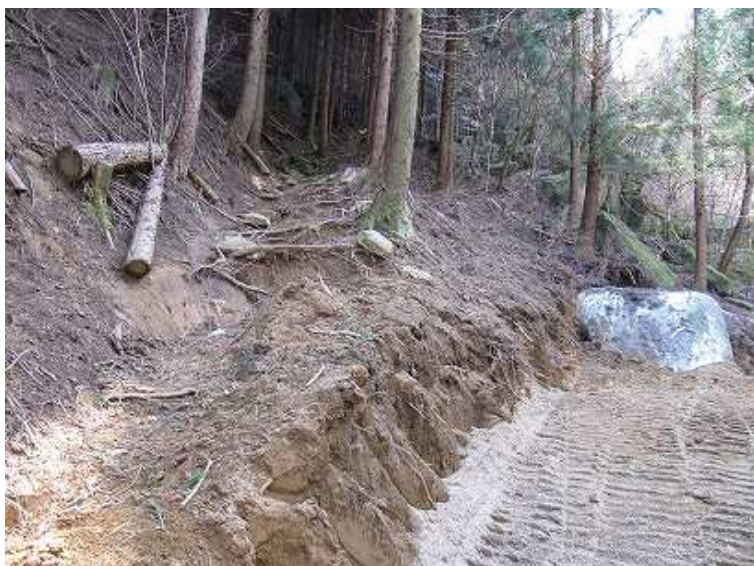
10:08 現在の工事終点。左に登山路がありこれを辿る。