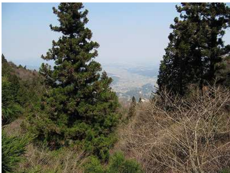
10:45 大岩の上からの展望。