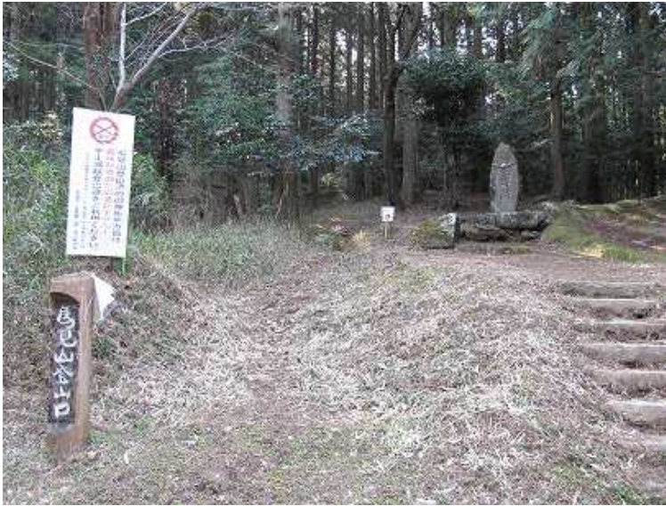
9:06 近くの空き地に車を止めて、馬見山登山口をスタートする。御神所岩方面は森林整備のためと通れませんの案内が書いてある。右奥に遥拝所の石碑が建つ。

馬見山登山口～風穴～寄添い岩～林道～プナ尾根分岐～林道終点～樹氷谷～石仏大岩～御神所岩～プナ尾根分岐～馬見山(978m)～東展望所～宇土浦越～水場～林道～宮小路登山口～駐車場