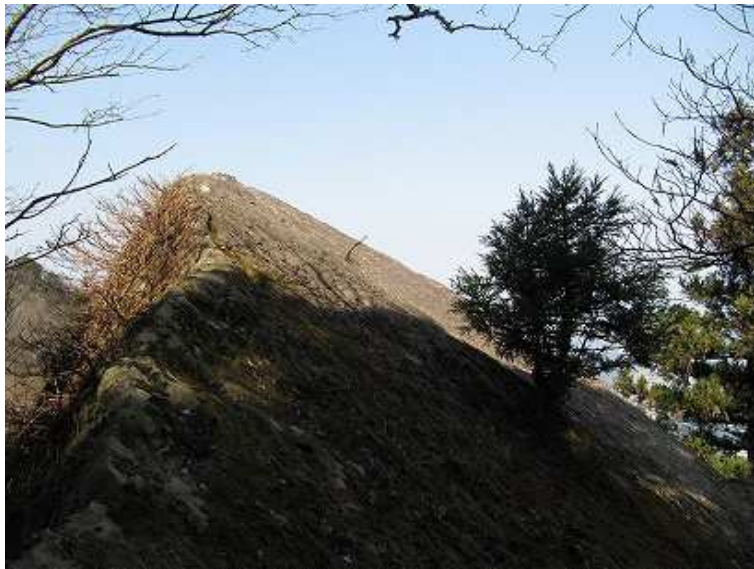
11:04 石塔の横から急な上りで三角錐の御神所岩の頭に立つ。