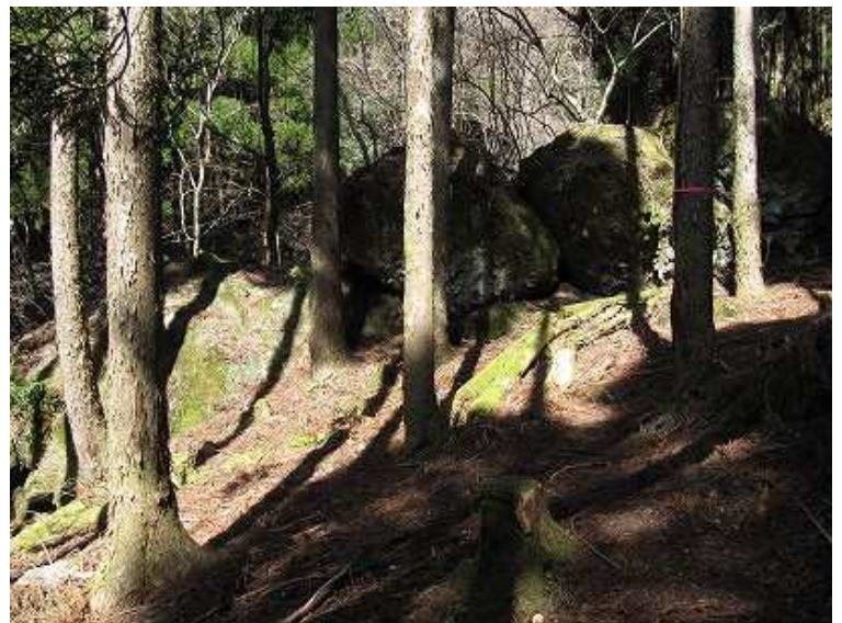
14:16 四王寺滝ルートに合流した所にある団子岩。