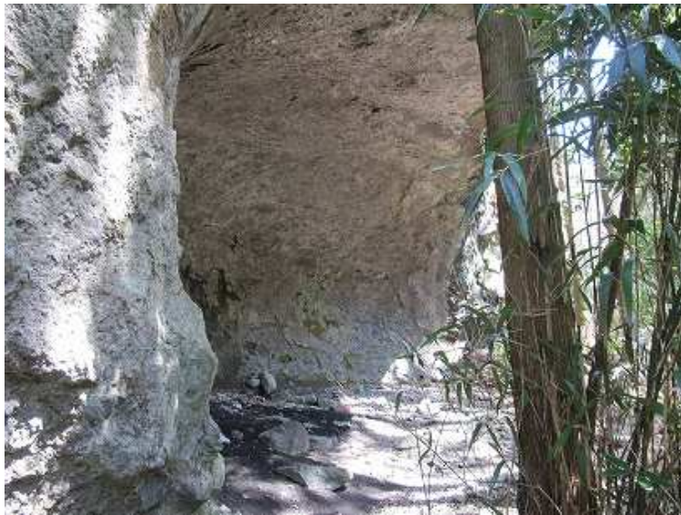
10:59 上仏来分岐から沢の左岸を数分歩くと対岸にある石窟に着く。広さは20畳以上ある。