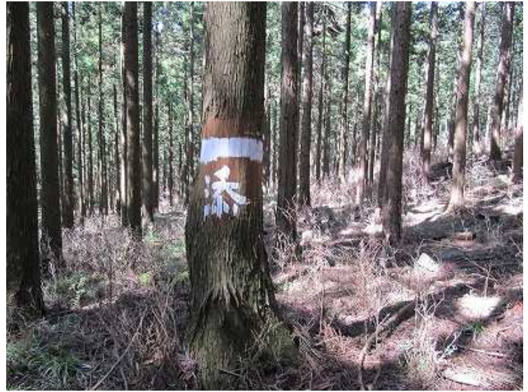
10:40 明るい杉の植林帯を抜け緩い尾根を越えて上仏来分岐へ。