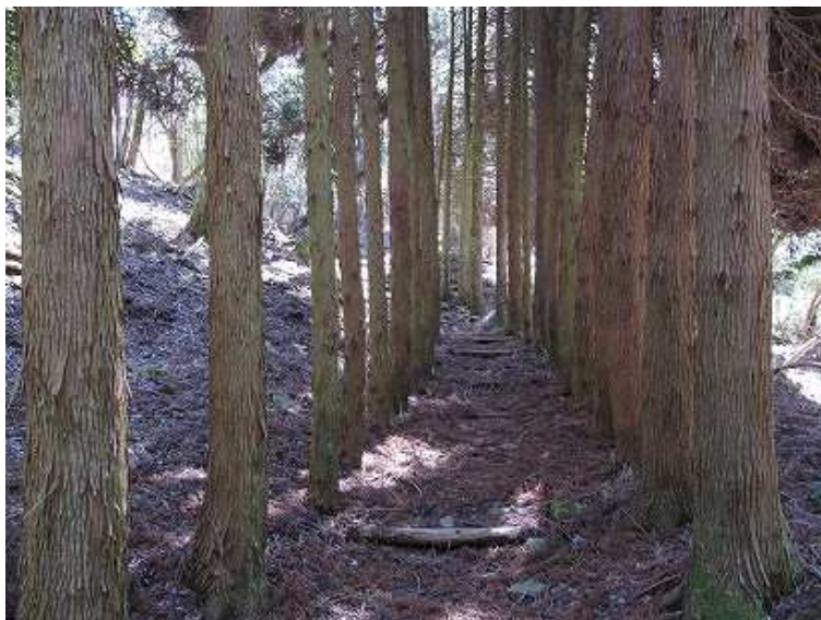
12:40 双戸尾根を抜け、杉木立の中を進むと英彦山神社歴代住職の墓地に出る。