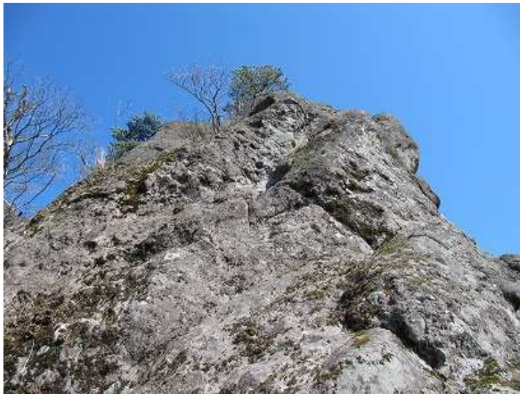
15:00 四王寺山の岩峰。登れなかった。