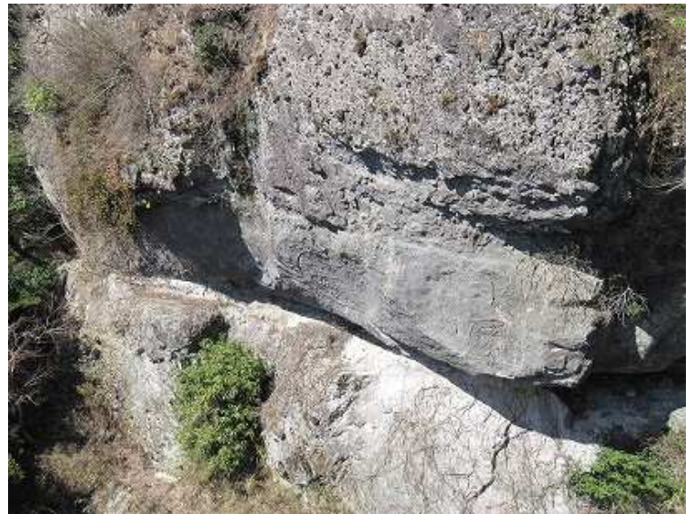
眼下に梵字岩が見える。