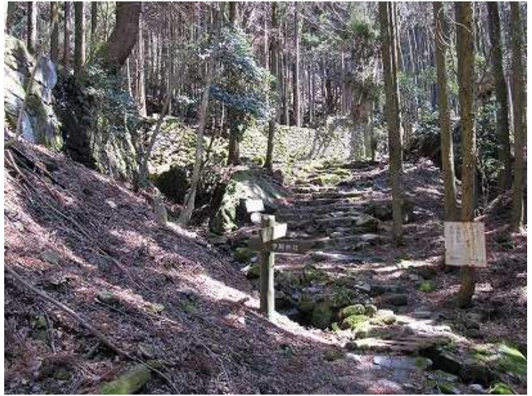
12:49 学問舎分岐を通過。