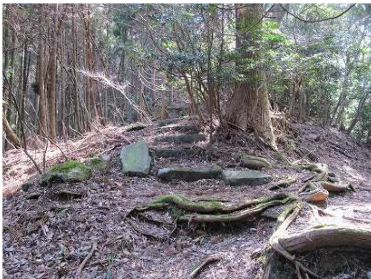
9:53 四王寺山取付き。周回してここに降りて来た。