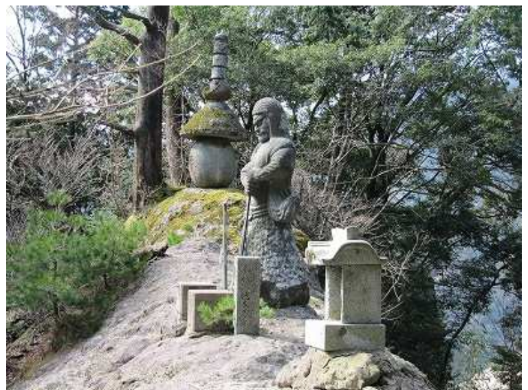
9:49 神社の広場を奥まで行きクサリに頼って岩場を登ると、痩せ尾根の上に石像が。