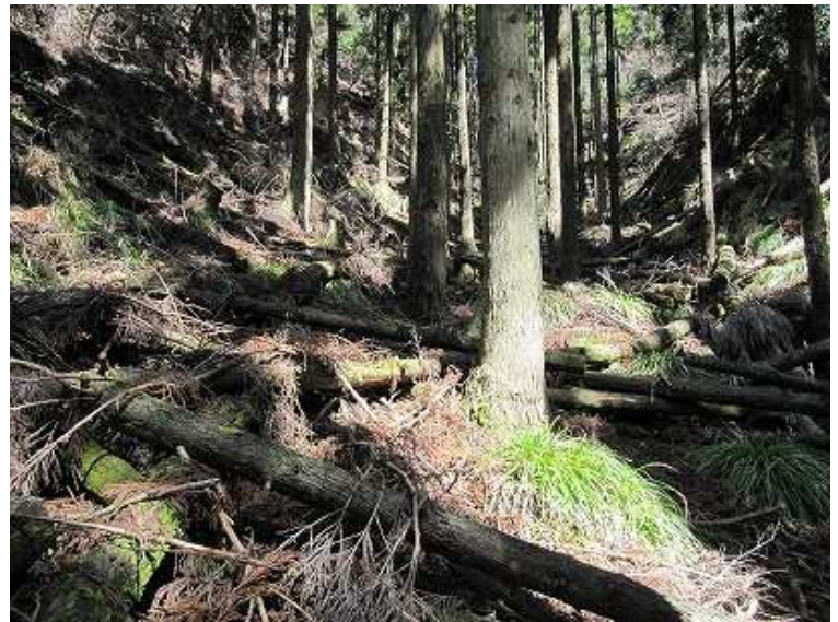
11:14 上仏来分岐に戻り、左の方の荒れ谷を伐採木を交わしながら詰める。