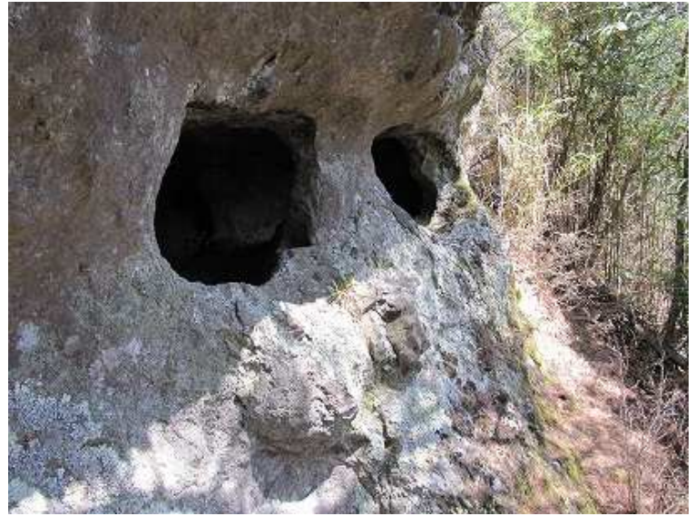
見ようによっては人面のようにも見える。 窟内には供物用の木箱があった。