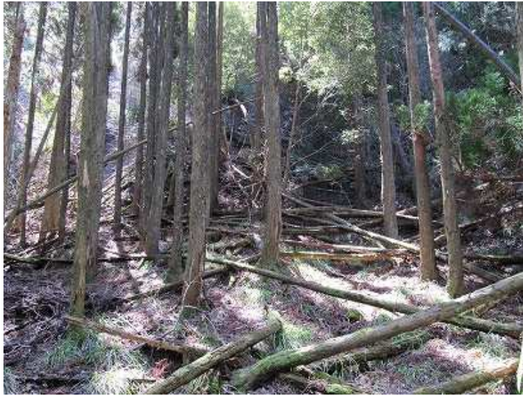
10:36 ミツマタ群落地から尾根を下り、倒木の多い沢を下る。