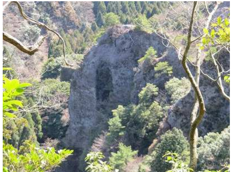
15:07 玉屋神社の真上辺りから見える南西の岸壁。パーミヤンの莫高窟のように見えるのだが？