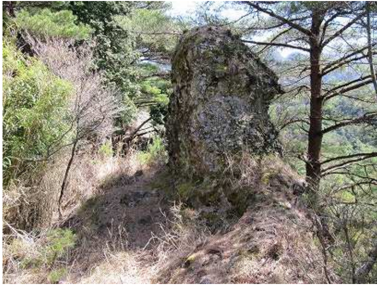
11:37 双戸窟のある尾根上の大岩。双戸窟は右に下る。