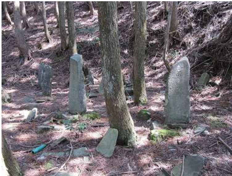
11:46 双戸窟先の左側にある第2の墓地。