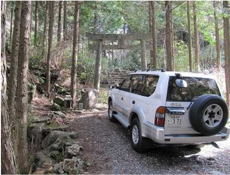
9:16 鳥居の横に車を止めて、舗装路を玉屋神社へと歩きはじめる。

鳥居～玉屋神社～泉蔵坊跡～石窟～双戸窟取付～双戸窟～虚空蔵～梵字岩～衣ヶ池～玉屋見口～P811～四王寺山～四王寺取付～玉屋神社～鳥居