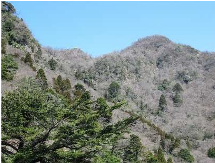
13:53 天狗ヶ鼻から中岳、南岳。