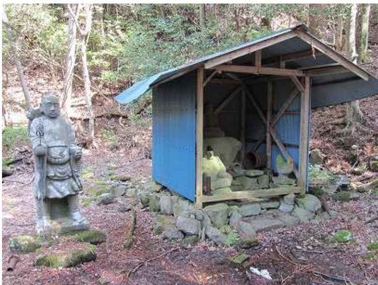
9:59 泉蔵坊跡の弘法大師像。