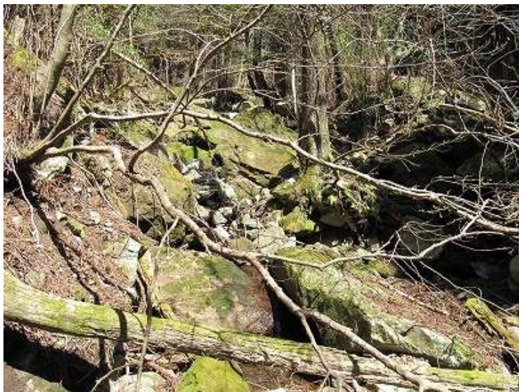
13:23 沢に出会う。右岸を下るとフェンスに囲まれた取水槽が見えてくる。