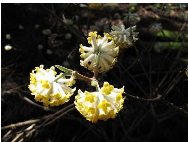
一面にミツマタが咲き乱れている。