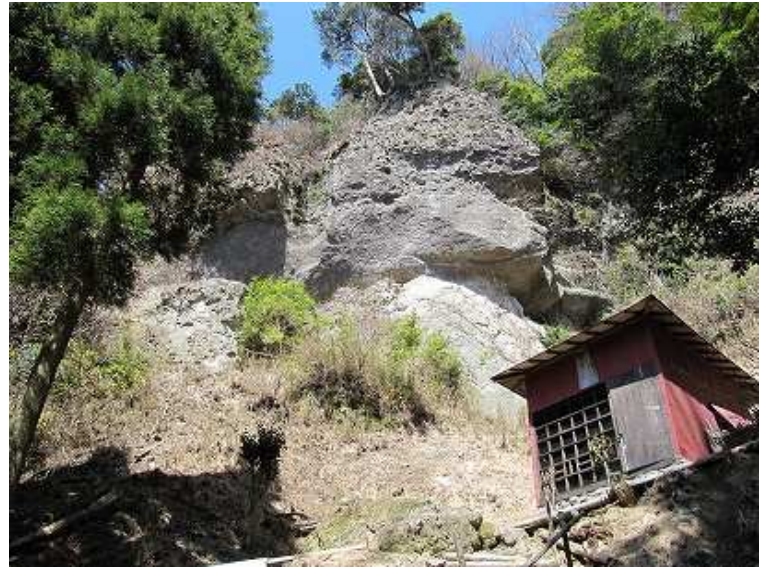
13:42 梵字岩と智宝社。世界最大の梵字で右から弥陀如来、釈迦如来、大日如来と彫られている。