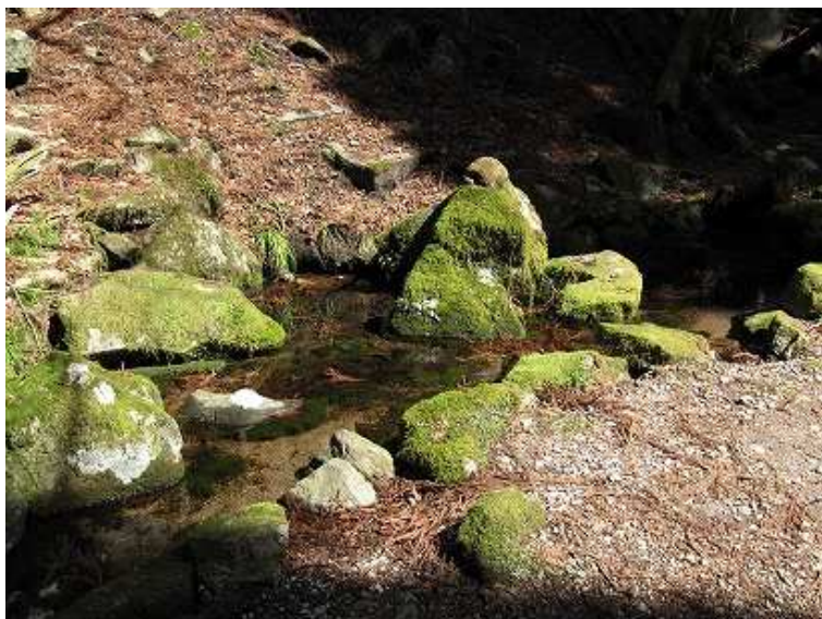
14:20 衣ヶ池。一般道を奉幣殿方面へ戻る。