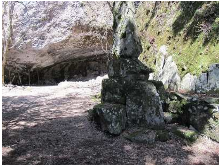
13:01 虚空蔵到着。右側の窟の右側を回り込み、山腹に沿ってトラバナー気味に踏み跡がある。これを伝う。