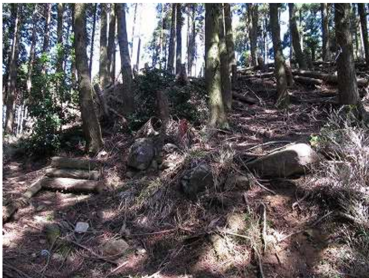
11:23 双戸窟取付。右の尾根に進む。