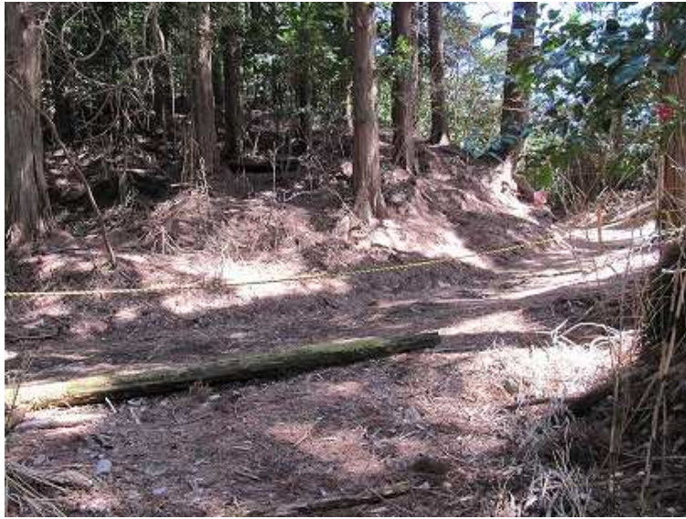
12:44 一般道に合流する。