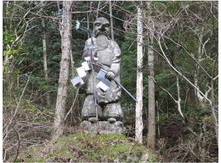
9:33 玉屋神社入口に猿田彦大神が立つ。