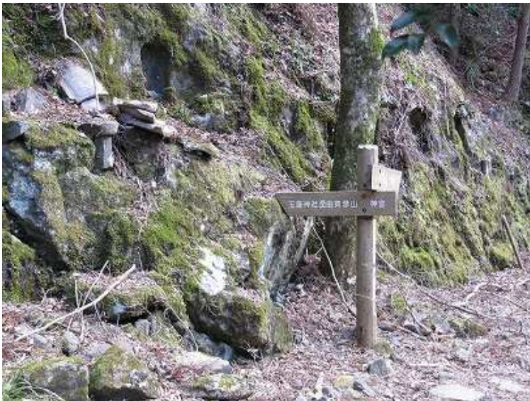
9:35 案内に従い左に石段を上ると玉屋神社である。