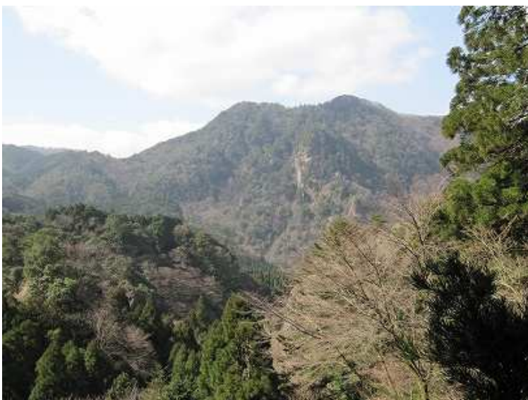
神社から障子ヶ岳を望む。