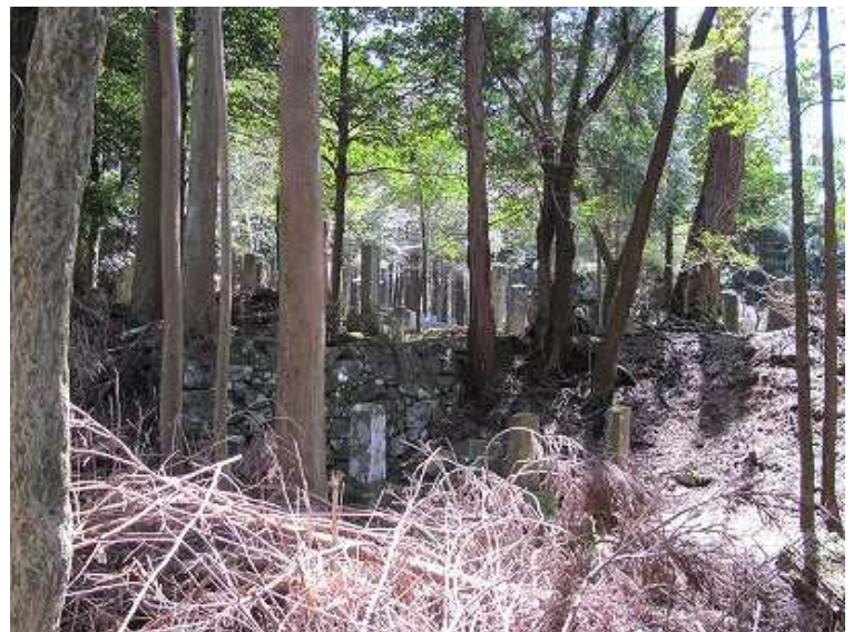
12:42 歴代住職の眠る墓地。