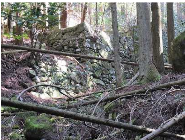
10:06 ひっそり残る見事な石垣。