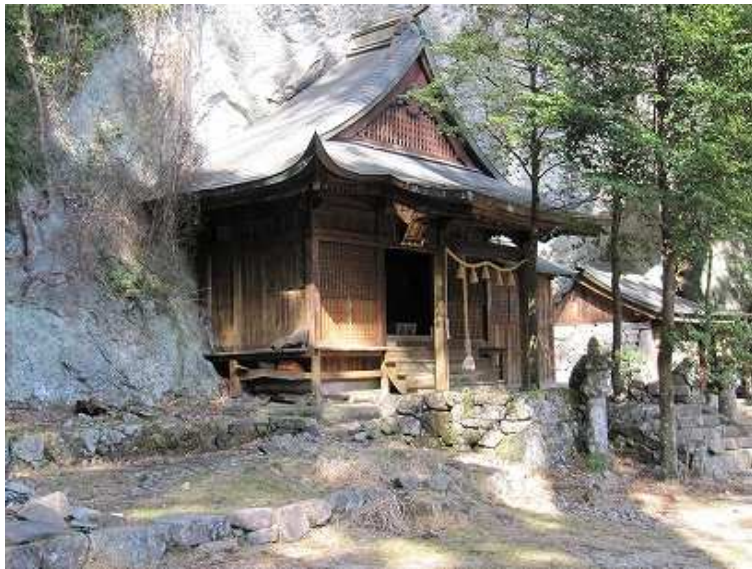
15:16 玉屋神社に戻ってきた。