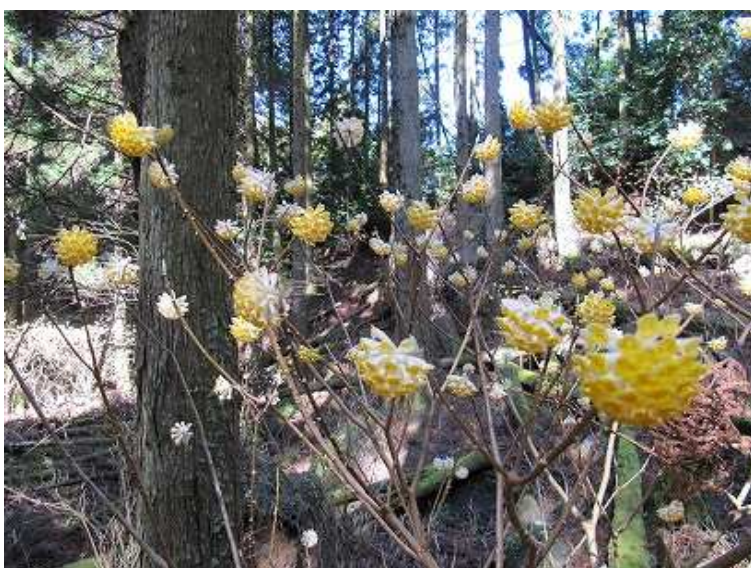
10:15 ミツマタ群落地に到着。