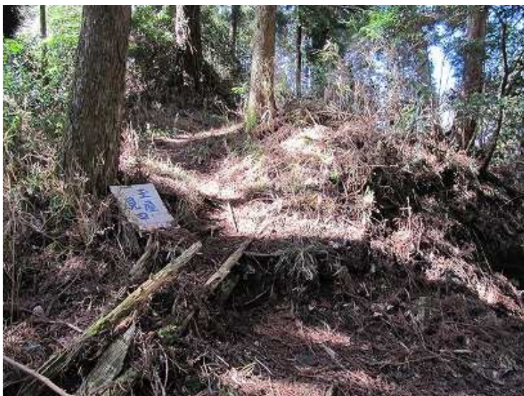
14:25 玉屋見口の入口。これより尾根をP811へ向かう。