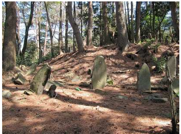
11:31 左手にある最初の墓地。