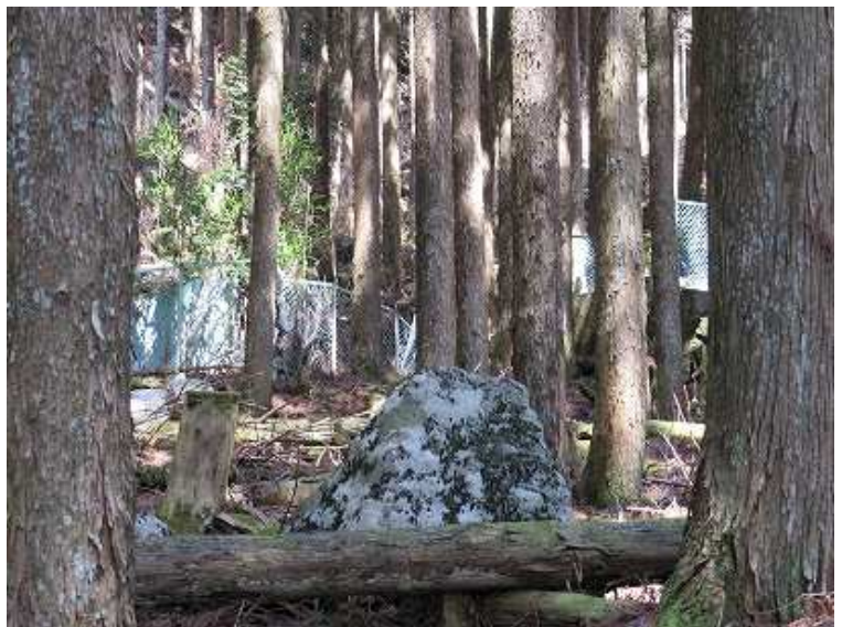
13:32 少し下ると一般道に合流する。合流点からフェンスが見える。