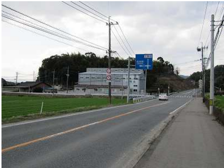
14:27 竹藪の左裏が砥上神社 直進すると立派な登山口の標識に到る。