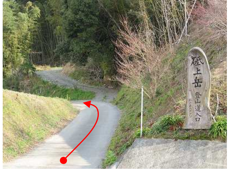
9:19 道路の対岸に立派な登山口の標識を見る。