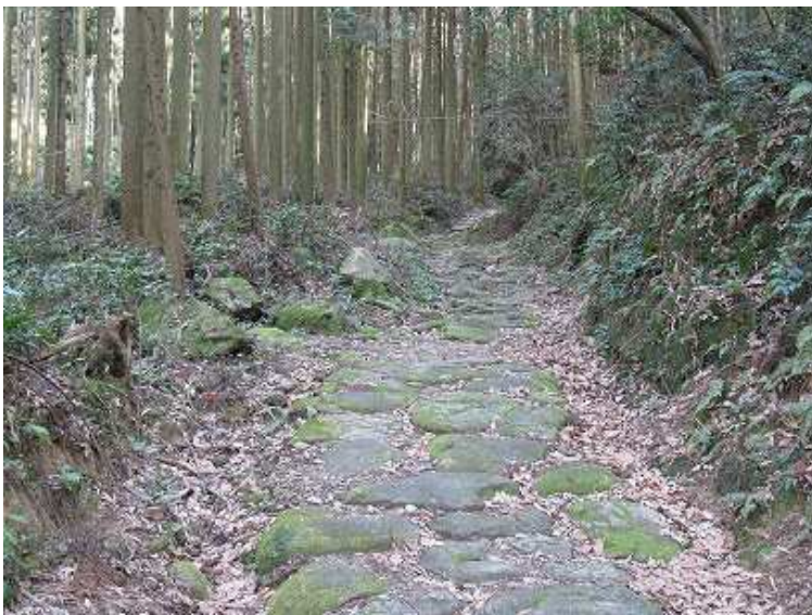
9:27 立派な石畳の道がしばらく続く。