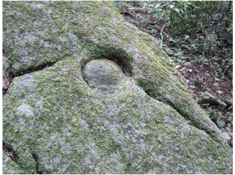
10cmほどの円形をした岩に残る蹄の跡？