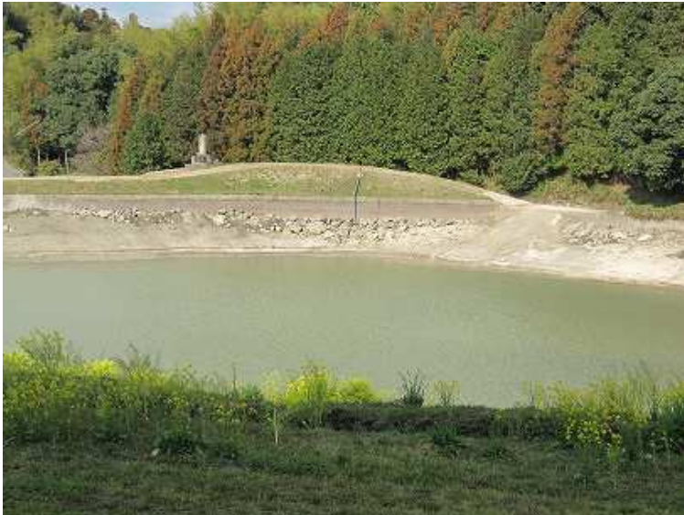
9:21 水位の減った日吉池を左に見て奥へ進む。菜の花や梅が咲いていた。