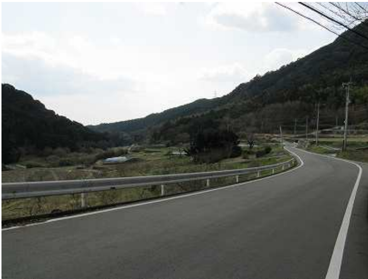
テクテクと舗装路歩き