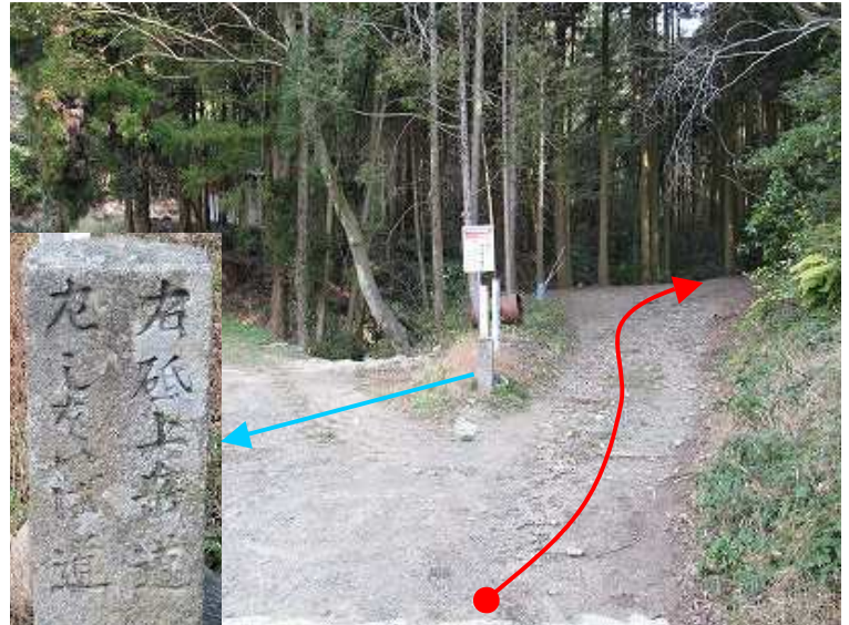
9:26 ここが登山口で右に進む。