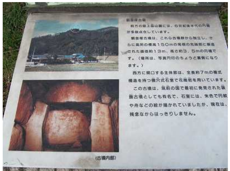
14:22 道路沿いにあった神功古道と観音塚古墳の案内板