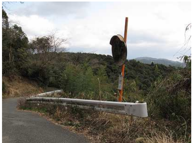
13:14 ゲートを右折して見えた風景