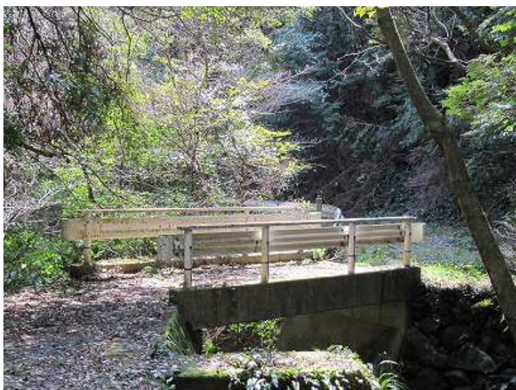
13:35 ここまで来ると一安心。