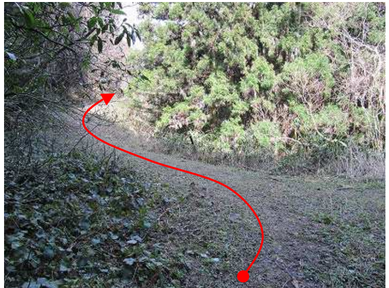
13:09 坂根登山口 右に案内板がある。左に歩くとゲートが現れる。