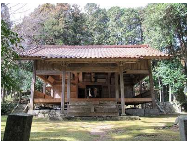
13:38 大山祇神社 天井に古い絵馬が奉納されている。