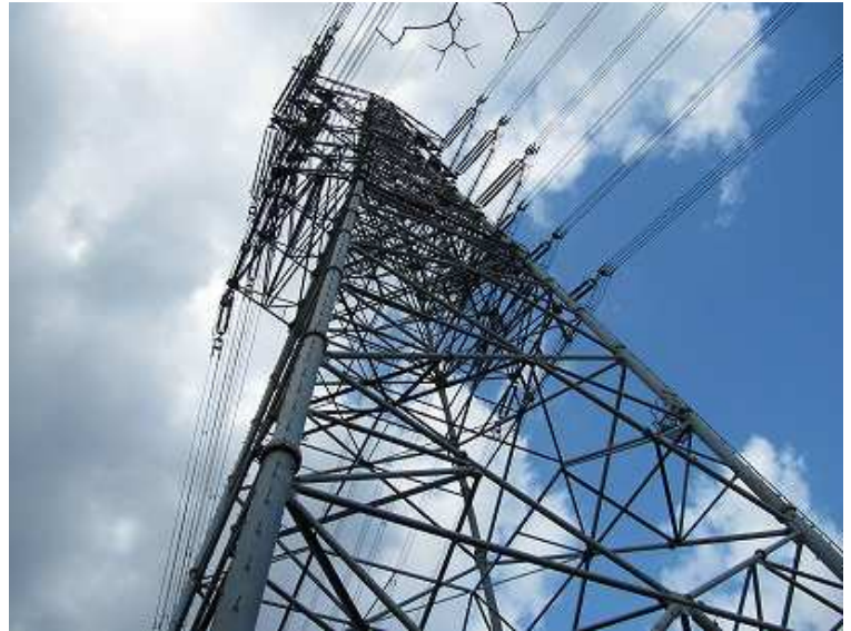
13:04 聳える鉄塔の脇を通過