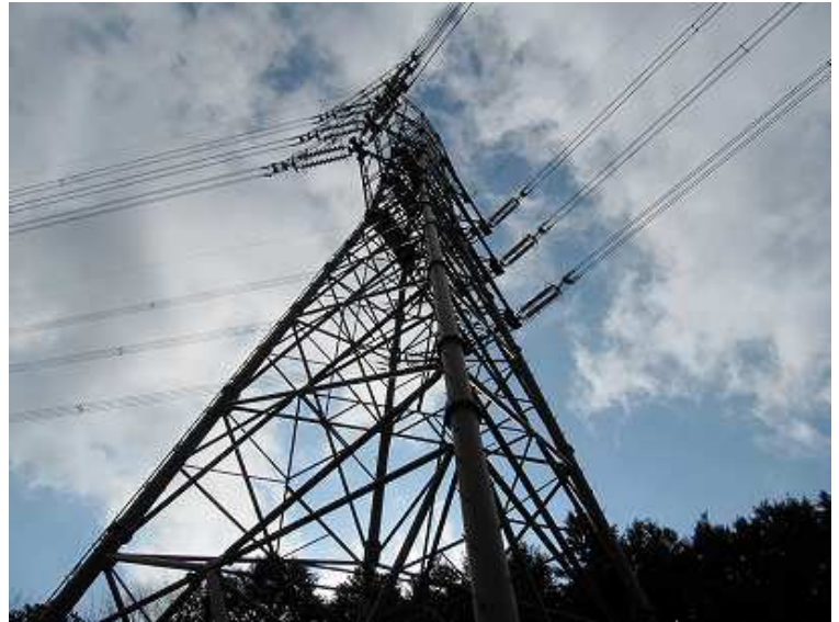
9:45 Uターン気味に上ると鉄塔が聳えている。この先直ぐに古墳。