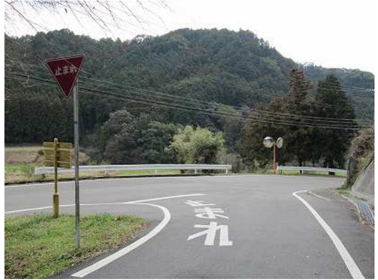
13:50 坂根集落の出口 右折して曾根田交差点を目指す