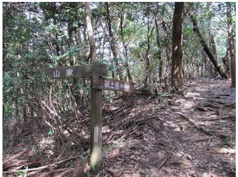
11:08 山家への分岐を見る