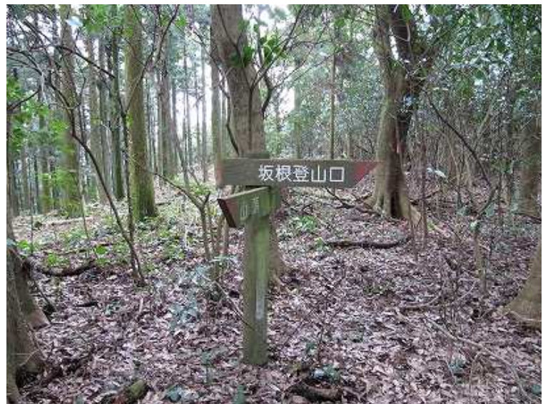
12:49 坂根登山口へと下る