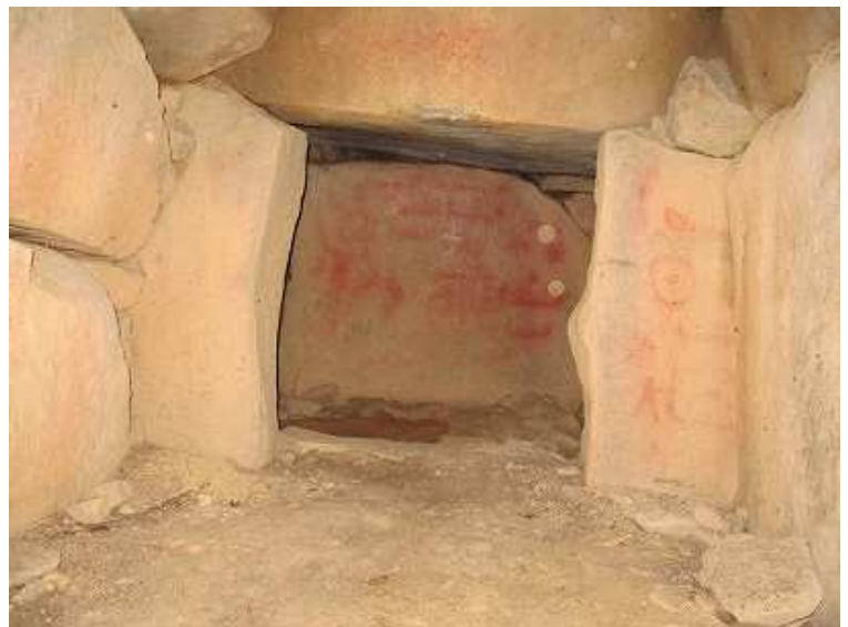
古墳内部にはベンガラで書かれた円、星、船などが読み取れる。落書きもある。