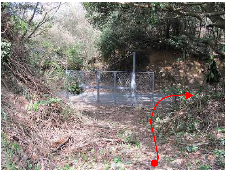
13:13 ゲートを出て右に進む。