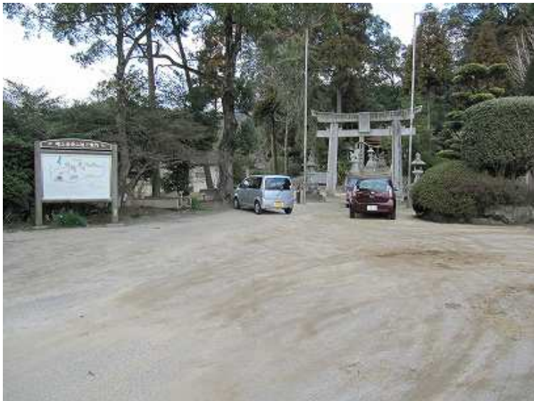
14:33 砥上神社へ帰り着いた。