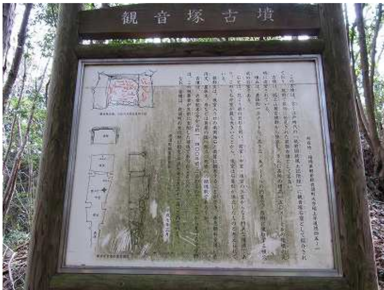
9:48 観音塚古墳の説明板