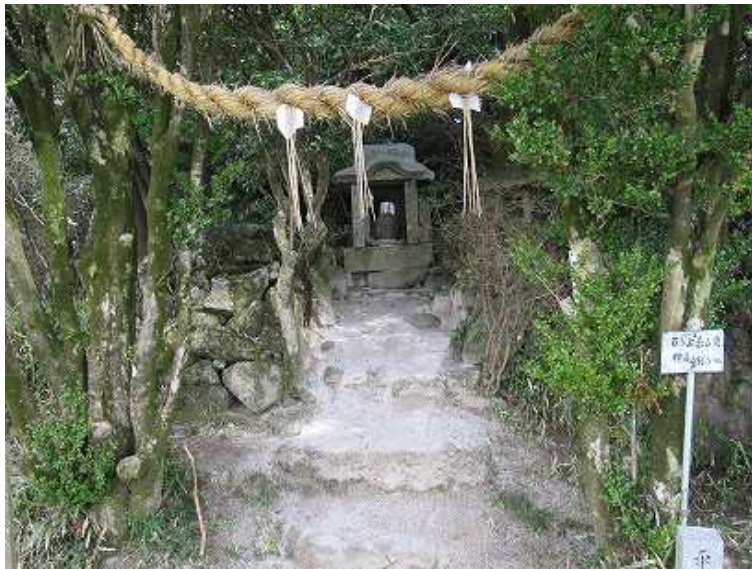
11:47 山頂の祠と武宮の由緒記