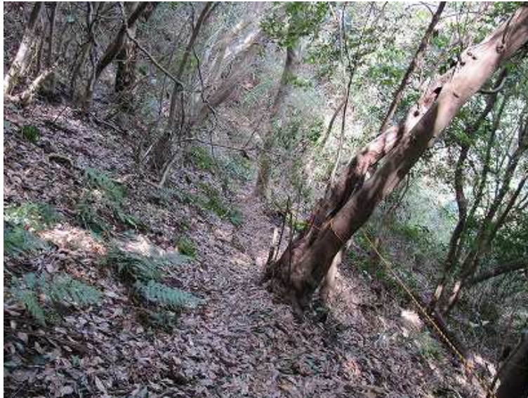
12:54 トラロープが固定されている滑りやすい斜面を下る。