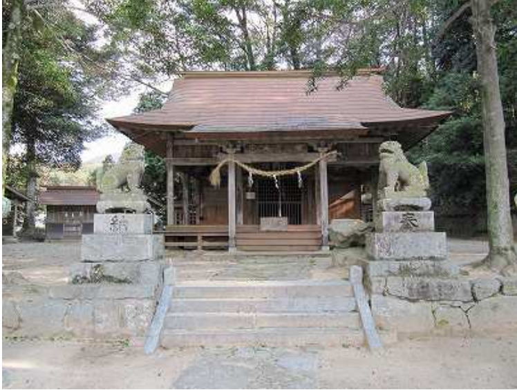
9:15 砥上神社(中津屋神社)に参拝し、左を抜けて登山口へ向けて歩き出す。手前に境内の広場があり駐車できる。登山の案内板も設置されている。

砥上神社～観音塚古墳～ひづめ石～みそぎのはる～さやん神～かぶと石～砥上岳(497m)～坂根分岐～鉄塔～坂根登山口～林道～沢道分岐～大山祇神社～曾根田交差点～砥上神社