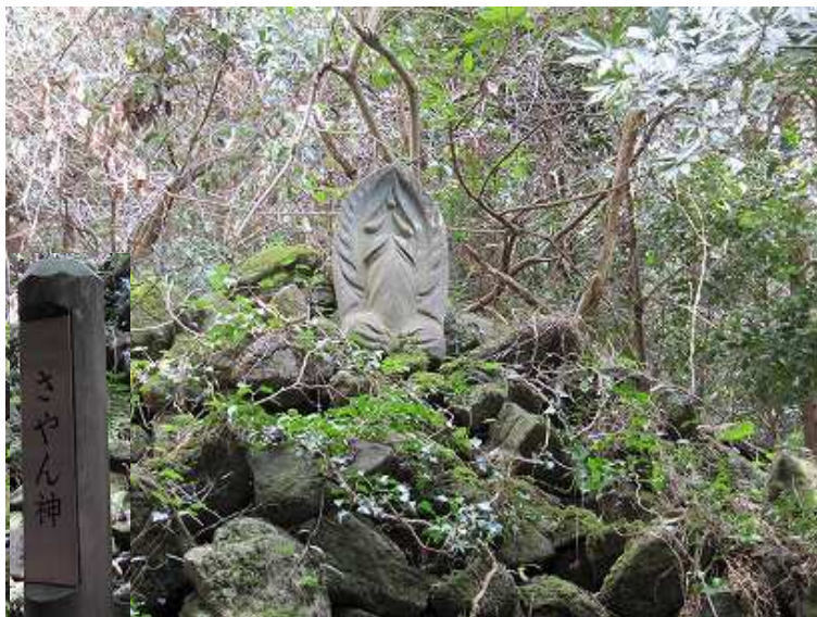
11:05 さやん神 不思議な石仏？