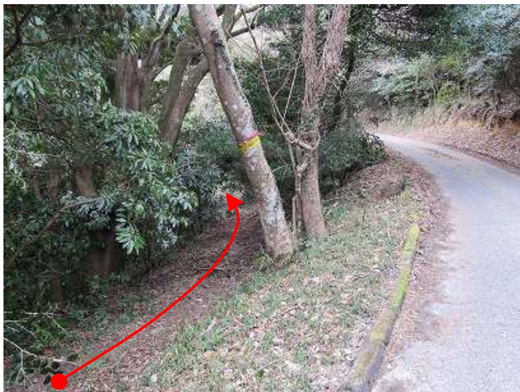
13:16 2つ目のカーブミラーの所を鋭角的に沢道に下る。