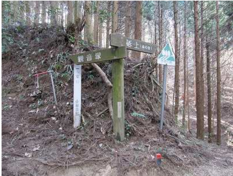
9:40 浦の谷分岐を左へ進む。