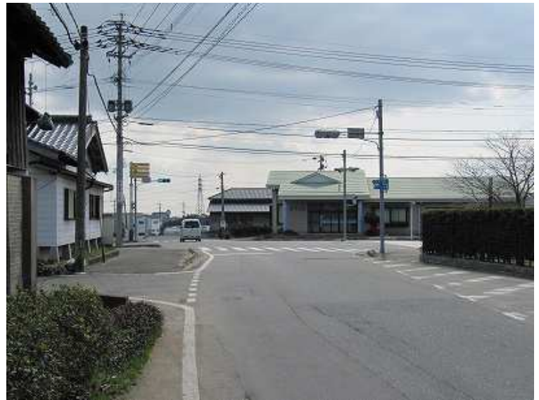
14:13 曾根田交差点 ここを右折する