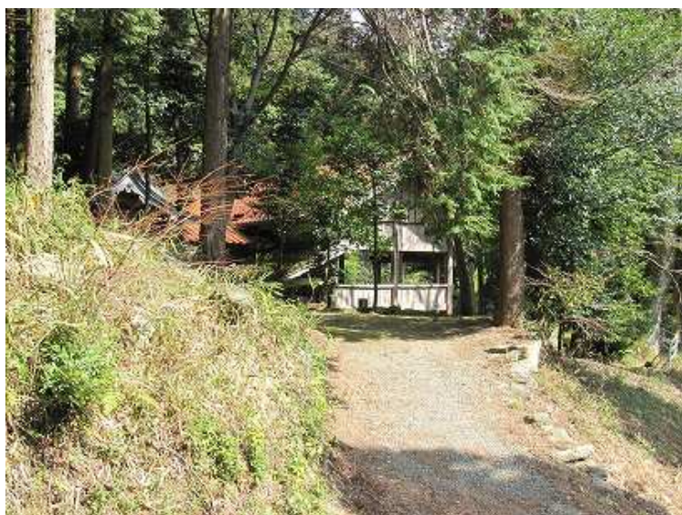
13:37 大山祇神社が左側に見えた