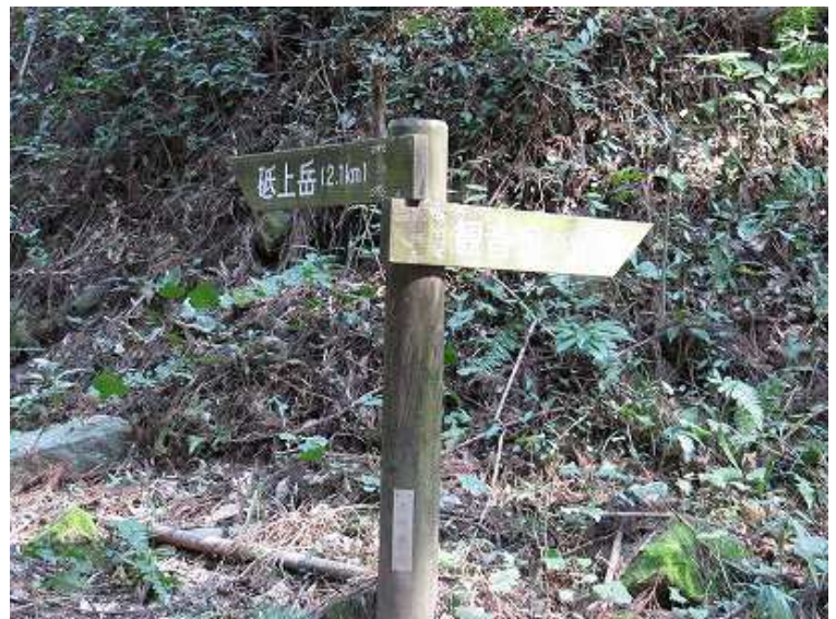
9:32 観音塚古墳への分岐 古墳へは0.5kmほど沢に沿って上る。