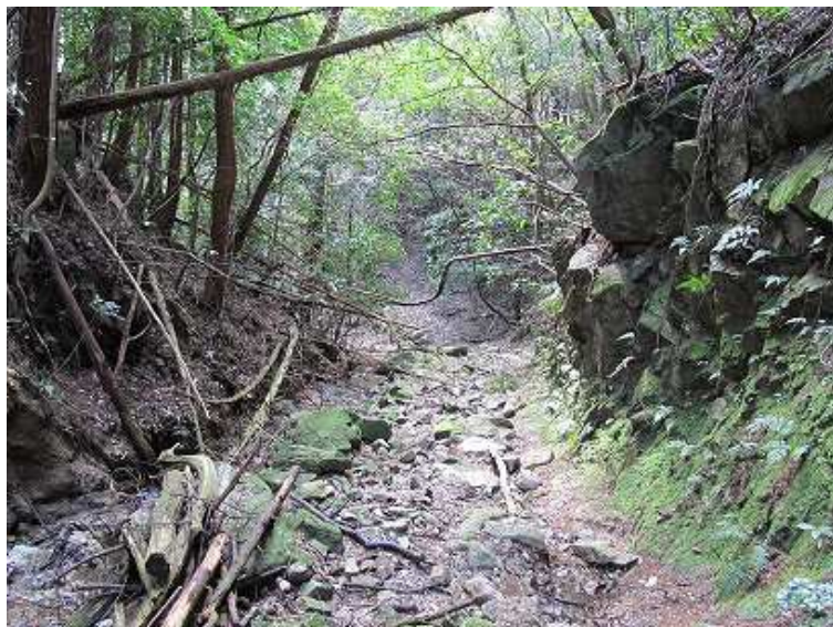
13:31 風倒木で荒れ気味の道を沢沿いに下る