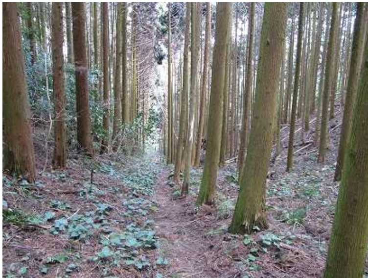
13:07 杉木立を抜けると坂根登山口