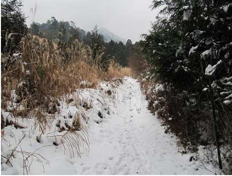
10:00 シカよけネットを潜り鬼杉へ向けて歩き出す。

鬼杉登山口～鬼杉～大南神社～鬼杉分岐～三呼峠～衣ヶ池～四王寺滝～展望尾根～縦走路～南岳(1200m)～材木岩～鬼杉～鬼杉登山口