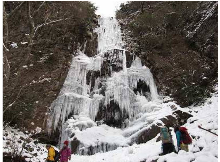
11:39 幻の滝(四王寺滝)へ到着 衣ヶ池から明瞭なトレースが付けられ幻ではなくなった。 右の尾根に取付き、悪戦苦闘して南岳に到る。