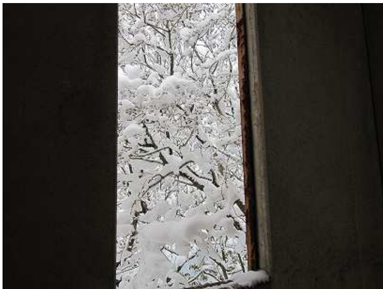
14:27 展望台から外の雪景色