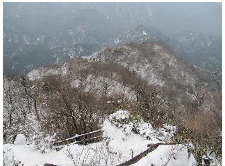
14:42 クサリ場から展望地を望む