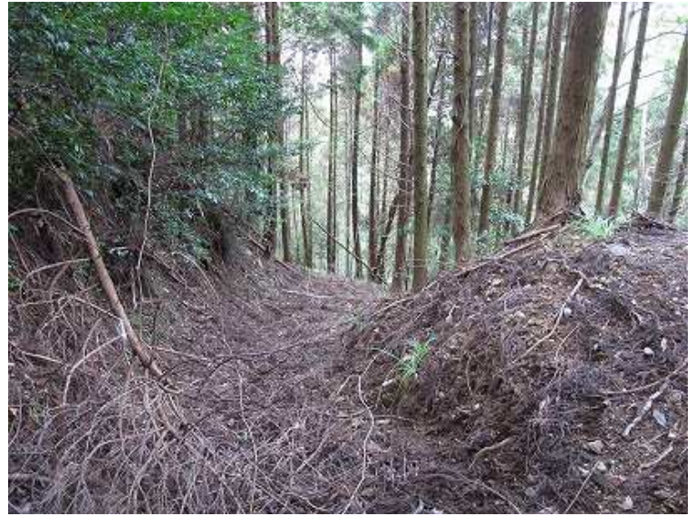
14:03 迷路を突破したら左よりの古道に合流した