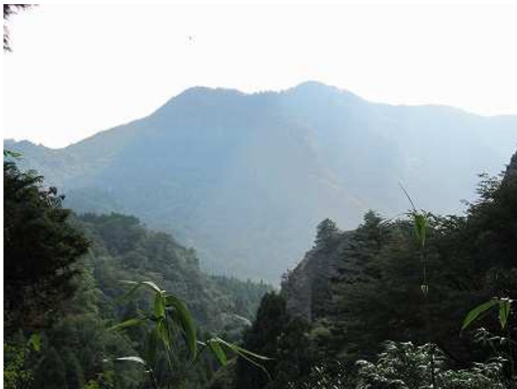
正面に黒岩山と障子岳