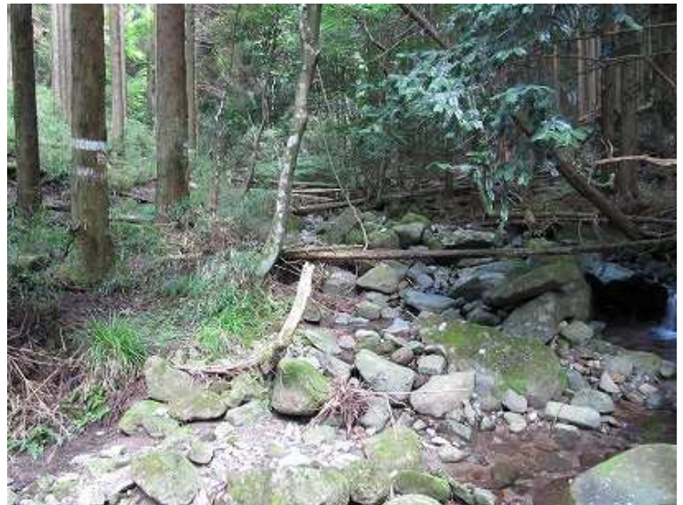
9:12 上仏来分岐の沢 上仏来取付は左方向へ、右岸沿いに上流へ遡ると大河辺窟へ 左岸を沢沿いに進めば一般路へ合流する。