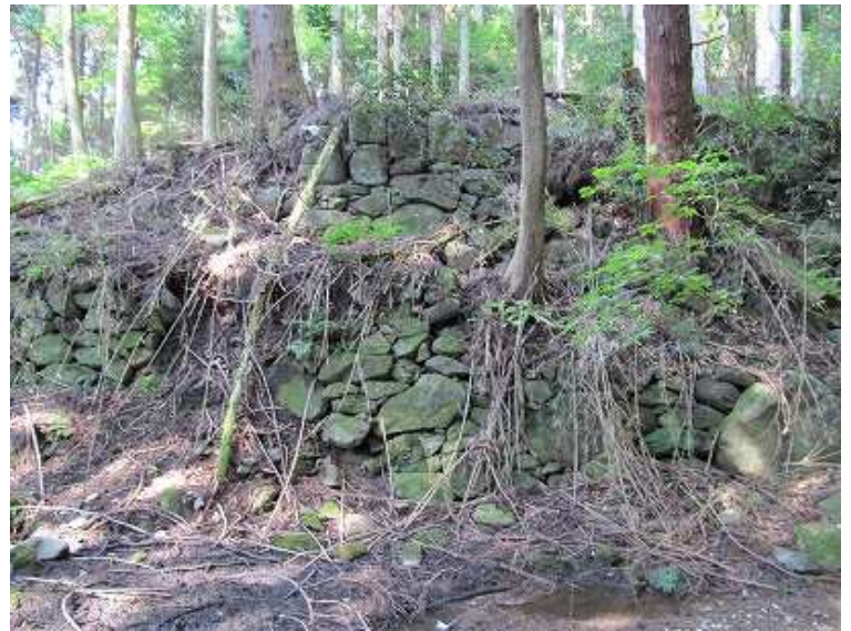
14:10 一帯は僧坊跡であろうか。段々畑状に石垣が残る