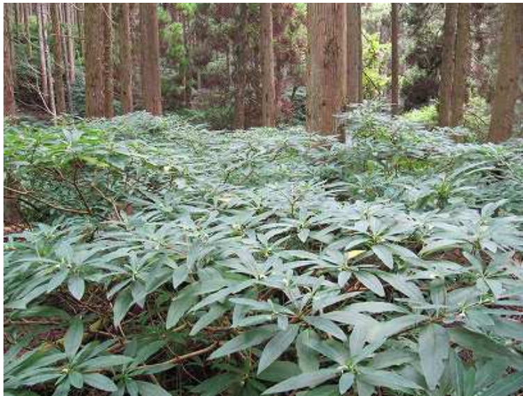
14:06 ミツマタの群落地