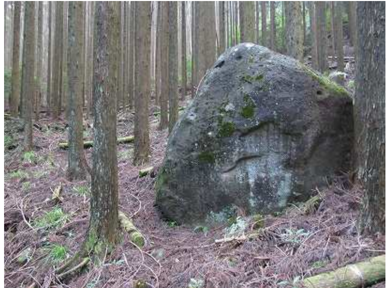
9:03 林道終点から智宝川左岸沿いの植林帯を行くと現れた岩