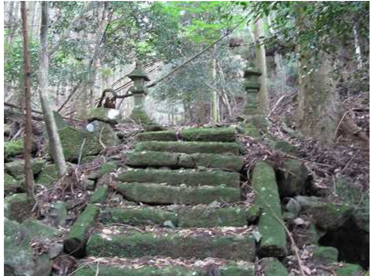
14:35 石段を上って、その先で一般道と合流