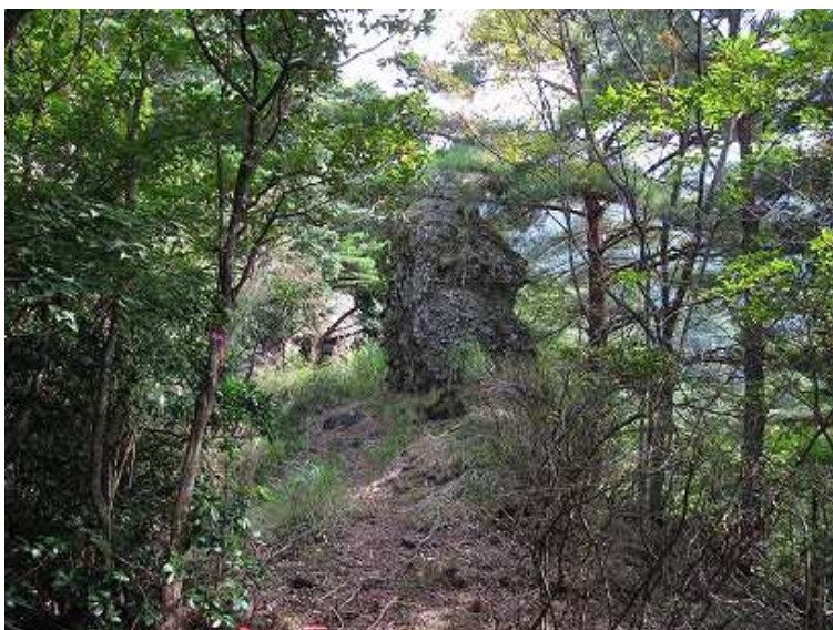
10:59 男岩 この下に双戸窟があるが見ていない。