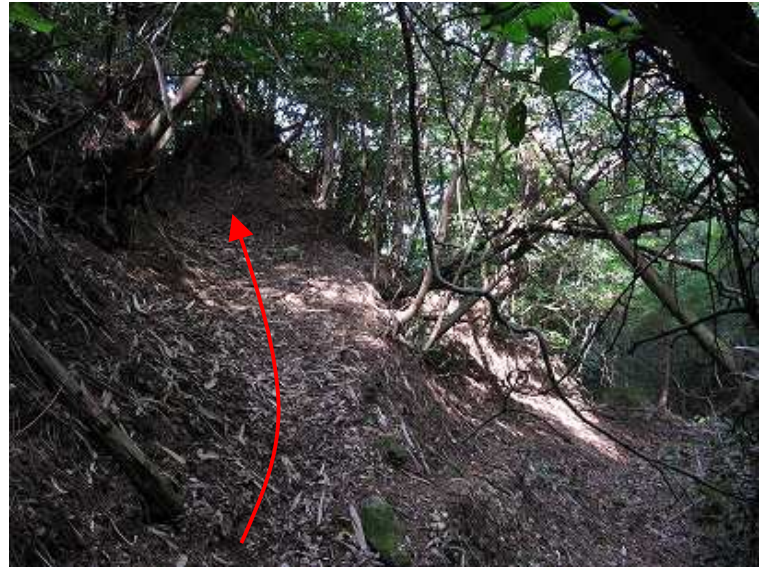
11:35 上仏来取付 左上に上る。右下は花電車駅へ