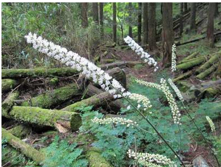
サラシナショウマ