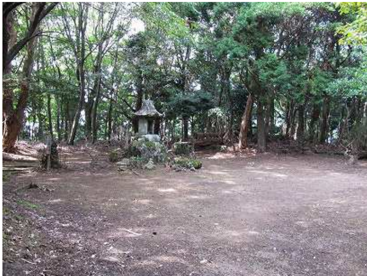
11:53 上仏来山(685m) 山城跡ということで山頂は平坦。展望はない。