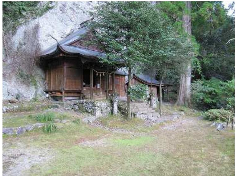
14:48 玉屋神社へ着いた