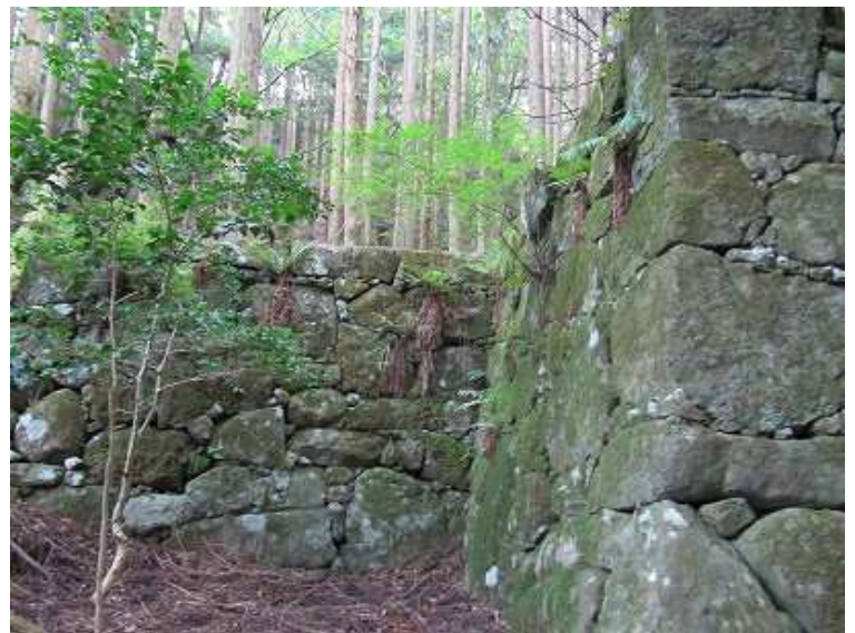
14:26 見事な石垣が残る