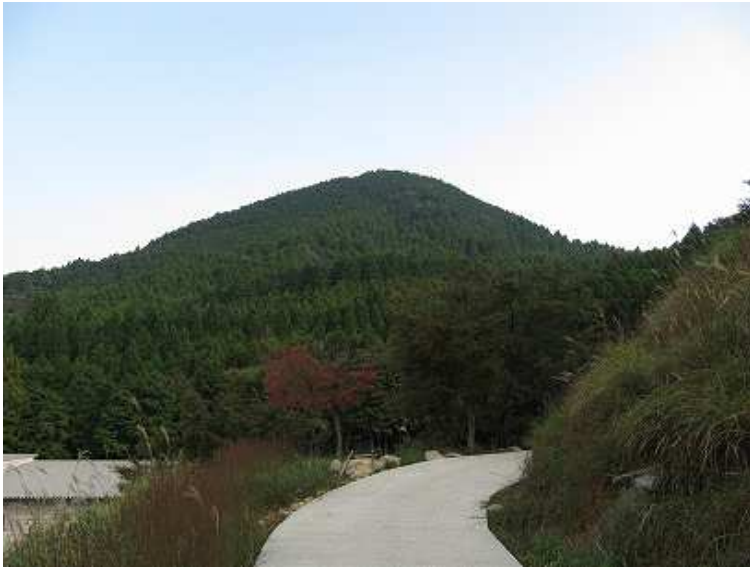
8:50 前方に上仏来山が見えた