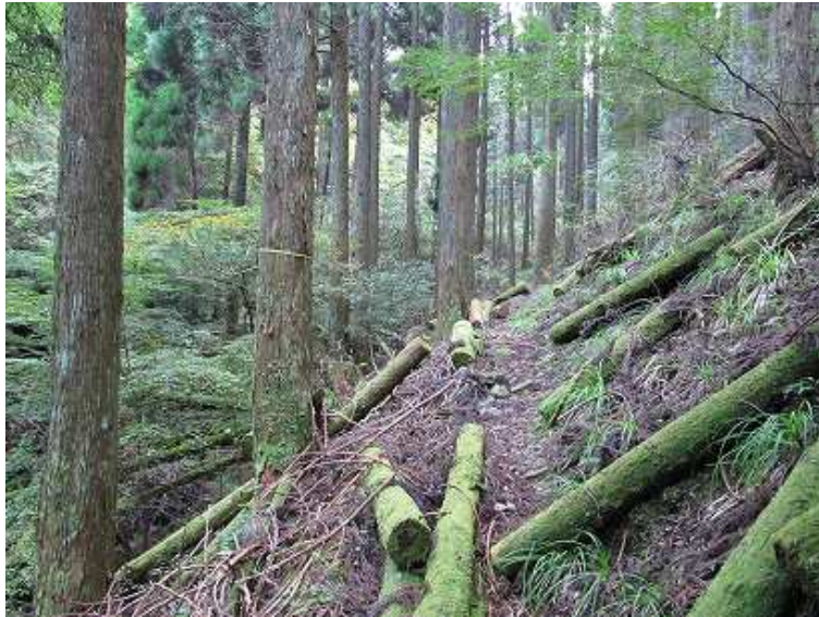
9:29 間伐材が放置されている