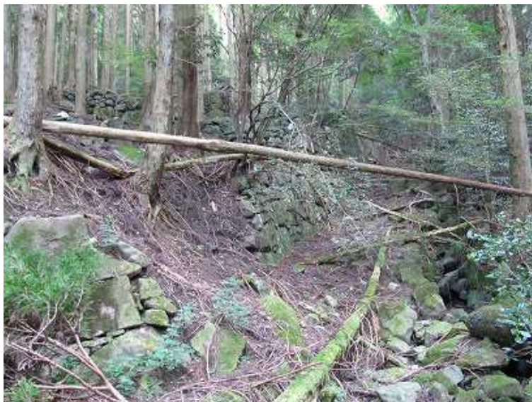
14:23 左手に僧坊跡、石段の古道が続く