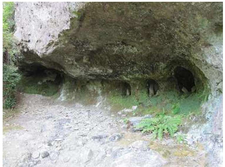
左側の窟に立つ石仏