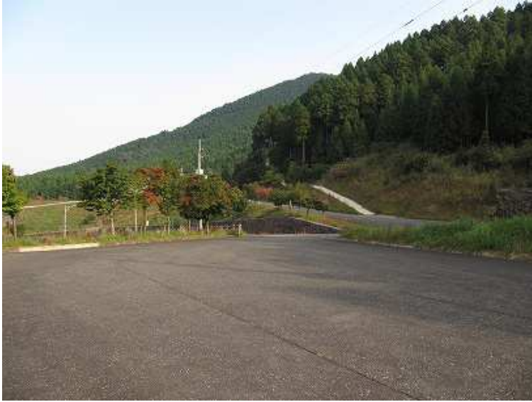
8:47 福太郎下の駐車場から歩きはじめる

駐車場～駐車場分岐～福太郎分岐～学問舎～双戸尾根～上仏来山(685m)～上仏来分岐～泉蔵坊跡～玉屋神社～鳥居～駐車場