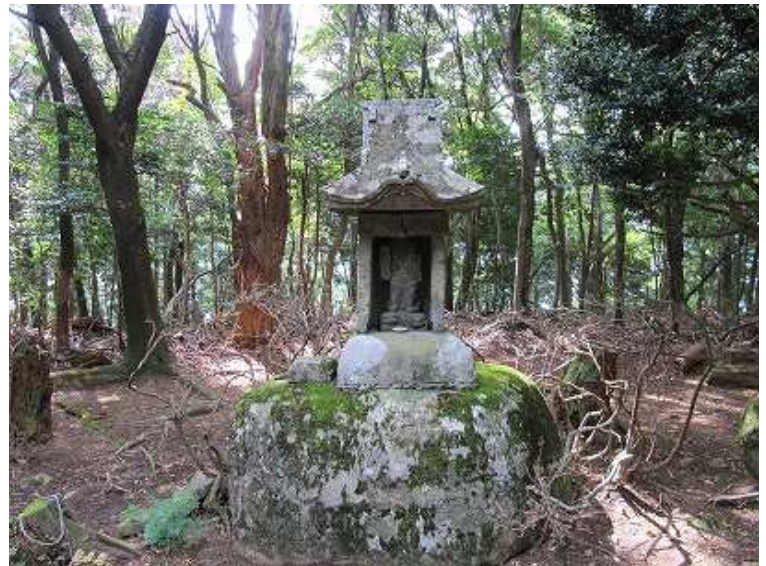
毘沙門天が祀られている