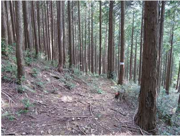
13:32 泉蔵坊跡への古道