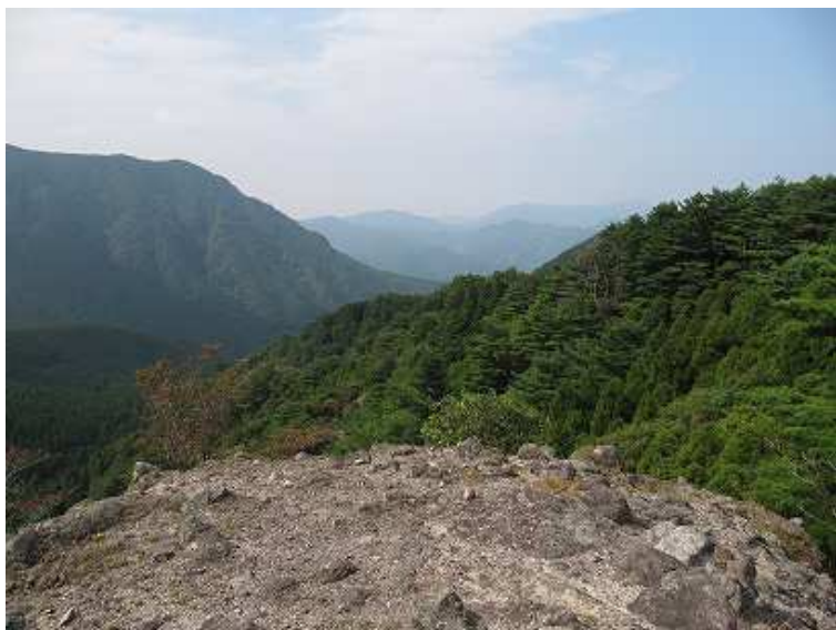
10:49 尾根からしゃくなげ荘方面