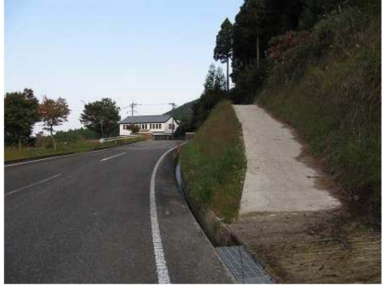
8:48 奥の建物が福太郎株式会社 右のコンクリート林道を上る