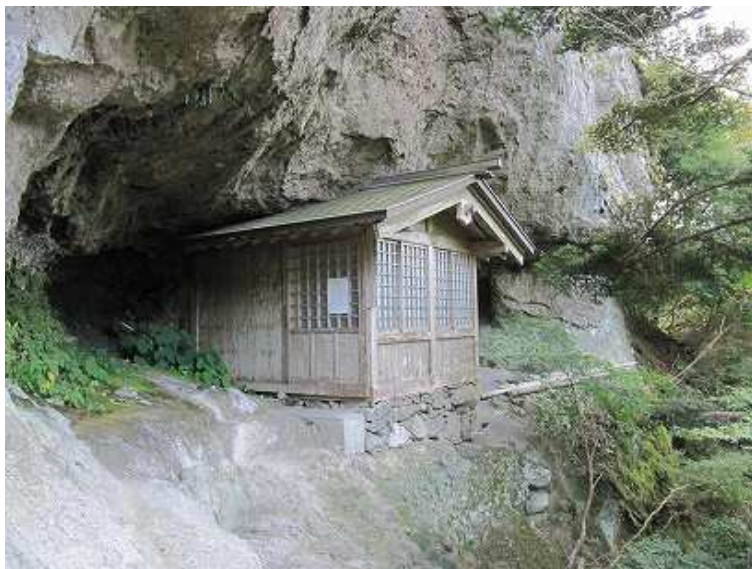
10:21 学問舎 文殊菩薩を祀る。広さ4畳半程度。