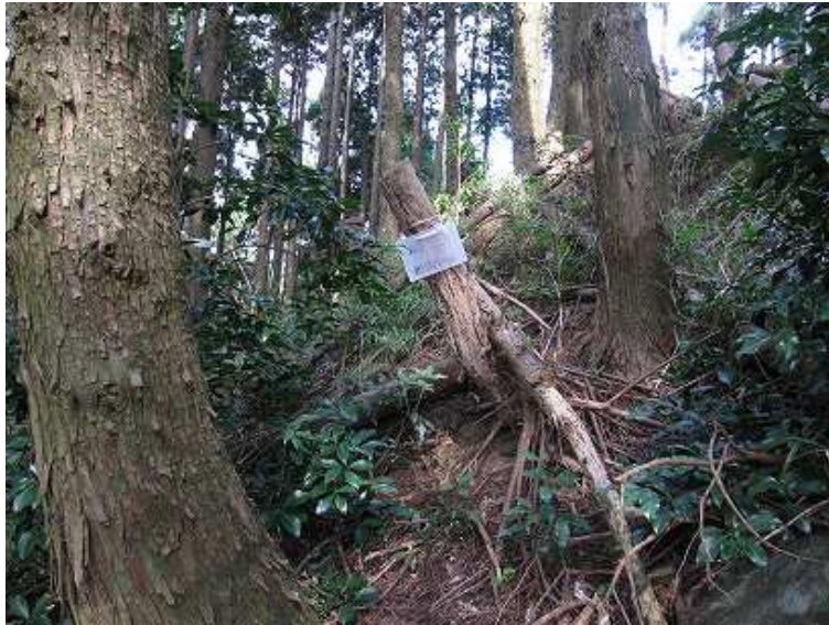
11:17 双戸窟取付の案内 消え欠けている (飯塚六四会)