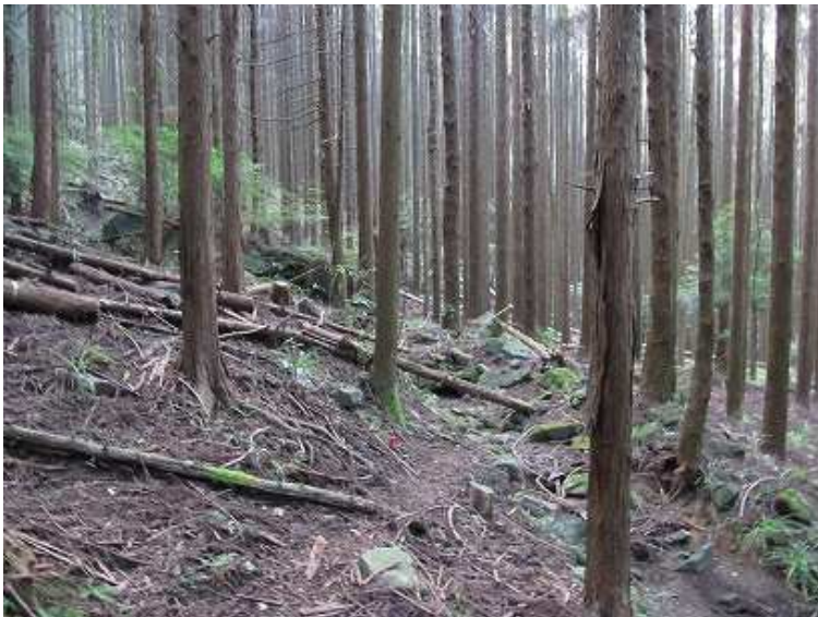
9:10 駐車場分岐から泉蔵坊跡への道