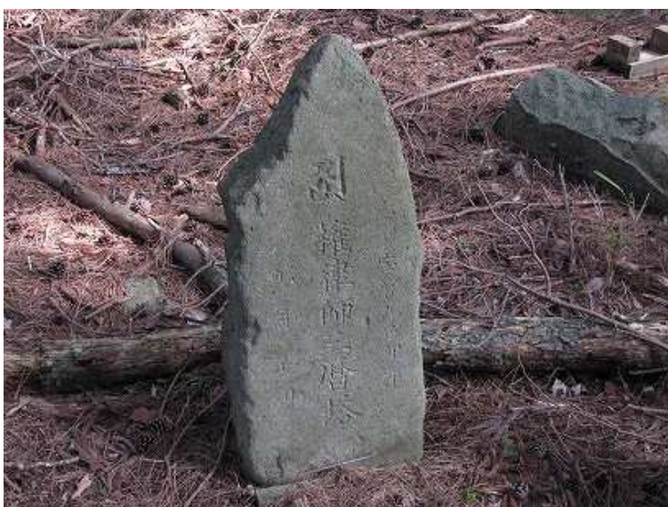
墓標には、宝暦9年と刻まれている