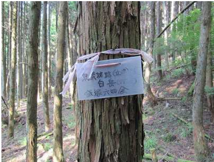
14:40 合流点付近にある案内