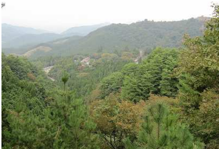
11:38 左側に見えた集落