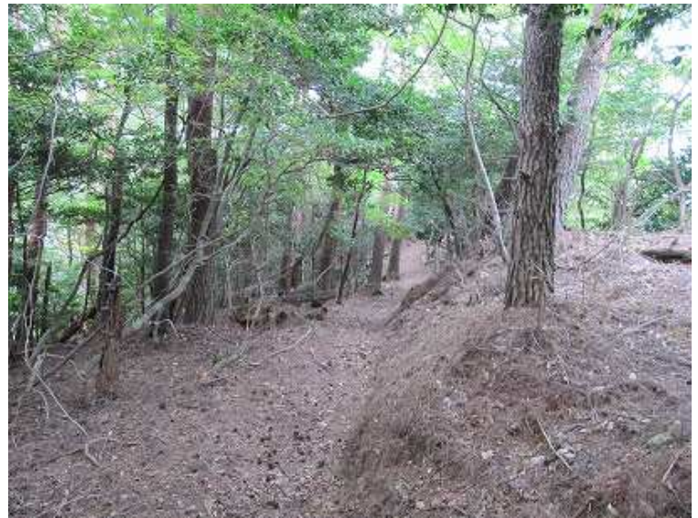
松茸が出そうな気配