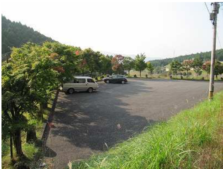
15:23 駐車場へ帰り着いた