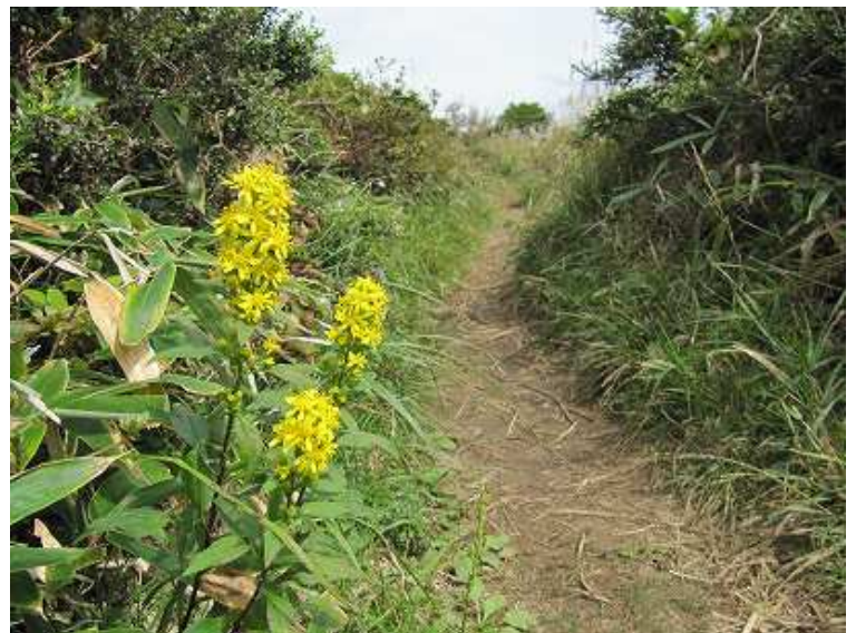
11:37 傍らにアキノキリンソウ