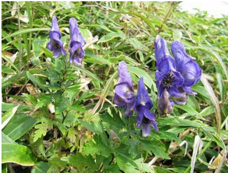
タンナトリカブト