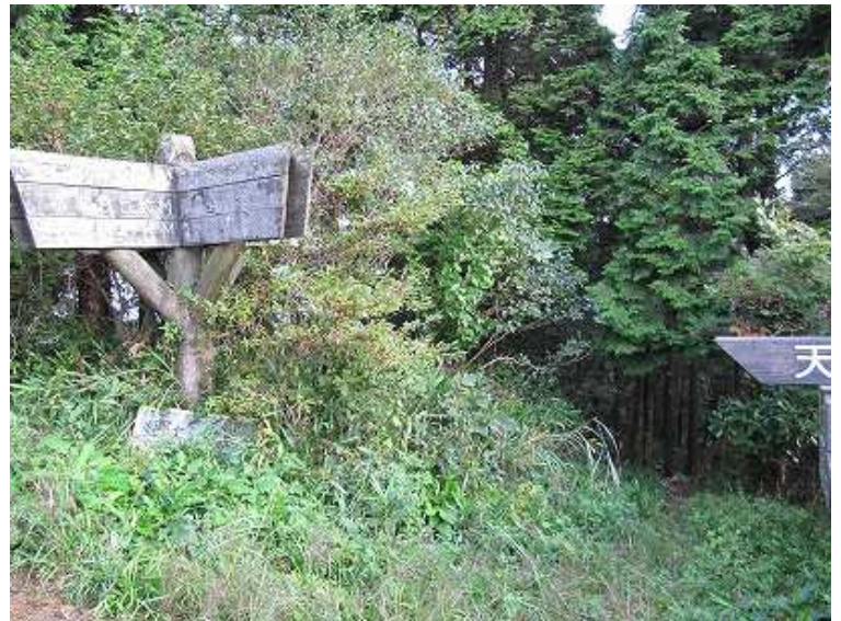
8:09 尾根末端の分岐 天山:左 杉木立:九州自然歩道で古湯へ到る