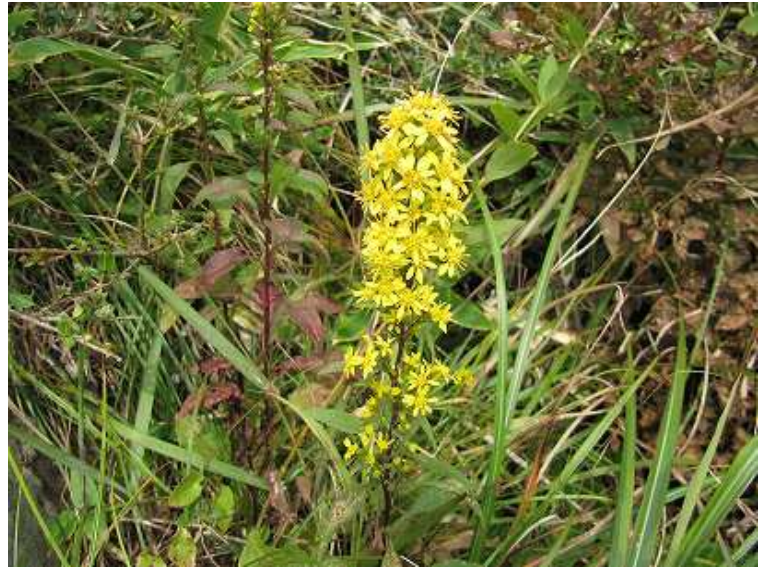
アキノキリンソウ