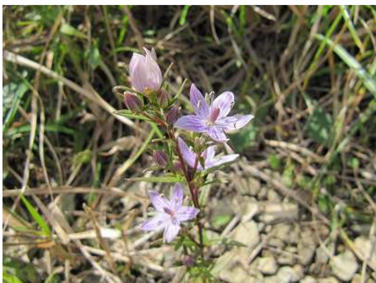
ムラサキセンブリ