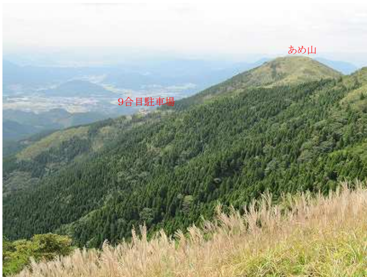
11:16 9合目駐車場とあめ山