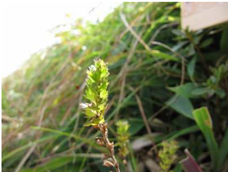
キュウシュウコメグサ