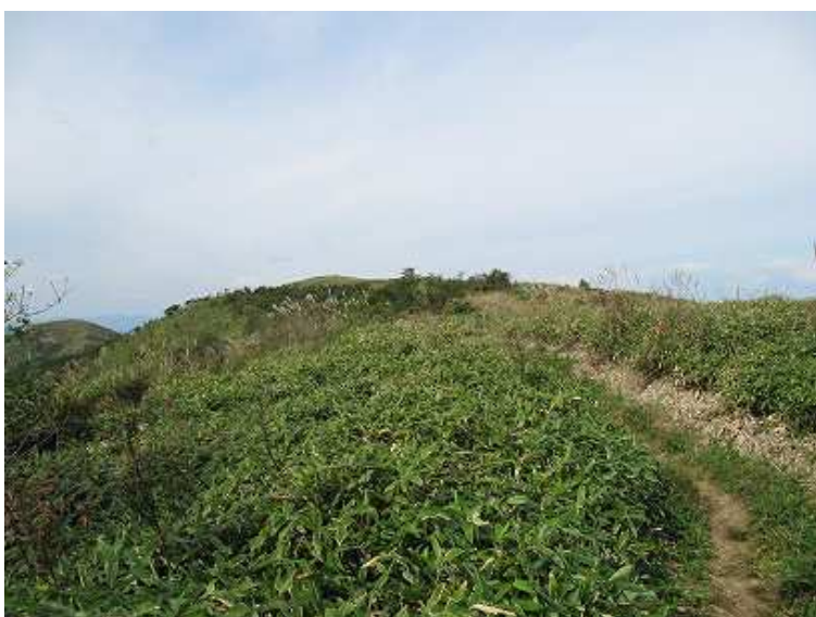
9:51 山頂まで1.1km付近。石碑が見える。