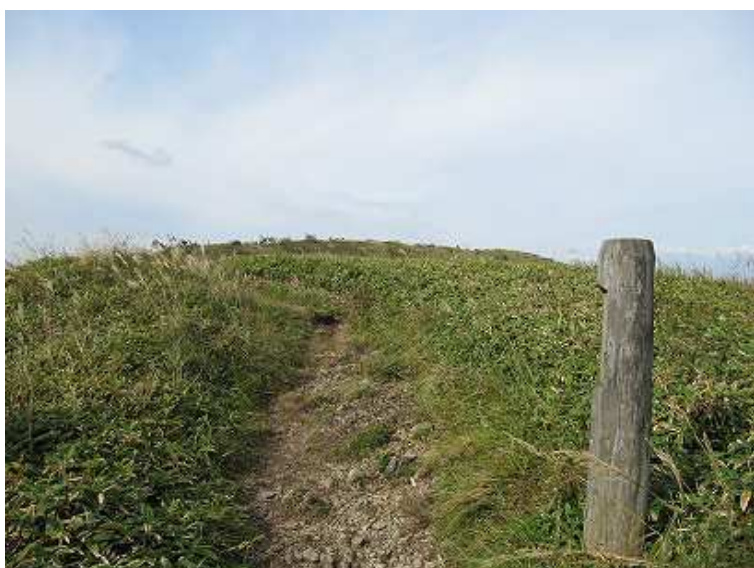
9:38 山頂尾根の端部に着く