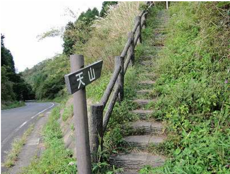
8:06 階段上りからスタート