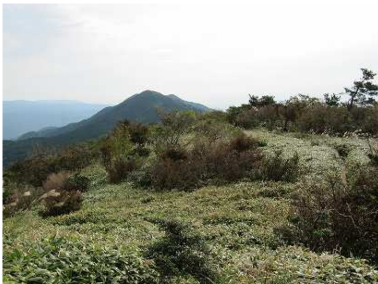
振り返ると彦岳が