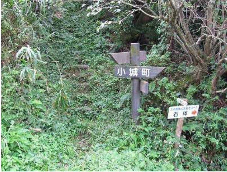
8:05 七曲峠登山口の反対側は彦岳への登山口