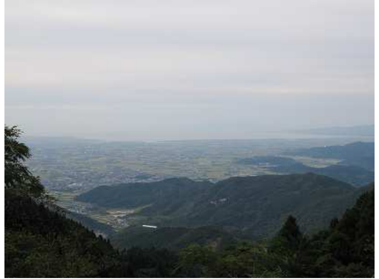
峠から見える白石町あたり