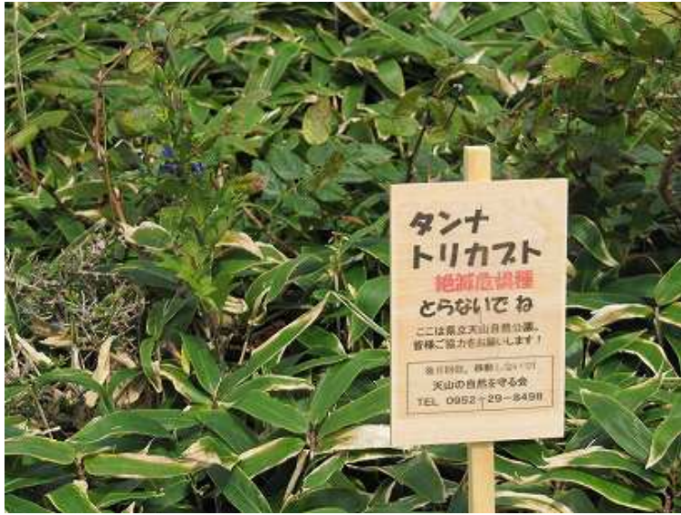
10:13 植物名の立札があちこちに立っている