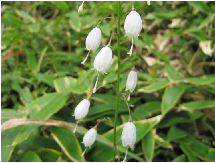
サイヨウシャジン 白花