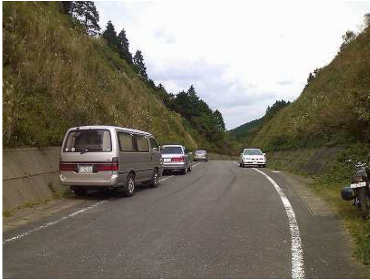
12:46 七曲峠登山口に下り着く