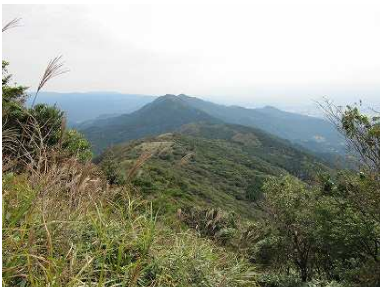
9:24 彦岳が遠くなった