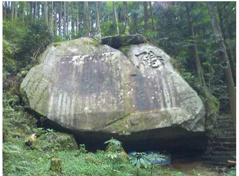
9:45 中村家の植林之碑