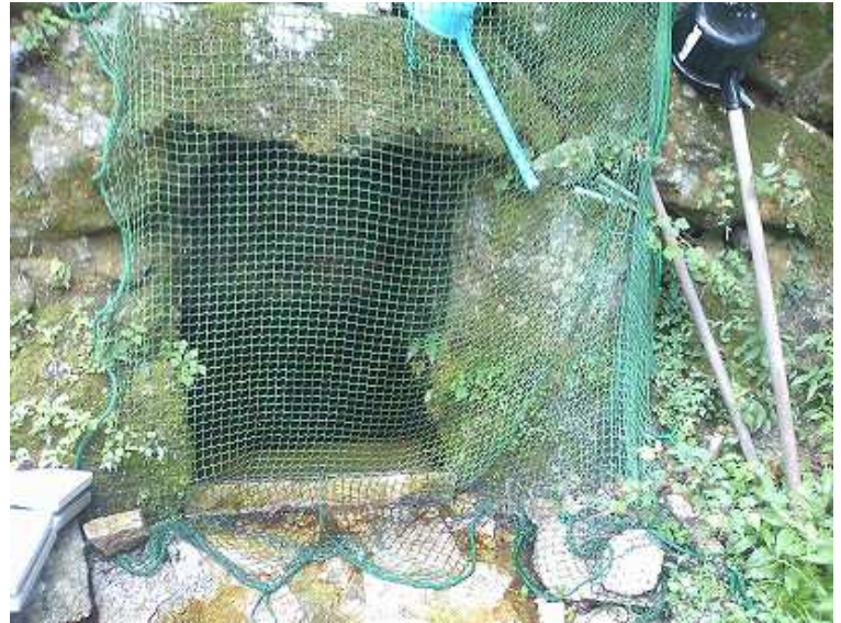
山からの湧水を貯めた水場