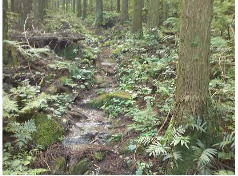
9:20 水が流れる登山道