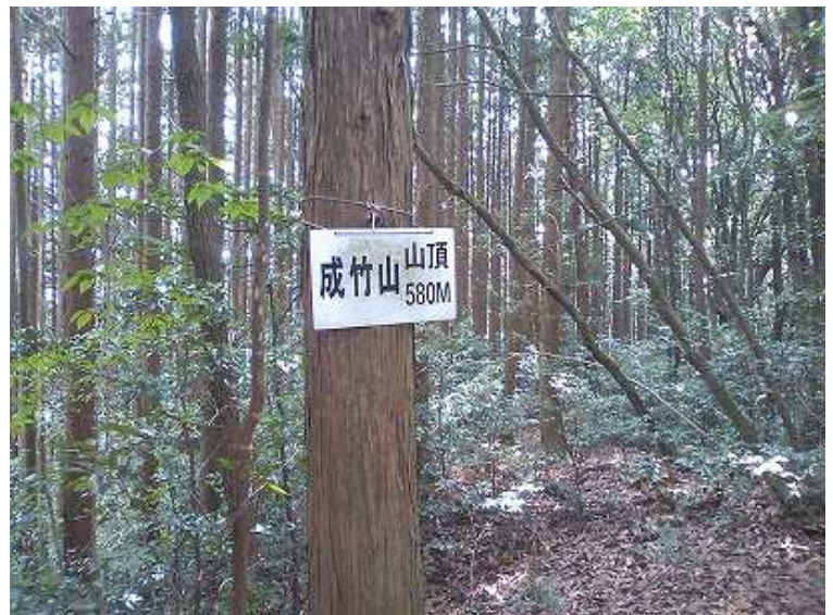
10:40 成竹山到着 見通しは利かない ここで電池が切れたので、以後の写真はない。