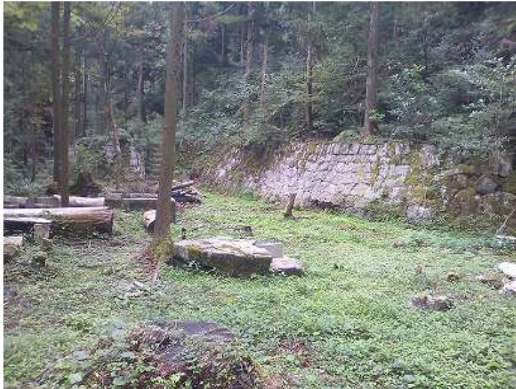
9:53 中村山荘跡 300坪位の広さがある