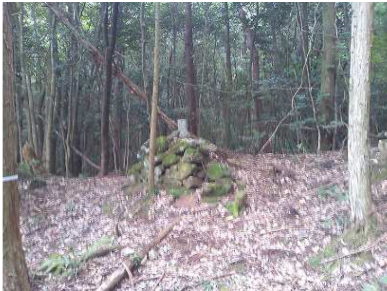
10:12 山境界杭 これを左折して尾根通しに登る。右にも赤テープあり