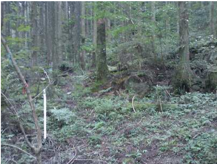
9:40 コースは右へ 直進でも山荘跡に出られそう