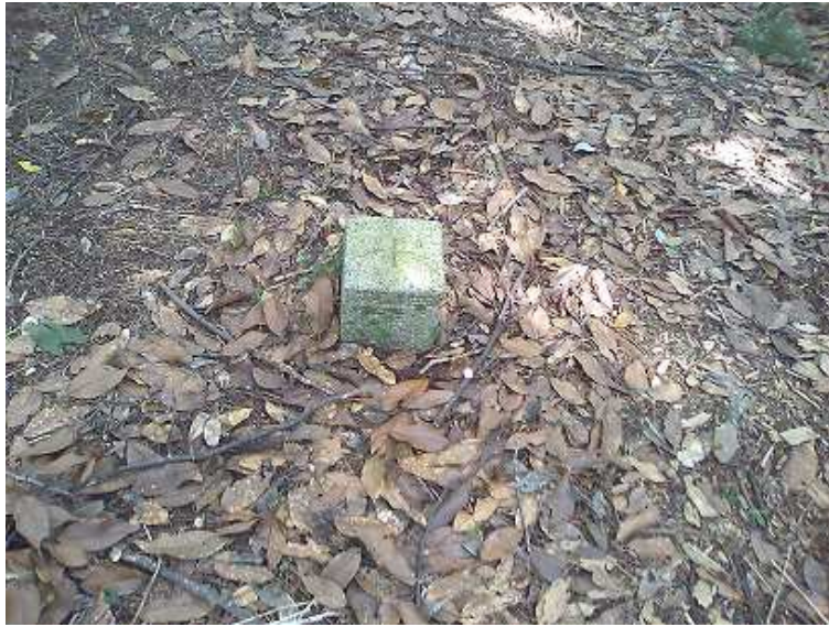
山頂の三等三角点