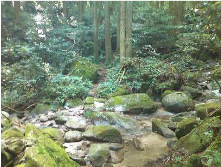
9:23 尾根分岐の先の沢 帰路、ここに下って来た