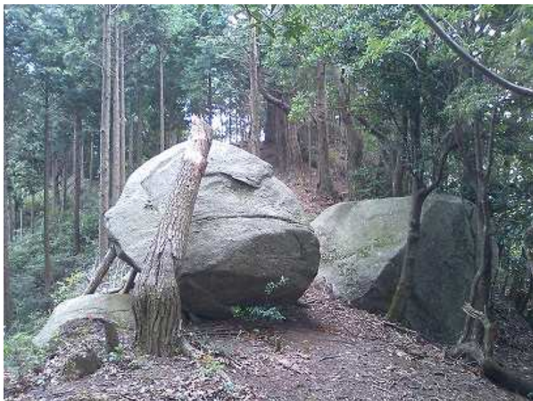
10:31 尾根に横たわる大岩