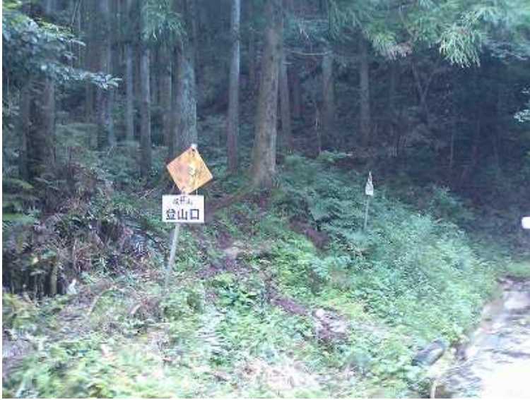
9:16 寺倉林道終点に登山口がある

寺倉登山口～尾根分岐～植林碑～山荘跡～山境界杭～成竹山～鉄板とハンマー～展望岩～尾根分岐～寺倉登山口