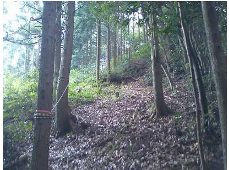
10:17 トラロープが張ってある