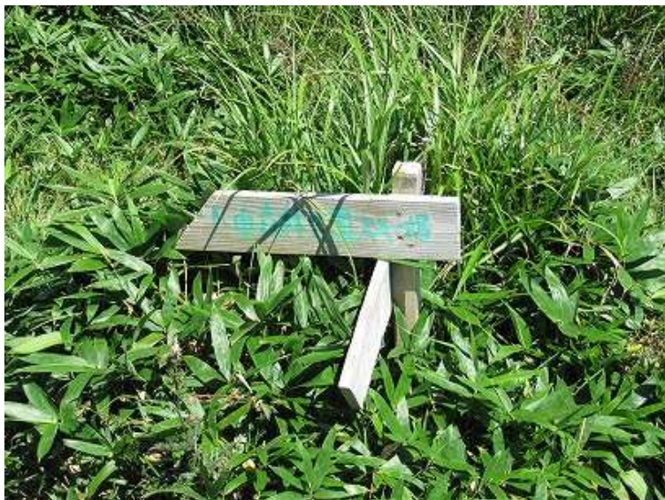
13:03 スキー場への分岐