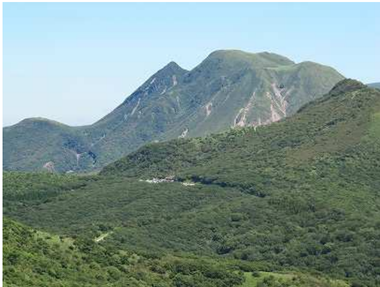
展望岩から 左から指山・三俣北峰・本峰・西峰