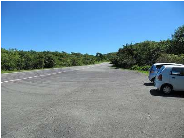
11:00 駐車場 上方が牧ノ戸峠