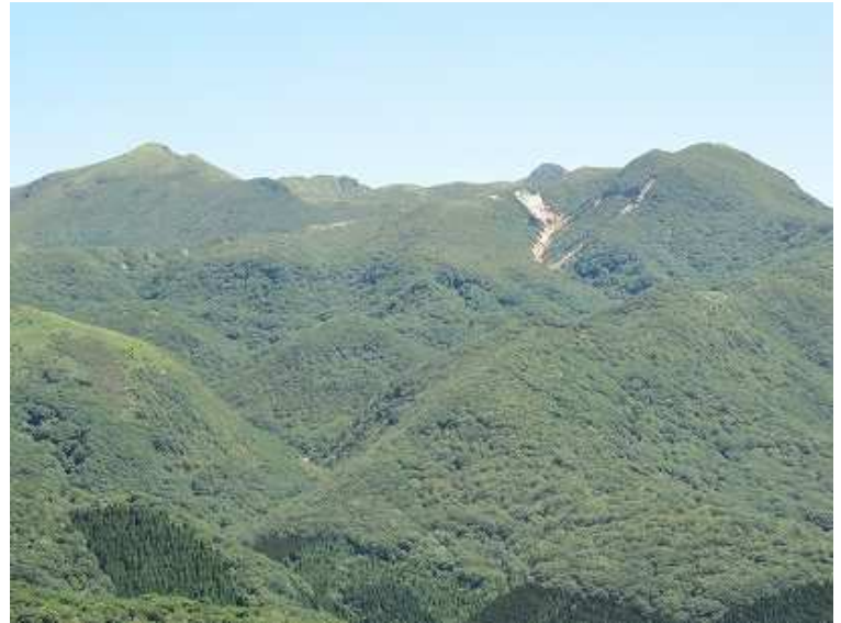
展望岩から 左から星生山・久住山・扇ヶ鼻