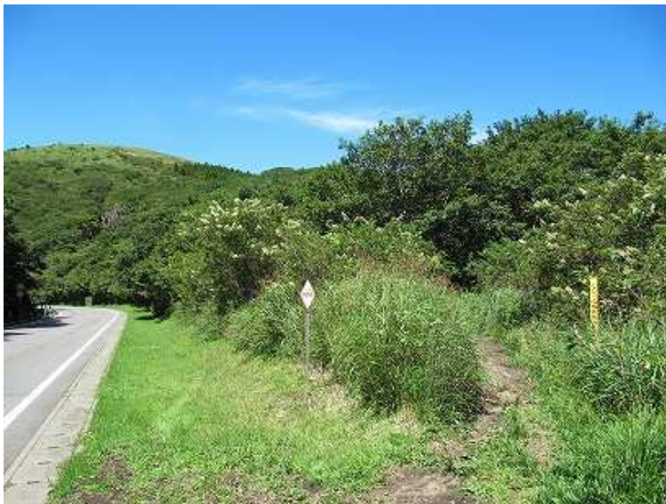
駐車場の前が登山口