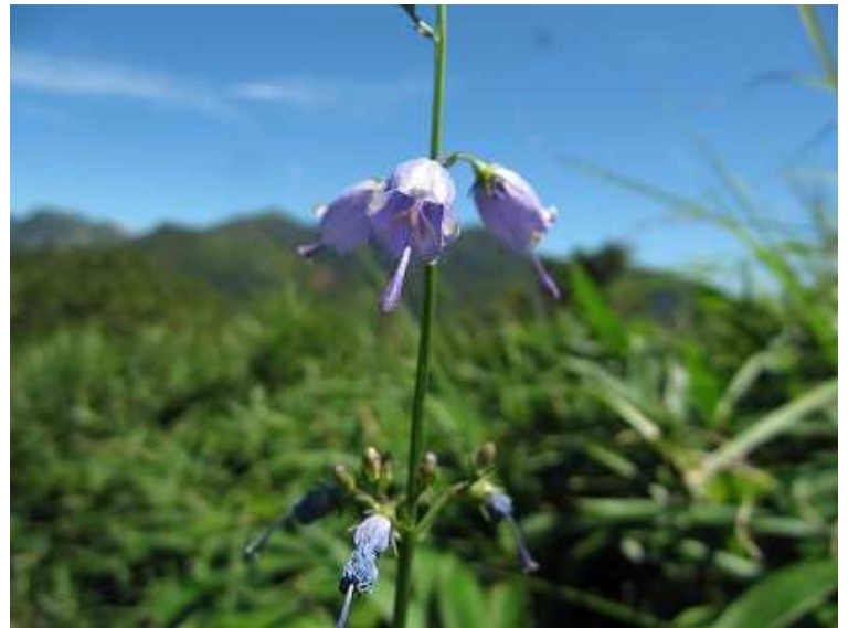
サイウウシヤジン