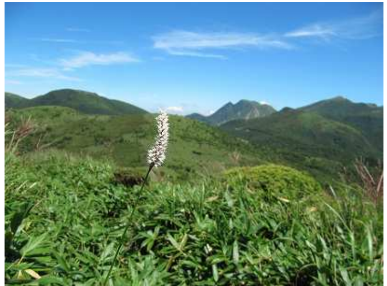
12:59 イブキトラノオと三俣山