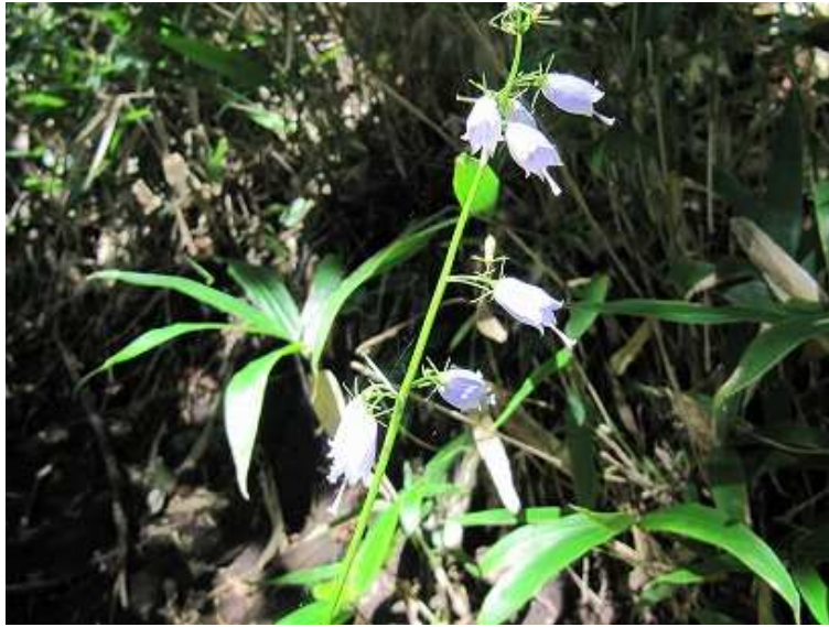
サイヨウシャジン