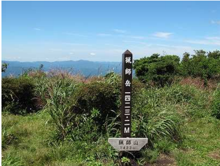
11:50 獵師山1423m 獵師岳となっている