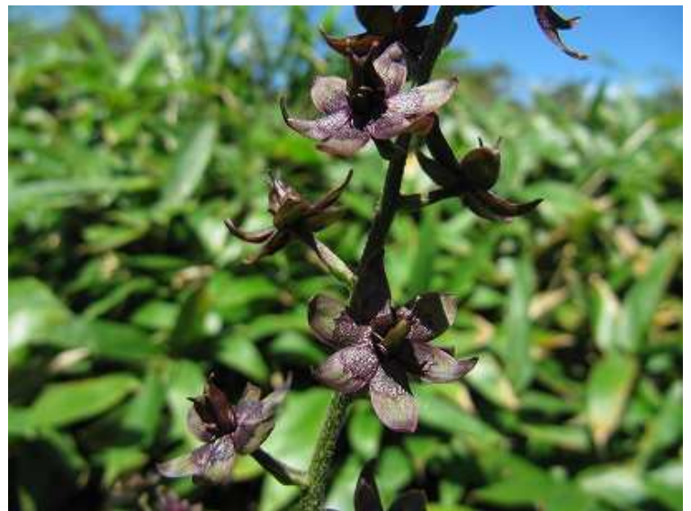
ホソバシュロソウ