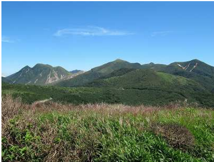
山頂からの久住連山