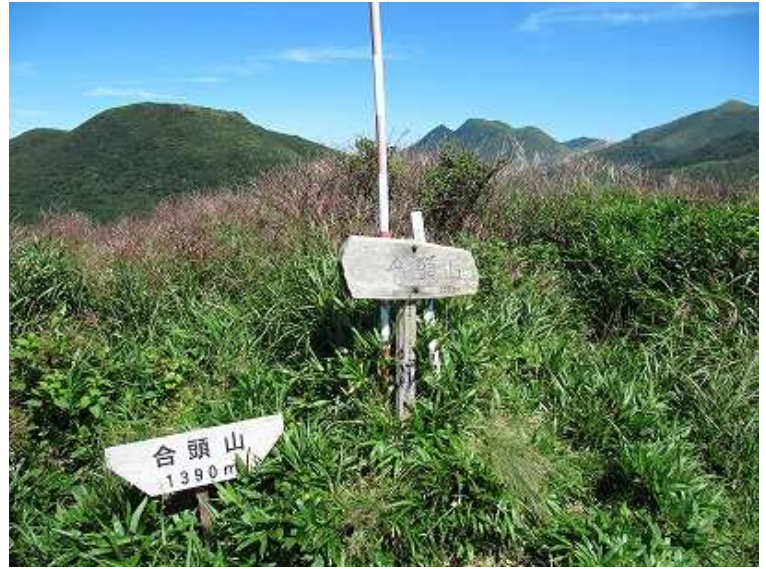
13:32 合頭山1384m 1390mとなっている