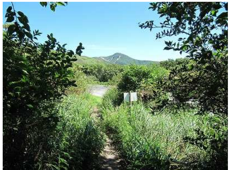
14:02 登山口から扇ヶ鼻が見えた