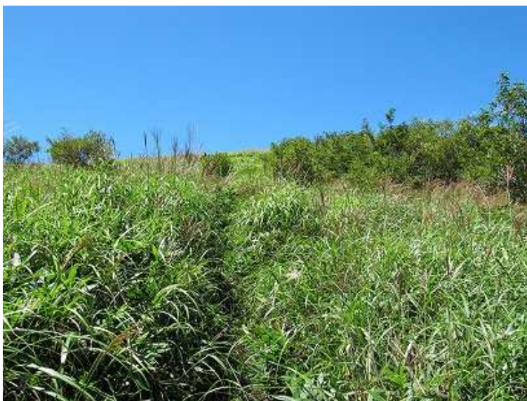
11:14 この先がP1383mで合頭分岐