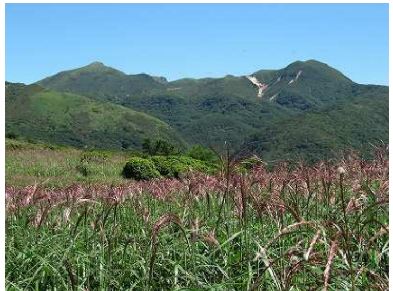
13:08 ススキの先に久住山