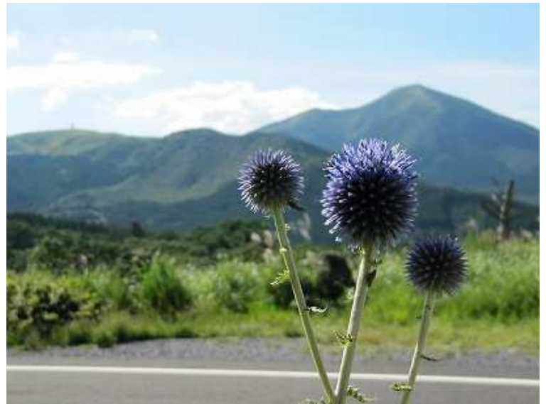
ヒゴタイ 背後は涌蓋山