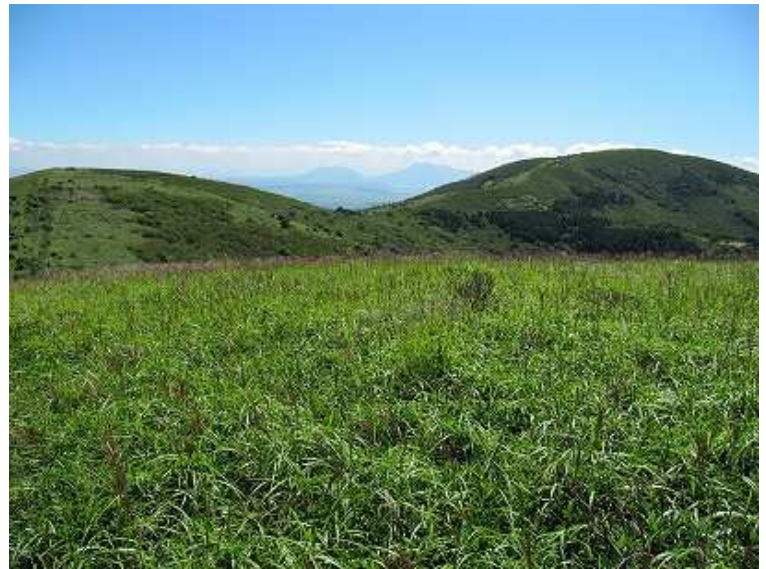
13:35 P1383mと獺師山 間に阿蘇