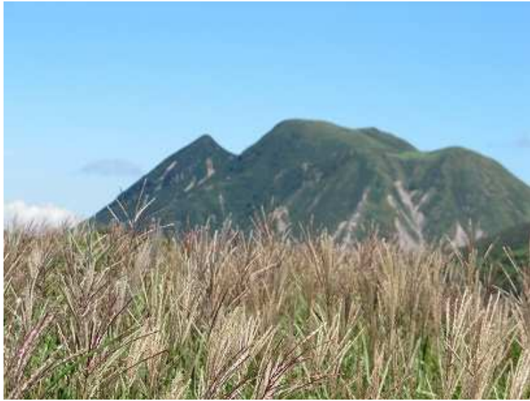
13:19 ススキ越しに三俣山