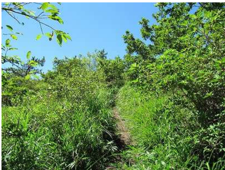
11:10 風のない灌木帯をゆるゆると登る