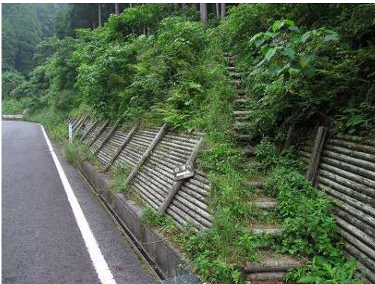
道路わきの階段から取付く