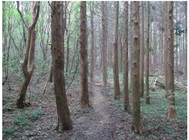
10:20 歩きやすい自然歩道