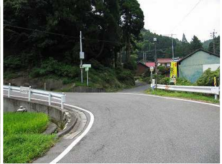
8:56 県道46号から右折して犬井谷集落を抜けて林道に合流する