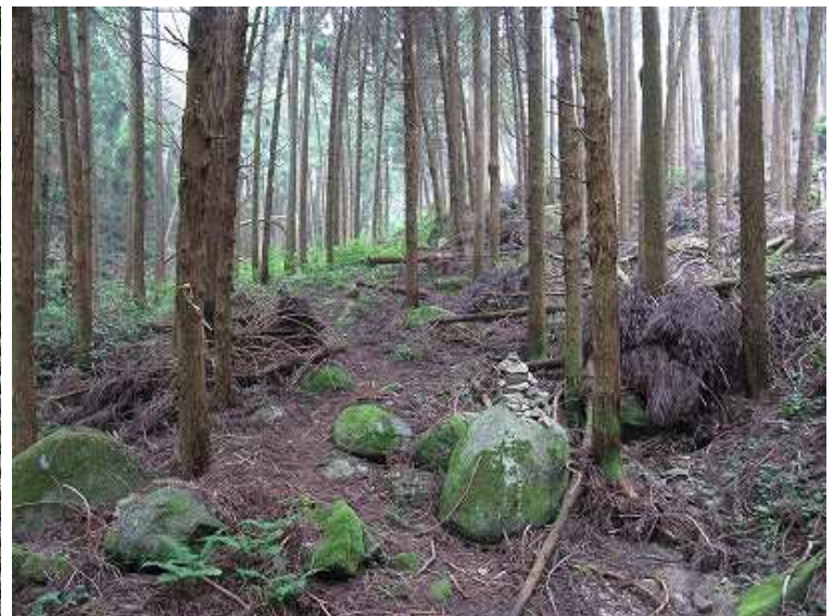
9:41 植林の中を緩々と上る