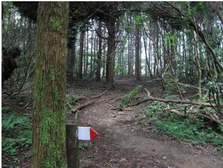
脊振山へと続く自然歩道