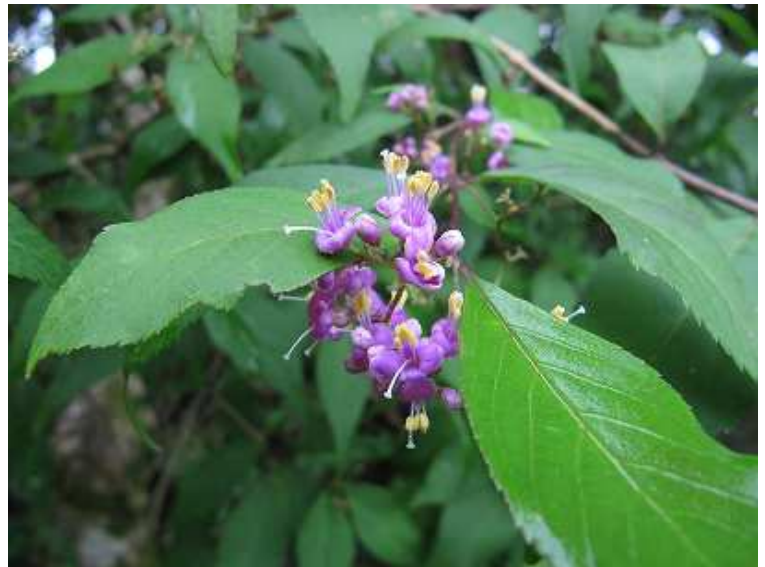
ムラサキシキブ 花