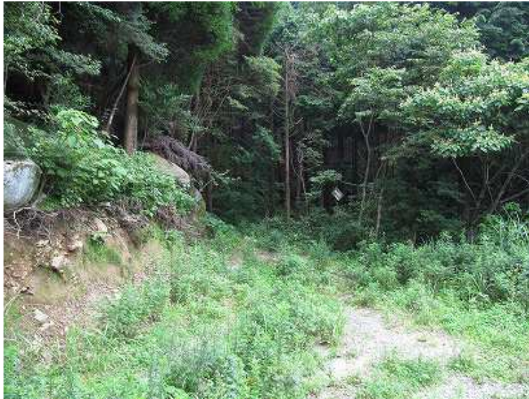
10:02 右から伸びた林道に合流する