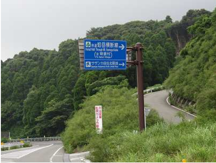
8:37 東脊振トンネルを抜けると右に蛤岳横断林道の標識がある 乗り入れるが、この先2.2kmで全面通行止めの交通規制 県道46号に迂回する

犬井谷登山口～犬井谷分岐～蛤岳～蛤水道～記念碑～水道分岐～犬井谷分岐～犬井谷登山口