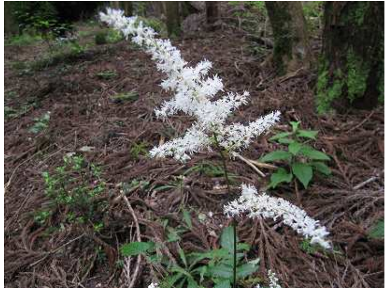
テリハアカショウマ