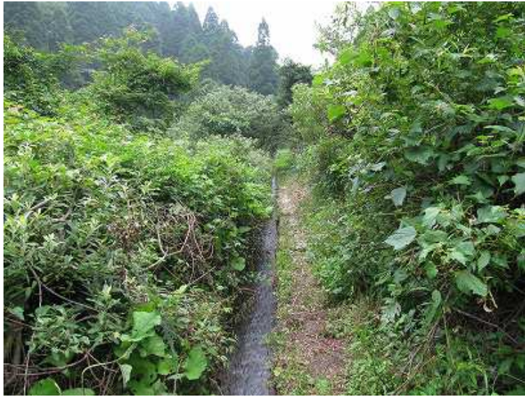
11:22 水路に沿って歩く 3分で左に分け入り自然歩道に合流する 本来は水路を直進するのが本コースと思われる