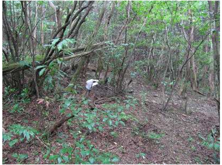
11:50 縦走路の軍手が合流点