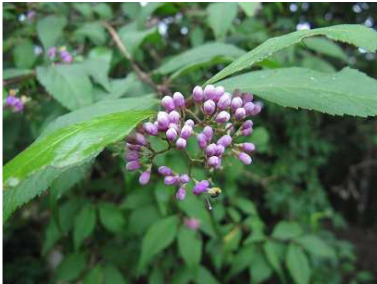
ムラサキシキブ つぼみ