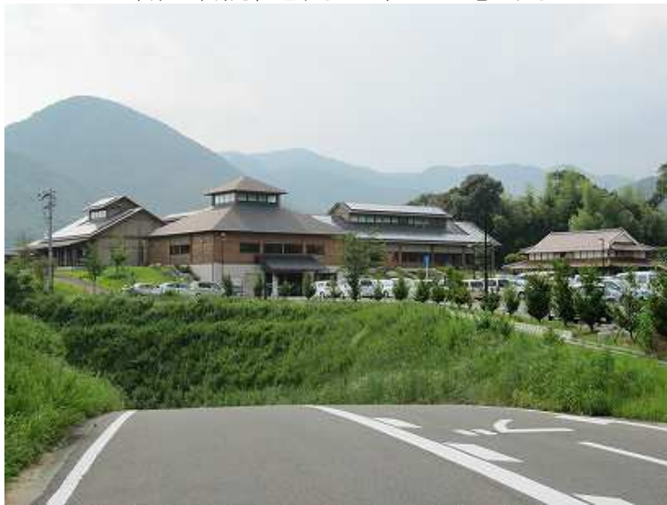
山茶花の湯 入浴料金700円 泉質:アルカリ性単純温泉