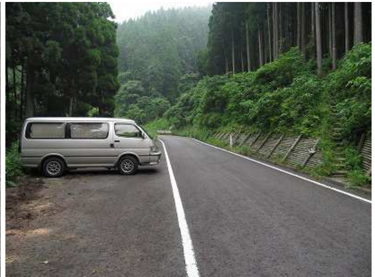
路肩に10台程度駐車可能 右の階段が取付き