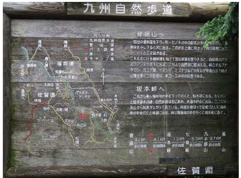
近くにある案内板