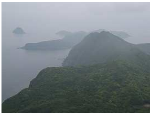
駐車場の左側の海岸線