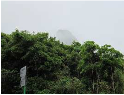
10:47 駐車場から志々伎山を観察