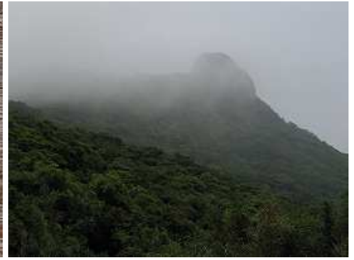
10:52 ガスが動き出した