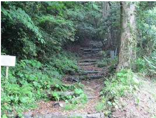
中宮跡への石段を上る