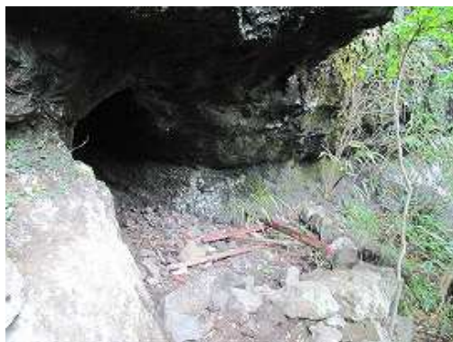
12:55 下り道標の先にある修業窟？