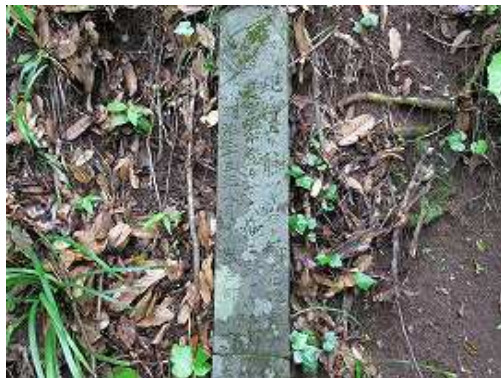
明治33年の道標 上へ登る