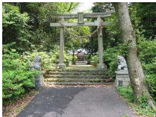
13:27 志自伎神社へ詣でる