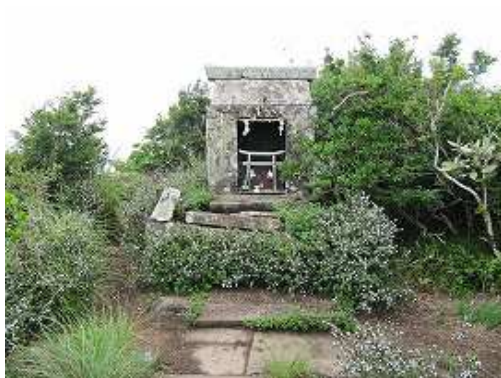
12:10 志々伎山山頂の奥宮