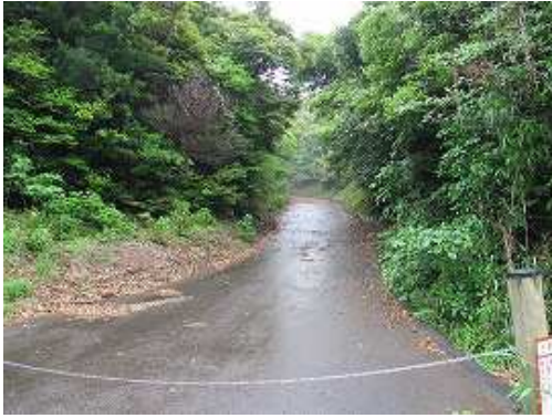
11:16 登ることにして出発