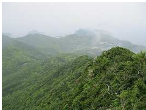
駐車場と福良漁港