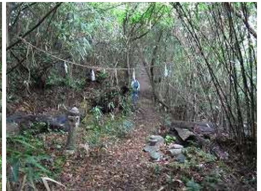
なだらかに登ってゆく