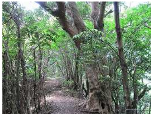
11:28 大きなマキを通過