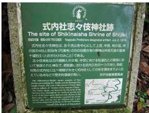
志自伎神社の案内