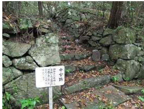
11:23 石垣だけが残る中宮跡