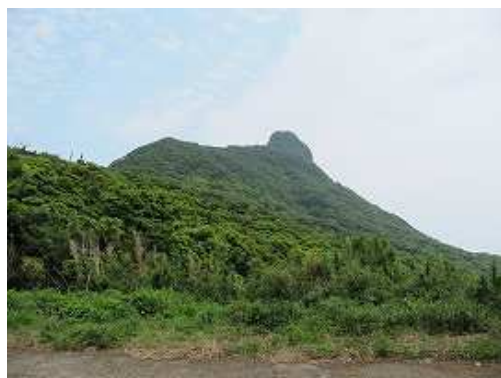
13:40 駐車場から望む志々伎山