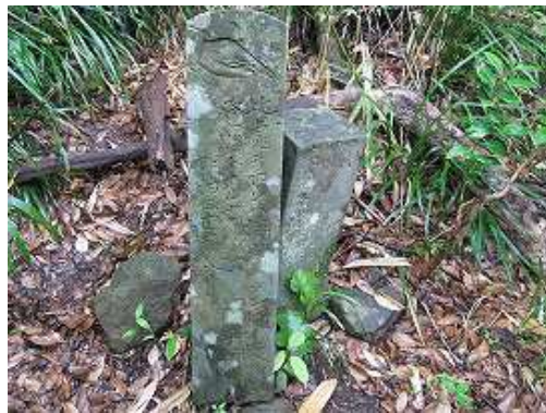
11:46 明治33年の道標 下へ降る