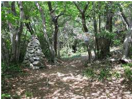
10:12 ケルンを右へ行くと頂上