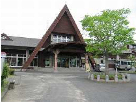
とりごえ温泉 栖の宿