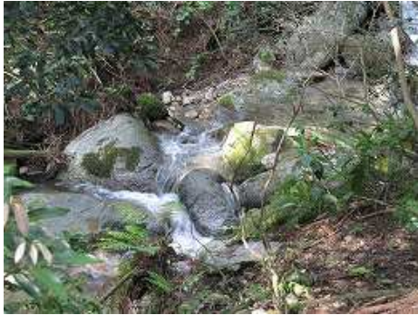
9:00 左側に沢の流れを聞きながら上る