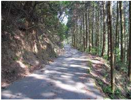
8:36 杉の植林帯の林道歩き