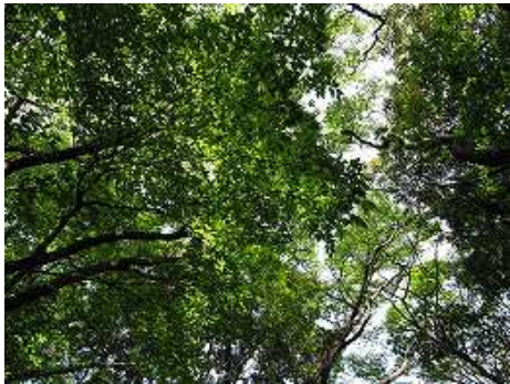
9:56 新緑が頭上を覆う