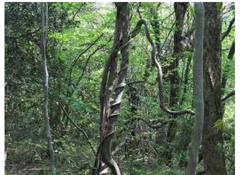
10:49 ラセン状に絡まるツタ