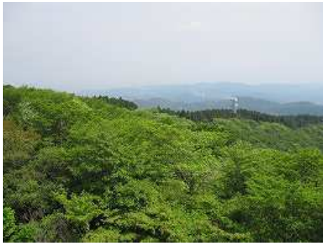
展望台から春日方面