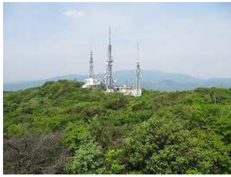
展望台から脊振方面