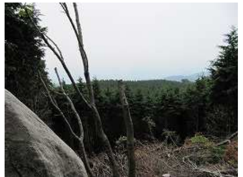
南方が伐採されている