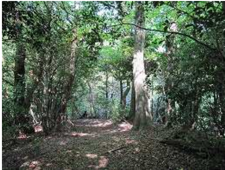
9:21 自然林らしくなる