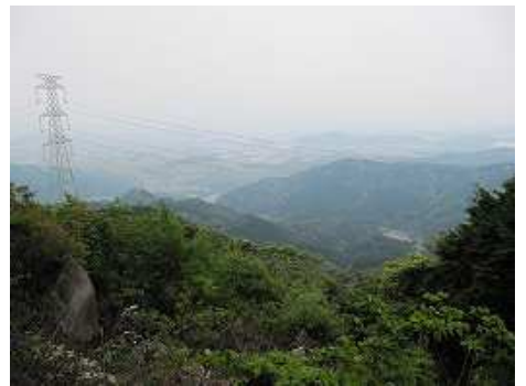
三角点(物見岩)からの展望