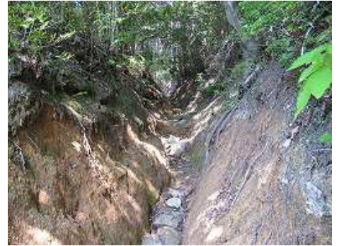
9:15 浸食された登山道