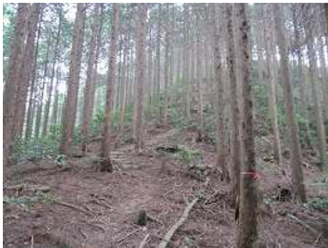
右へ登り詰めると城山