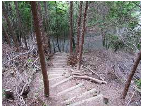
11:26 急な丸太階段を下ると林道