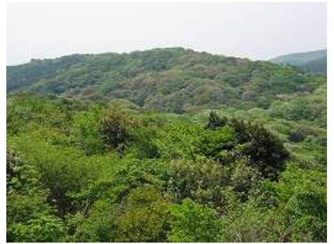
中央の尾根が四阿屋コース