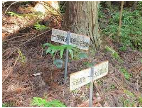
8:50 左に四阿屋コース取付きを見送る