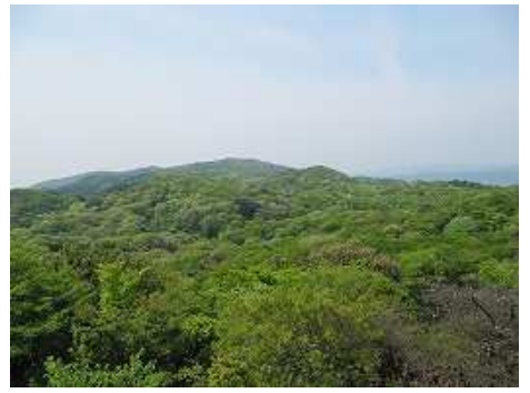
展望台から石谷山方面