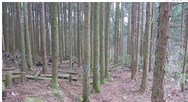
12:10 杉の植林帯を抜けると田中登山口は近い。