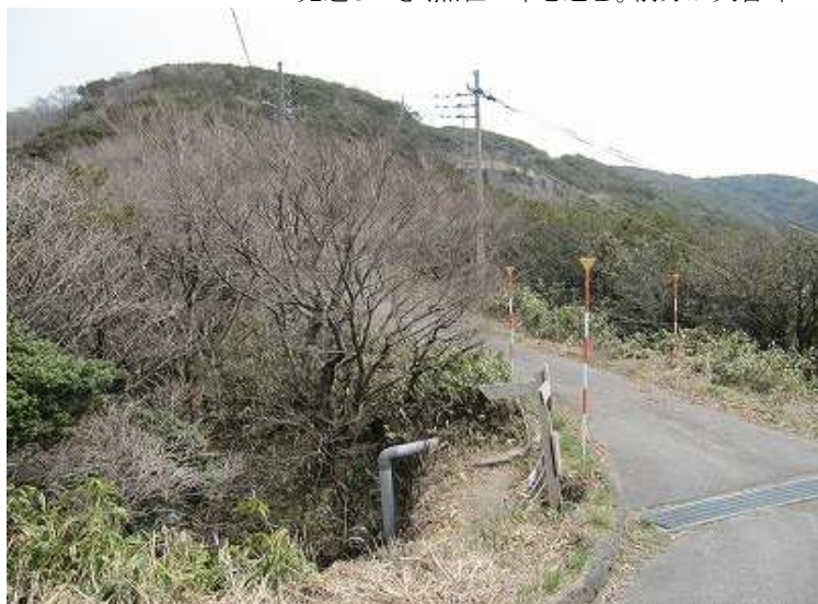
10:54 矢筈峠到着。左は車谷登山口へ