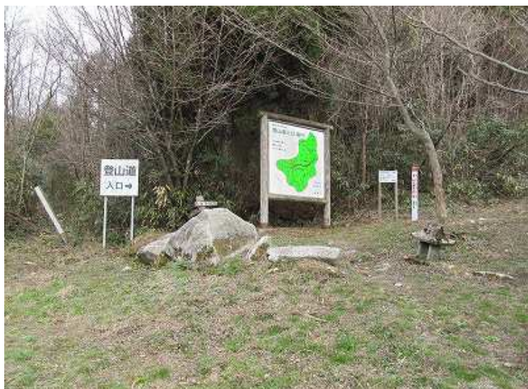
10:06 田中登山口 左: 矢筈峠へ 右: 大杉を経て駐車場へ