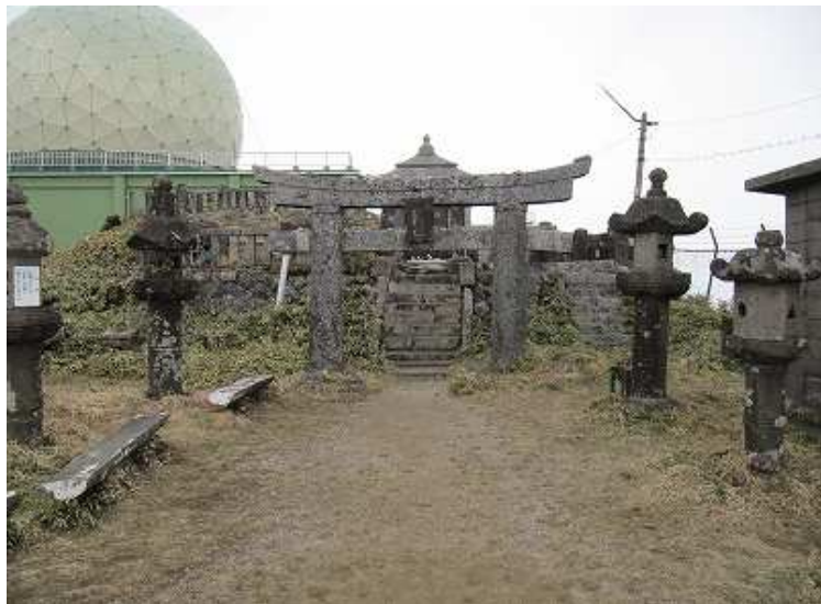
11:25 脊振山頂 小雨がぱらつき出す。