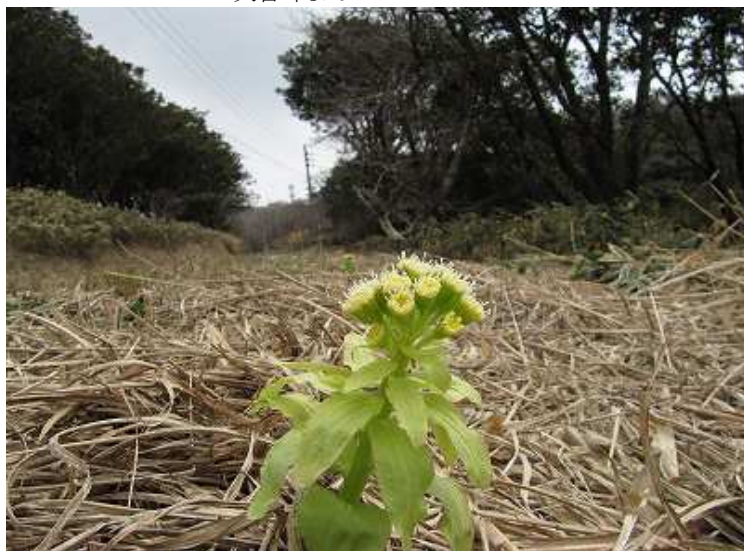
11:05 道端のふきのとう