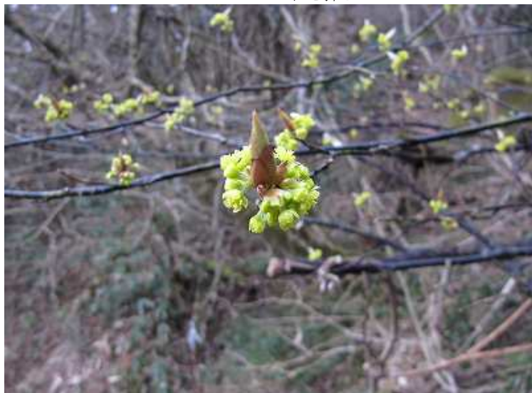
アブラチャンの花