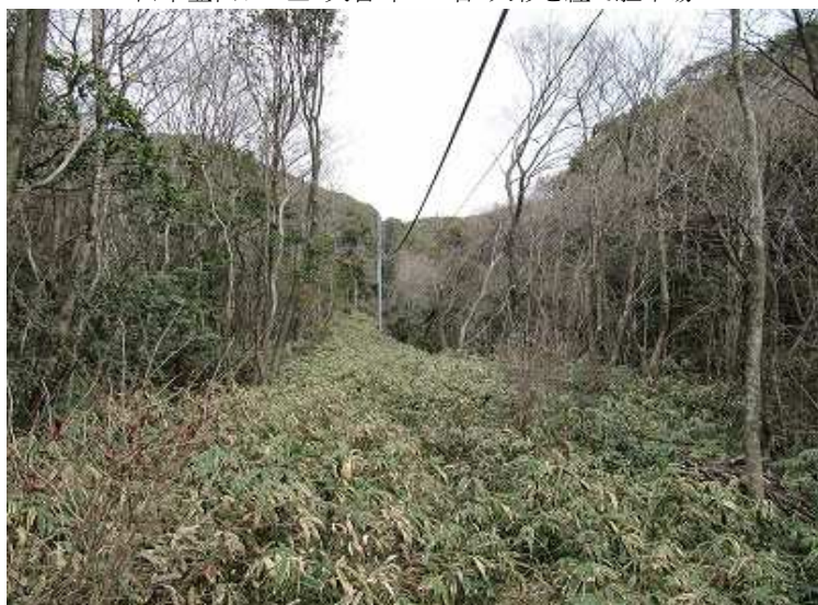
10:38 見通しのさく熊笹の中を進む。前方が矢筈峠