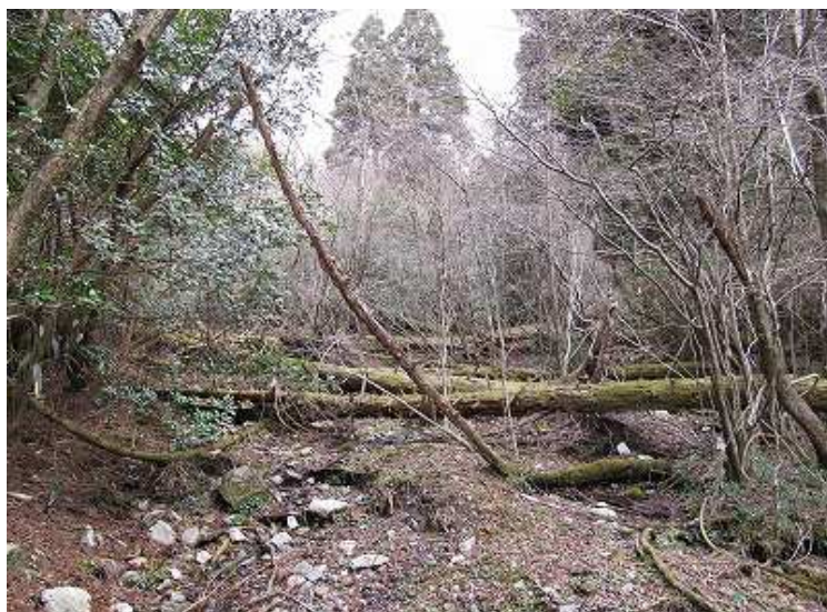
10:16 苔むした倒木を通過