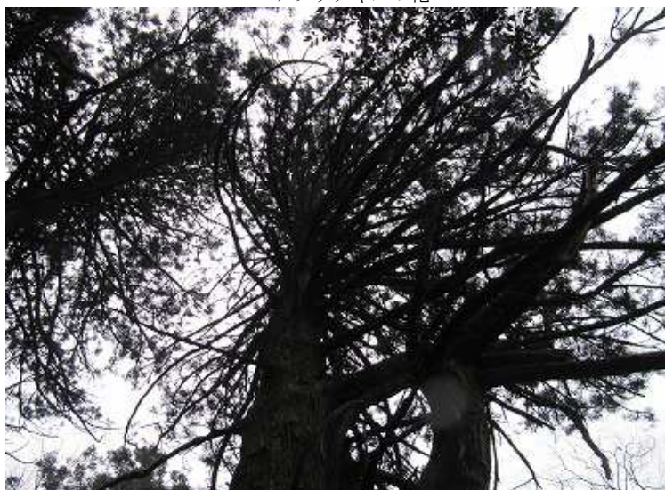
12:04 大杉を見上げる 樹齢400年超か