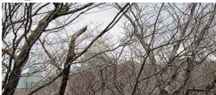
11:10 梢越しに山頂のドームが見える