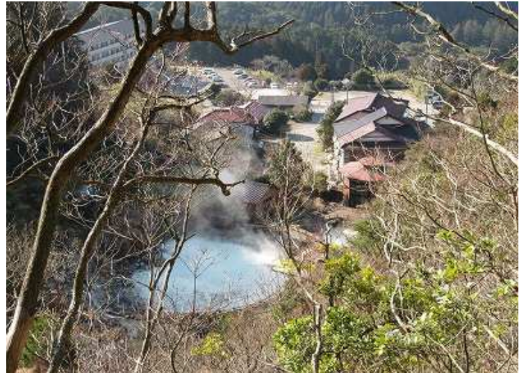
背後から眺める小地獄池と小地獄温泉