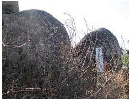
みそ五郎お手玉石