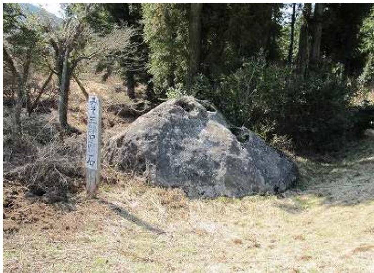
園地の「みそ五郎足跡石」