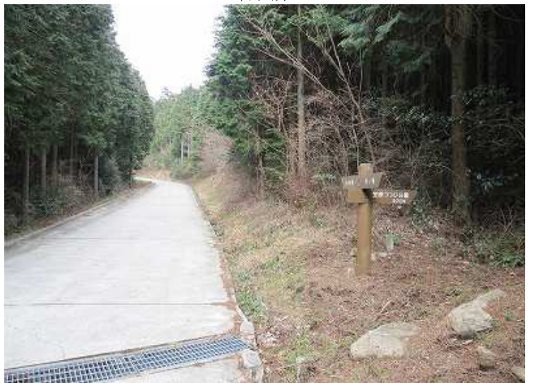
14:44 宝原園地への分岐を右に見て・・・