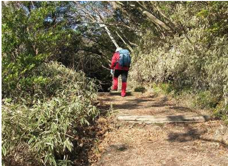
温泉街へと続く九州自然歩道