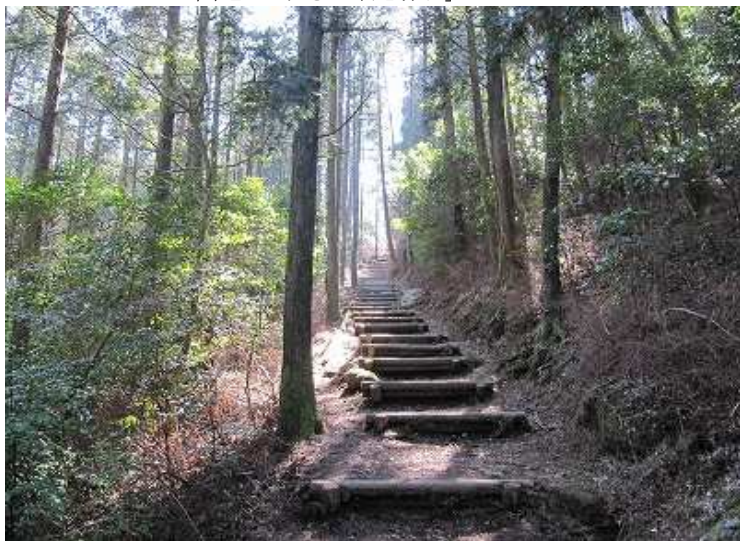
13:19 よく整備された登山道