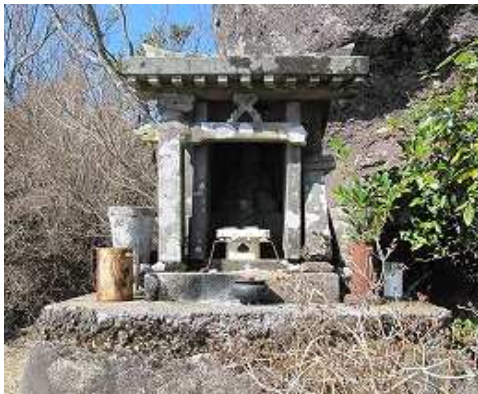
帆柱石裏にある48番札所