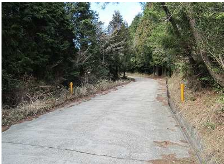
硬いコンクリート舗装の歩きは辛い