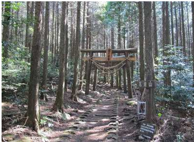
13:01 高岩山取付き部の鳥居をくぐる