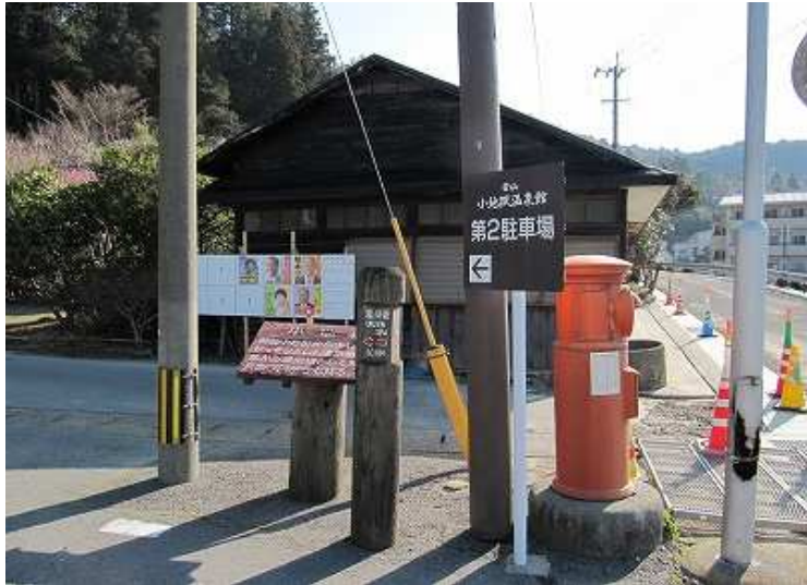
9:46 小地獄駐車場を歩き出す