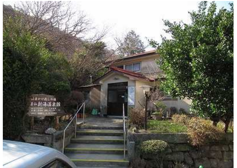
10:09 新湯共同浴場のある駐車場に着いた