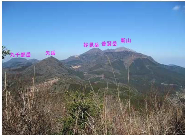
13:36 お手玉石付近から眺める雲仙三山