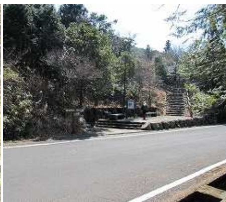
12:08 道路を横断して宝原園地へ向かう