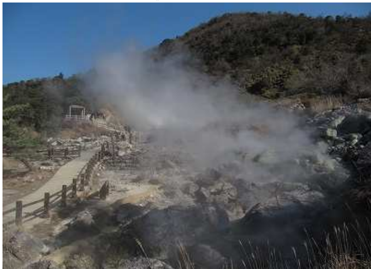
10:15 大叫喚地獄を通る