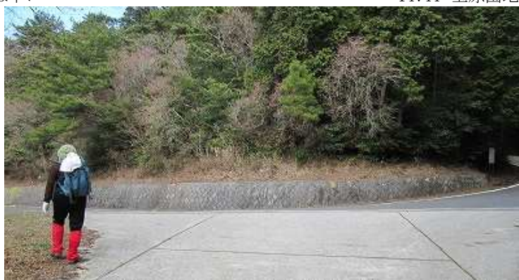
14:56 道路に出て左へ15分で小地獄駐車場