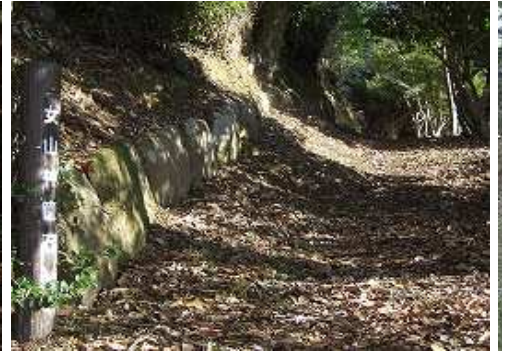
10:15 神籠石はさらに続く