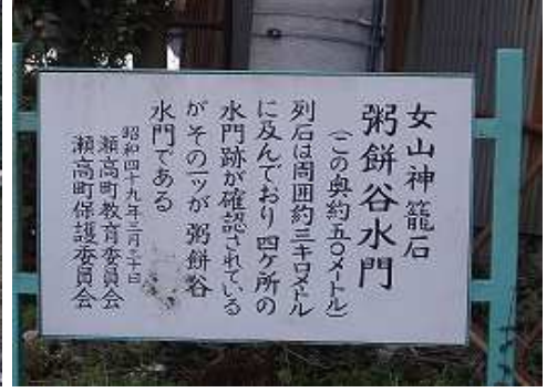
12:14 粥餅谷水門への案内