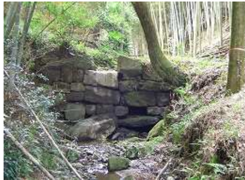
12:16 横尾谷水門（粥餅谷水門）