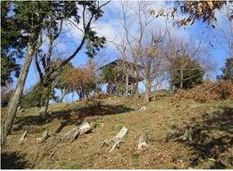
10:22 左に展望台が見えた