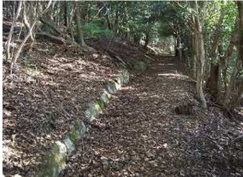
9:39 神籠石に沿った遊歩道