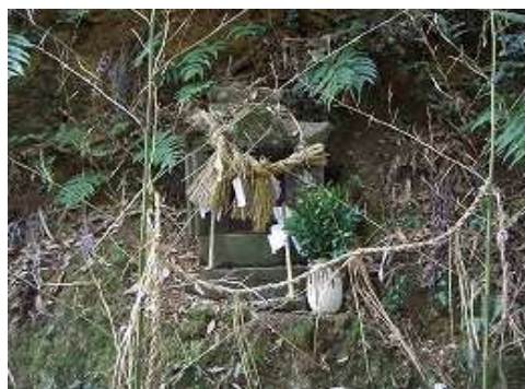
日子神社右側の山に祀られた祠