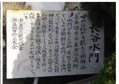
13:04 梅野家入口の長谷水門案内