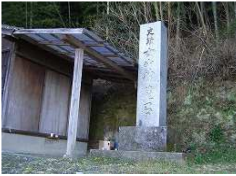
9:22 女山林道入口の石碑