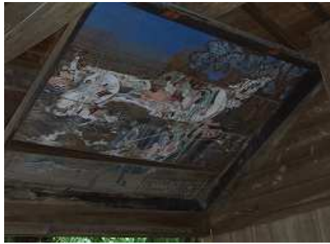
七社に奉納された絵馬