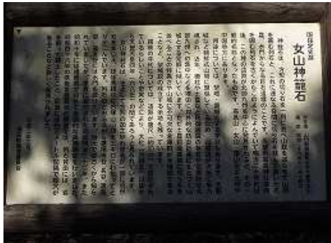
9:53 女山神籠石の説明