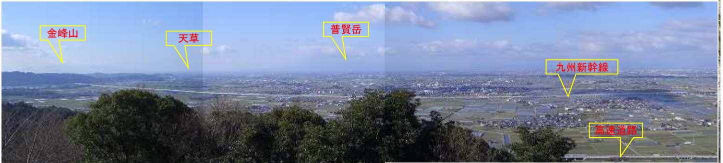
展望台からの眺望