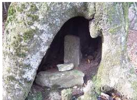
10:36 ウロに安置された石仏