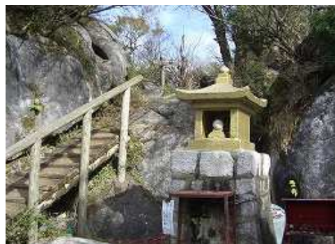
12:11 古処山 山頂