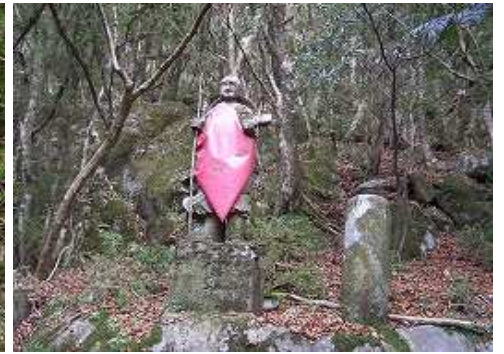
12:18 9合目付近の赤い石仏