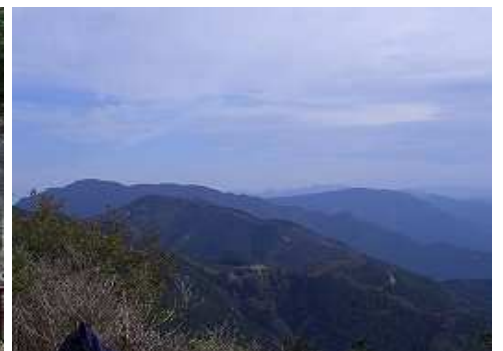
12:11 山頂から馬見山・英彦山方面を望む