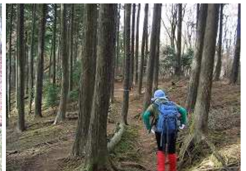
10:41 杉木立の中を行く