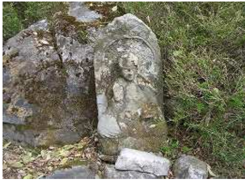
12:16 まゆみ広場の石仏