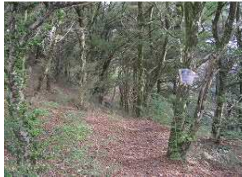
9:34 ツゲのトンネル入口