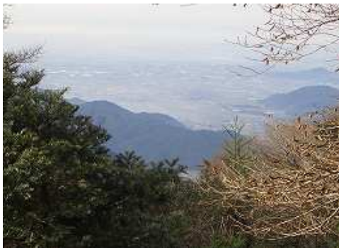
9:36 ツゲ入口から秋月を望む