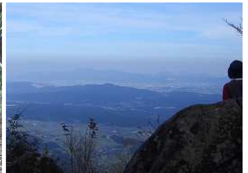
10:35 屏山山頂から福智・平尾台方面を望む