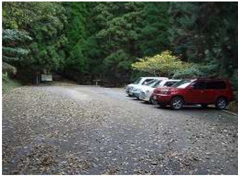
8:45 5合目林道終点の駐車場