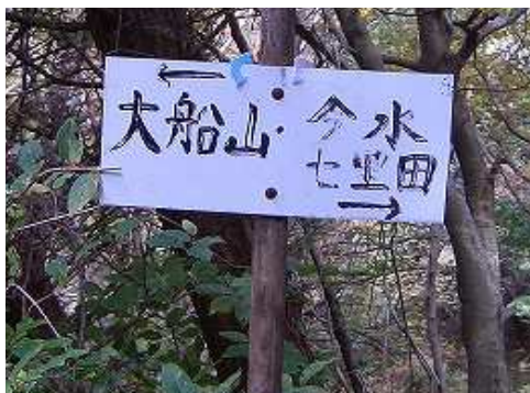
9:33 風穴～柳ヶ水ルートに合流