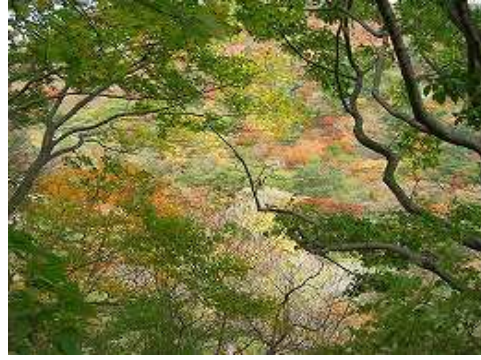
前セリ付近の紅葉