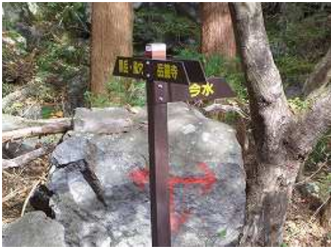
9:40 今水分岐に着いた