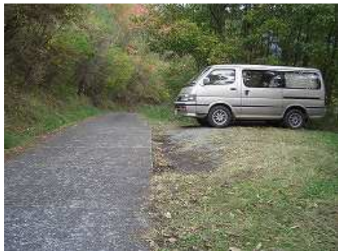
8:30 第1ゲート下に駐車