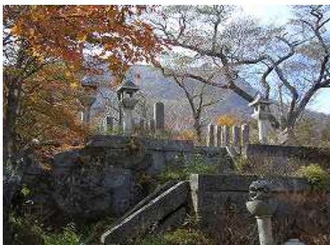
中川久清(入山公)廟