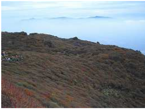
12:46 大船山頂付近より祖母方面