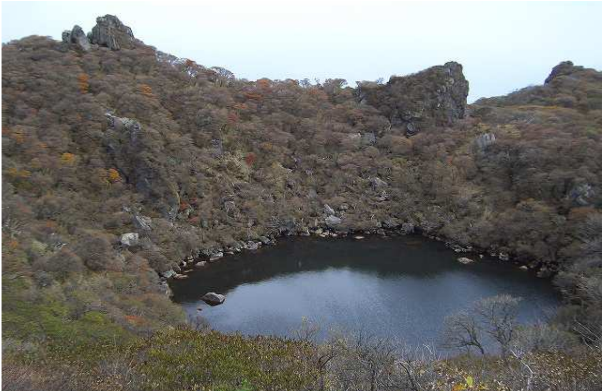
12:40 大船山山頂付近より御池