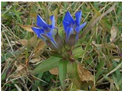
9:27 道端に咲くリンドウ