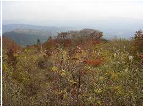
ポールより南方面