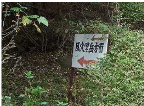
9:31 舗装路から登山道へ