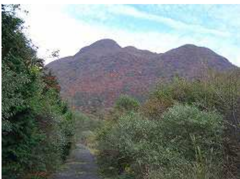
9:28 黒岳斜面の紅葉は見事