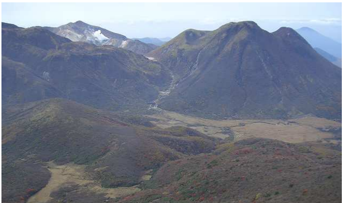
12:42 大船山山頂よりの眺め