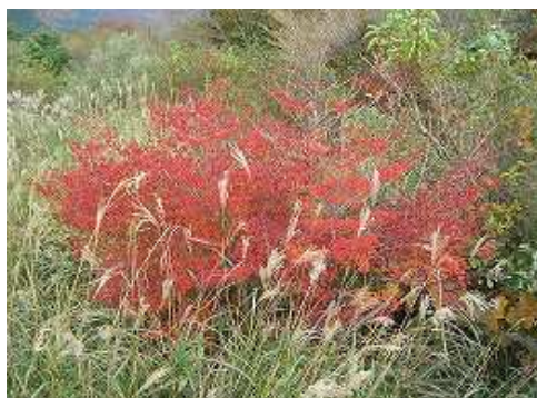
9:10 モミジの見事な紅葉