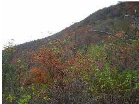
11:04 尾根の左斜面の紅葉