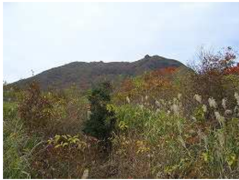
ポールより大船山方面