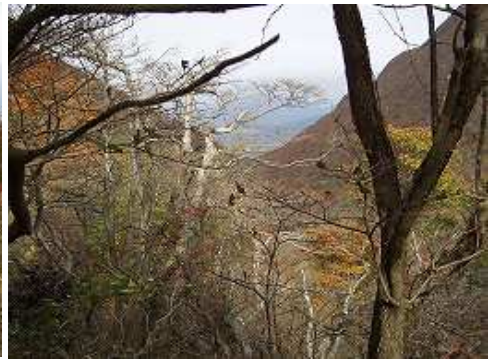
10:33 樹間より奥セリ方面