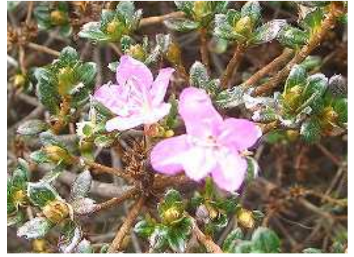
季節を間違えたミヤマキリシマ