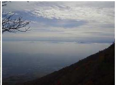
11:15 左手の奥に祖母～傾