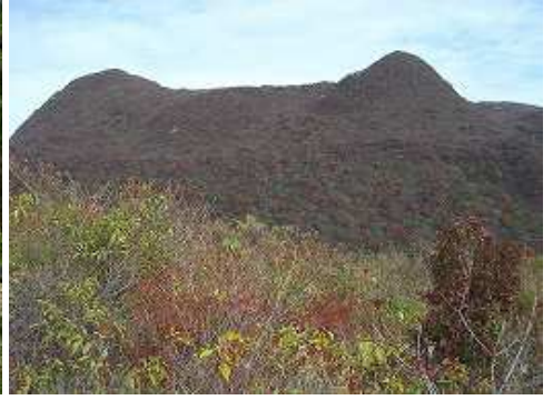
10:17 ポールより黒岳方面