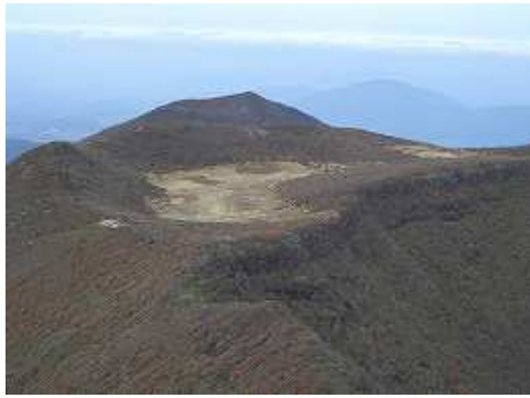
大船山頂付近より段原と平治岳