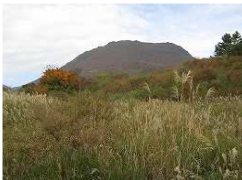
9:08 前方に大船山が見えた