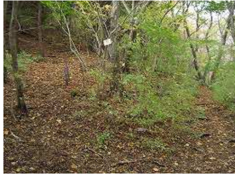
9:45 前セリ (東尾根登山口)