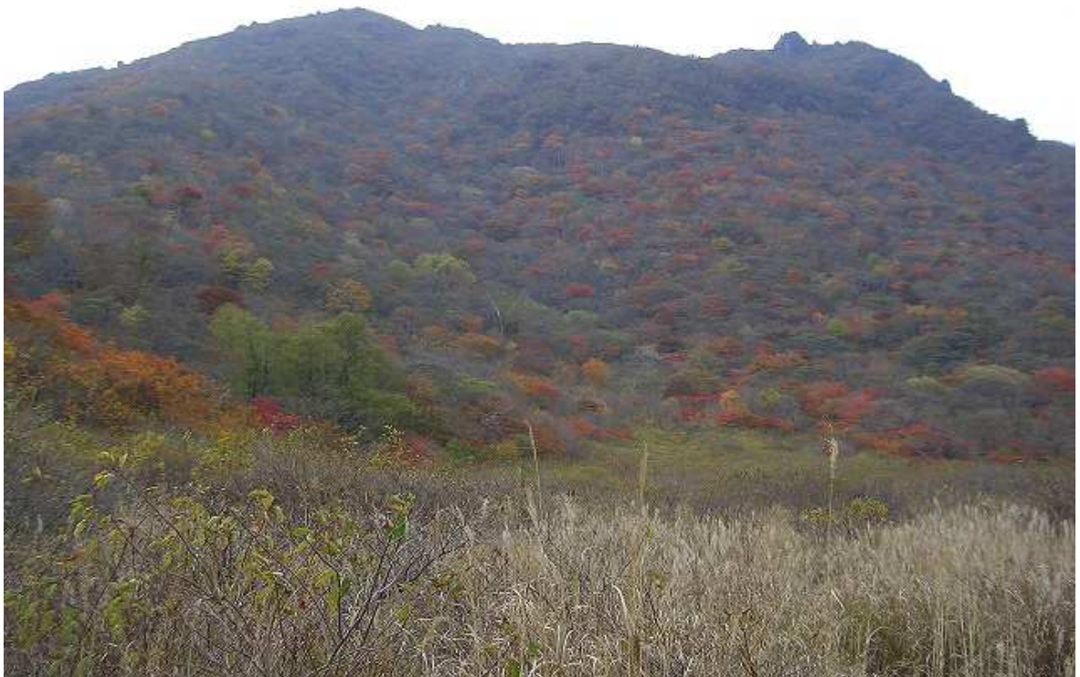
13:46 鳥居窪からの大船山