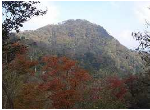
10:56 尾根からの北岳方面