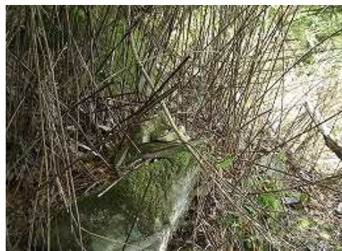
鹿の角への入口のケルン