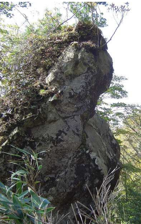
大岩の手前左側に立つ「ゴリラ岩」