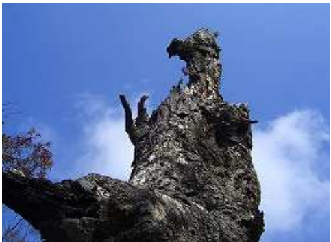
11:05 恐竜に似た枯死木