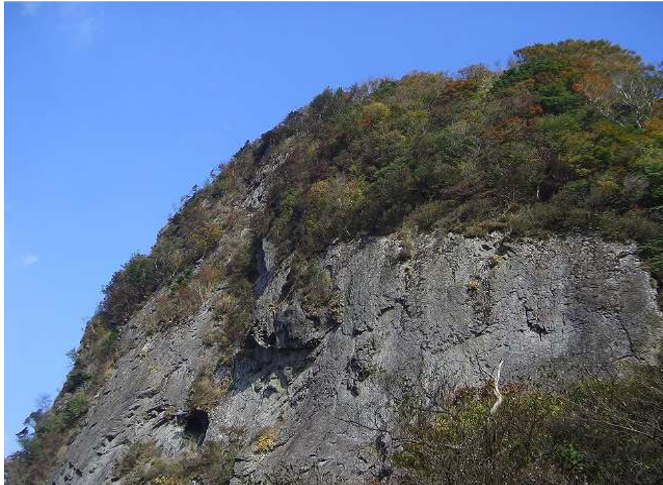
籠水峠より大岸壁