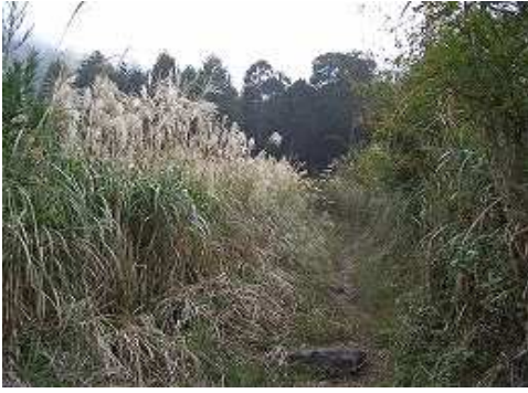
山野城跡先より大船・黒岳を望む