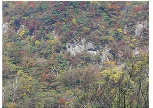
南岳岸壁の拡大と紅葉