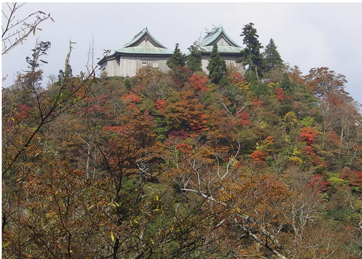
英彦山上宮と紅葉