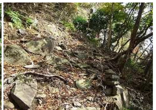
右端のケルンを見落とさないで