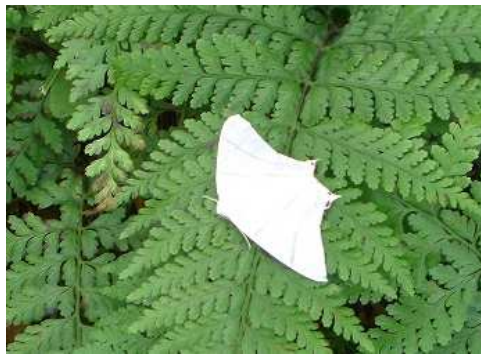
シダの葉で休むコガタツバメエダシャク