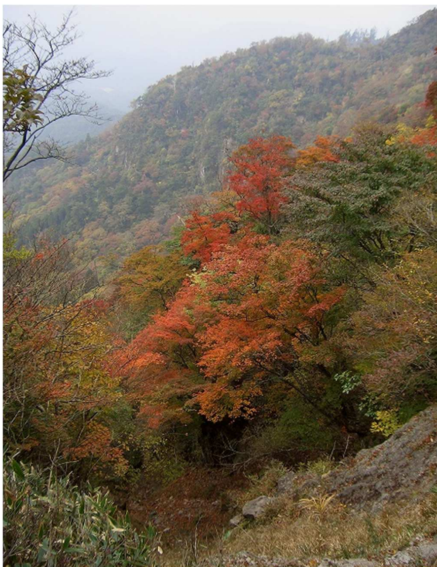
クサリ場を降りた右側の沢