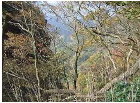
尾根から大岸壁右側の沢