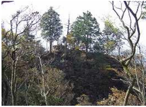
大岸壁のヤセ尾根