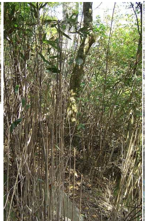
スズタケの中を急登する