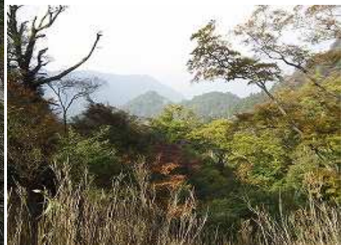
籠水峠より黒岩岳方面