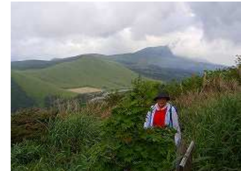
尾根に取付き、灌木帯を抜けるとスキの斜面である。背後に一目山や涌蓋山が広がる。季節外れのミヤマキリシマが2つ3つ咲いていた。