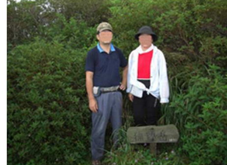
残念ながら獵師山(岳)からの展望は、得られない。付近には、ゲンショウコによく似たタチフウロ、イヨフウロ、ワレモコウが咲いていた。