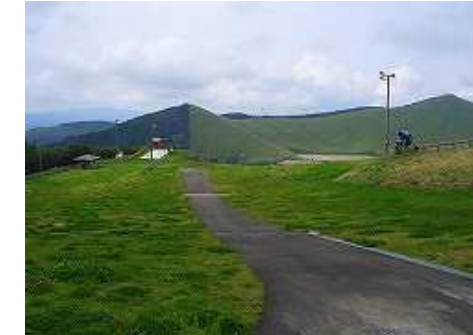
スキー場分岐から北西に伸びる尾根を下り、スキー場上部から、緑のスキー場の中を駐車場へと戻って行った。