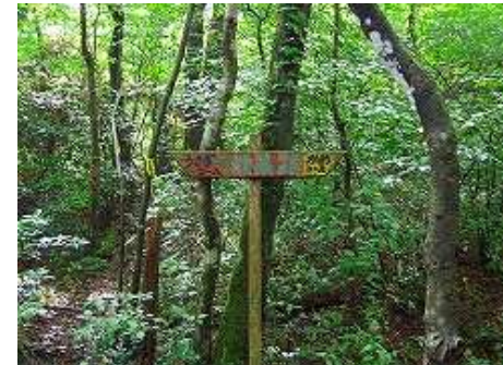
やがて、右かめコース・左うさぎコースの分岐を見る。上部で出会う。今回は右コースを選んだ。5分ほどで林道に飛び出す。反対側にオオヤマレンゲがある。直ぐに尾根筋への取付きへ入る。