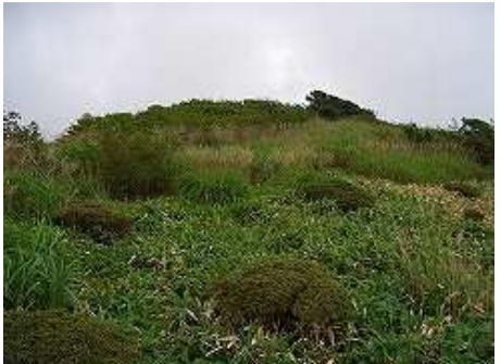
斜面にササを見るようになると、獵師山の頂は近い。右に伸びる尾根の針葉樹が絵になっている。