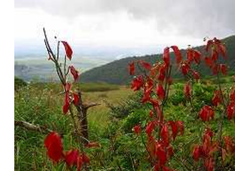
途中で見つけたニシキギの紅葉。