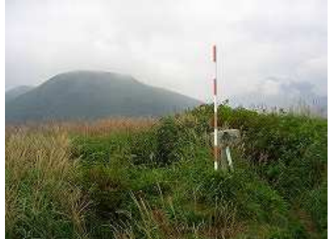
P1383mから緩やかな尾根を15分程で、合頭山(1384m)である。マツムシソウが多く見られた。背後の山は、黒岩山である。