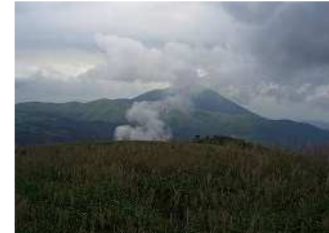
さらに10分程で、P1383mである。やまなみ側ヘルトが通じている。スキに覆われた草原で、八丁原地熱発電所の噴煙の奥に涌蓋山が望まれる。