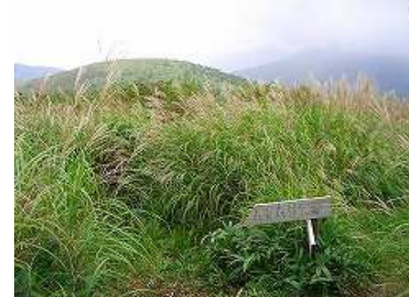
獵師山から北東に尾根を20分ほど行くと、スキー場への分岐に着く。