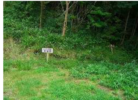
第2リフトの右側に「しゃくなげ散策路」の案内があるので樹林帯へ入る。分かりやすい道である。