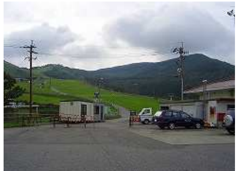
丸重森林公園スキー場に車を止め、9時15分薄曇りの中歩き始める。右：獵師山、左：P1383である。右側の第1リフトに沿って、花の写真を撮りながら第2リフトまで登る。