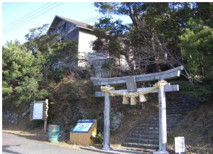
上宮参道とバンガロー