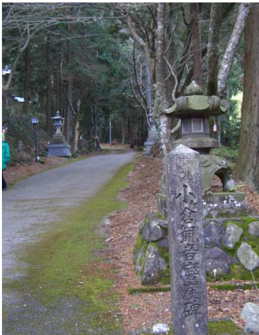
小ヶ倉観音への参道