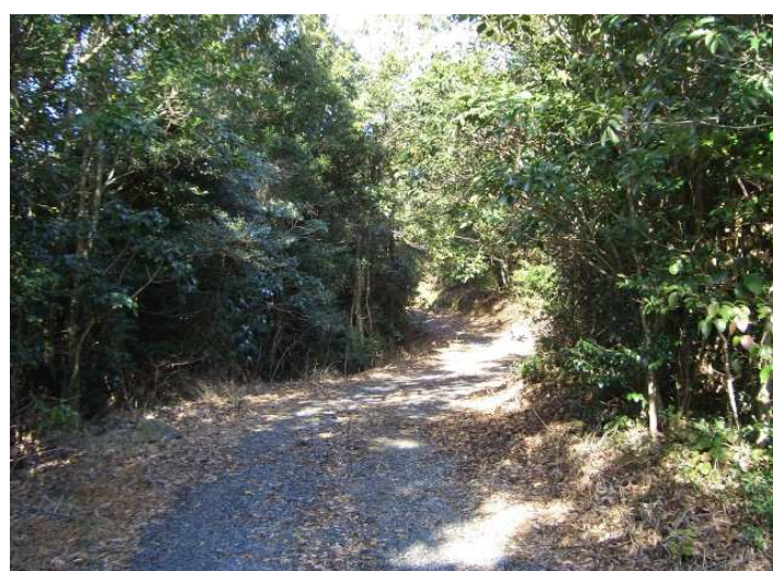
矢筈嶽へと続く参道(林道)