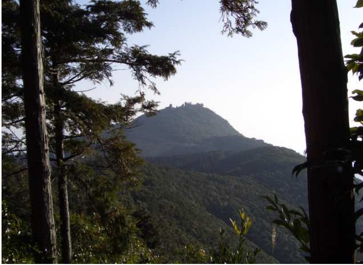
参道(林道)から望む倉岳