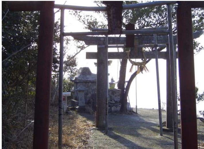
矢筈嶽山頂と金刀比羅宮上宮