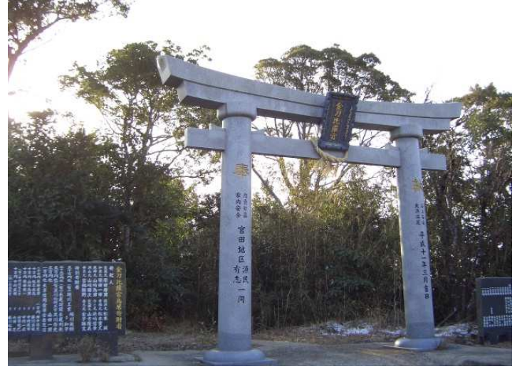
矢筈嶽手前の大鳥居