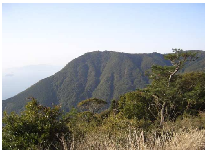
駐車場から矢筈嶽を望む