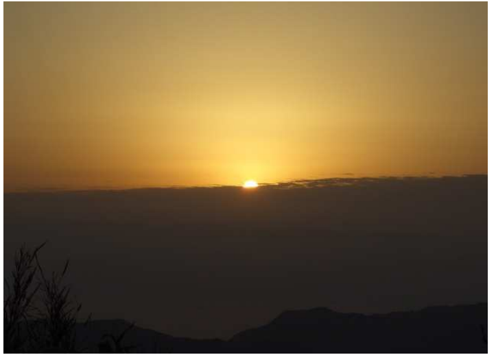
水俣方面からの御来光