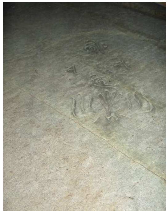
本殿裏の岸壁に刻まれた梵字