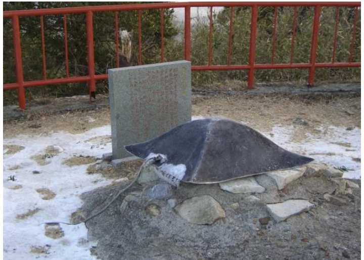
山頂に湧き出る「倉岳霊水」