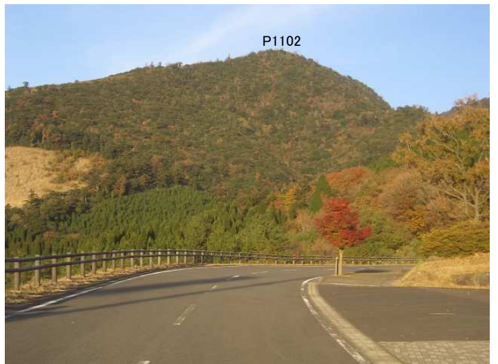
県道130号を栗野岳温泉へ向かう