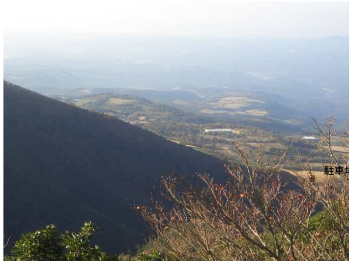
第1展望台から駐車場を見下ろす