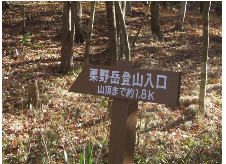
栗野岳登山入口の標柱