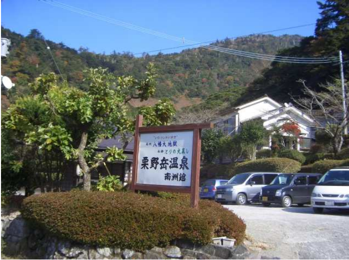
栗野岳温泉 南洲館