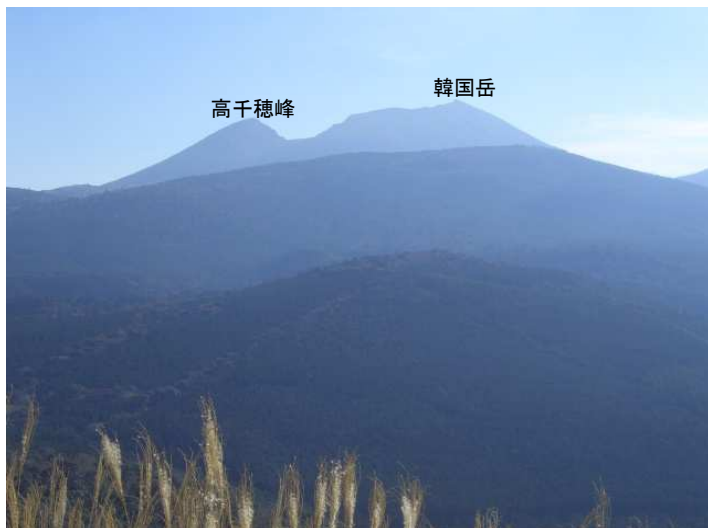
見晴し台から東の展望