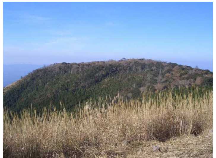
見晴し台から見る西尾根