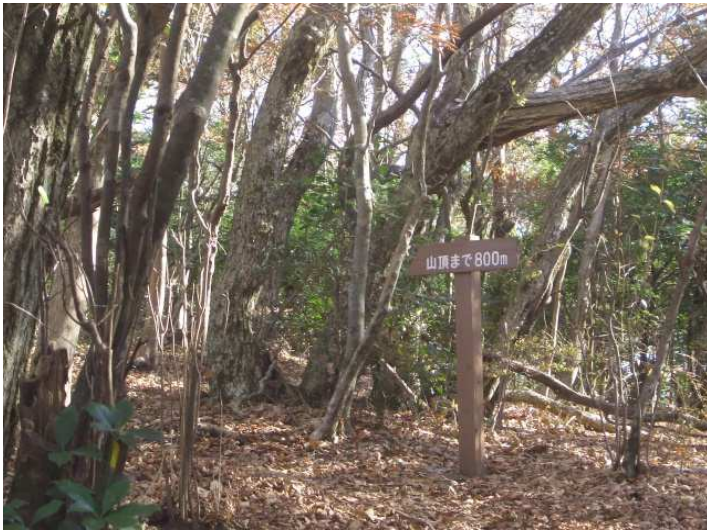
山頂まで800mの標柱を見る