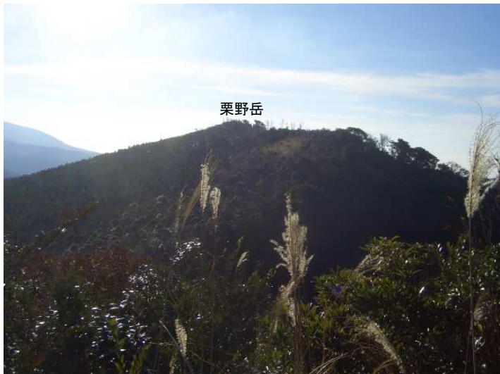
展望Aからの栗野岳