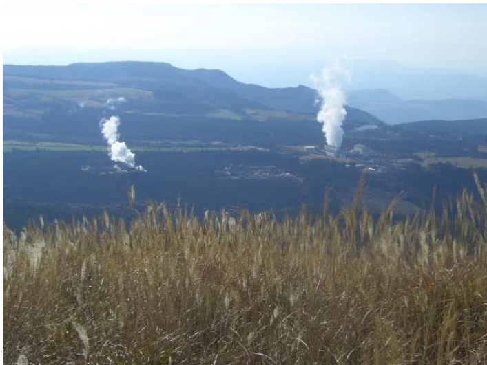
見晴し台から南に大霧地熱発電所を見下ろす