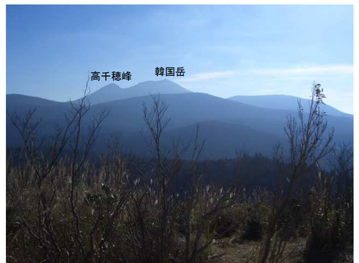
栗野岳から東の展望