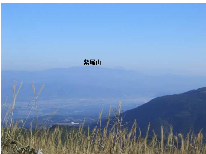
栗野岳から西の展望