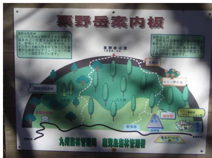
栗野岳案内板を見る