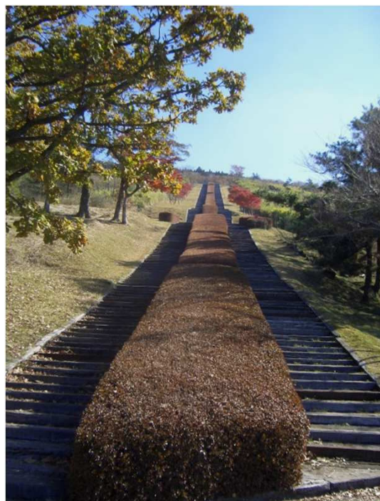
日本一の枕木階段