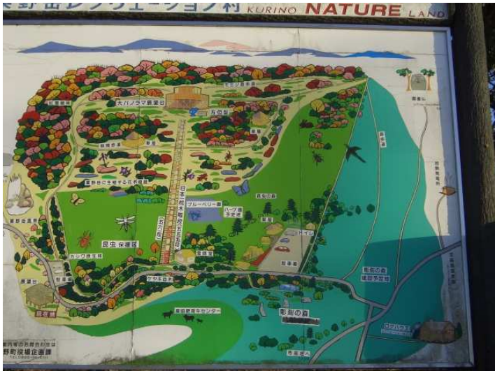
駐車場隣の案内板