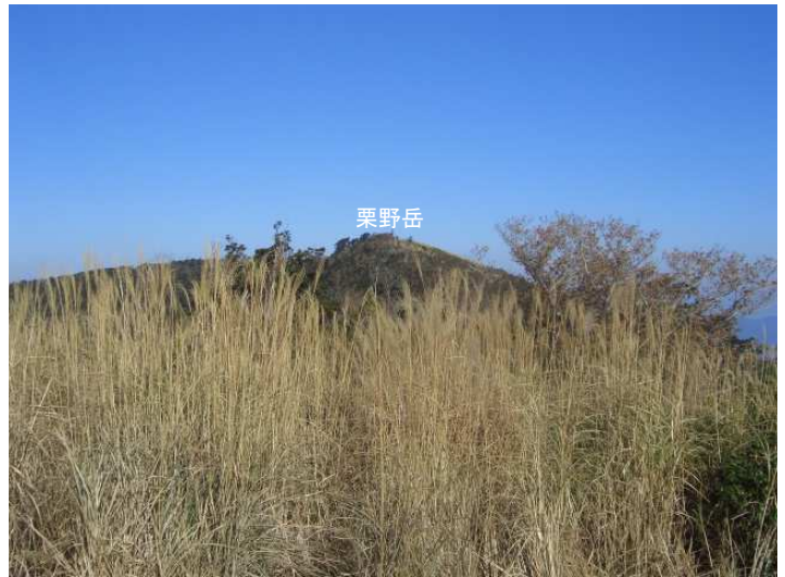
見晴し台分岐から栗野岳を振り返る