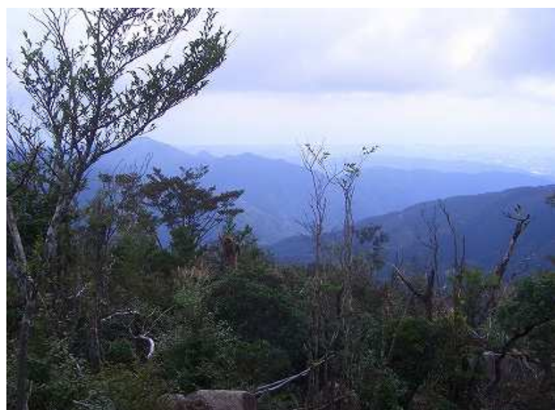
9合目を過ぎて振り返る