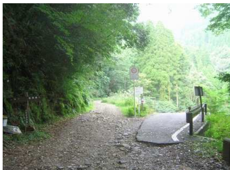
キャンプ場へ下る