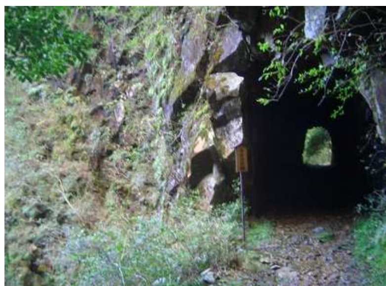
隧道を抜けて振り返る