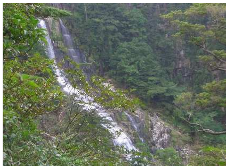
白滝展望所から見た白滝