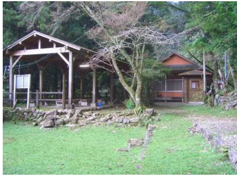
尾鈴キャンプ場を出発

尾鈴キャンプ場～登山道入口～尾鈴山(1405m)～長崎尾(1374m)～白滝展望所～尾鈴キャンプ場