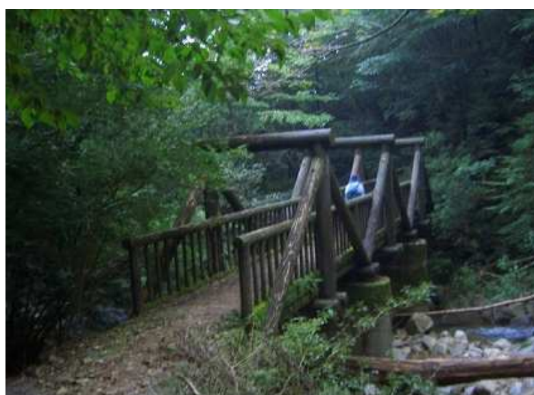
左岸から右岸へ木橋を渡る