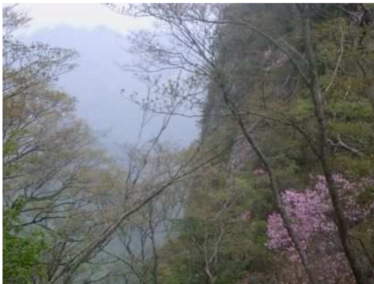
夏木新道分岐傍から西に兜巾岳の尾根