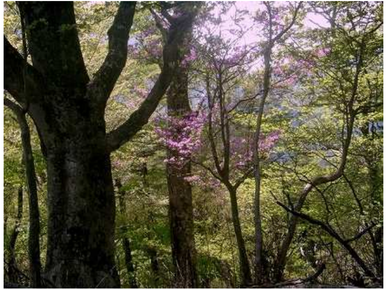
ブナの奥にアケボノツツジ