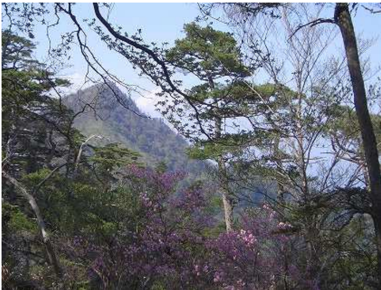
犬流越から檜山を望む