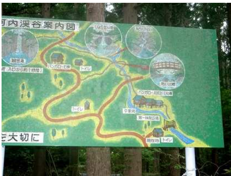
藤河内キャンプ場案内図