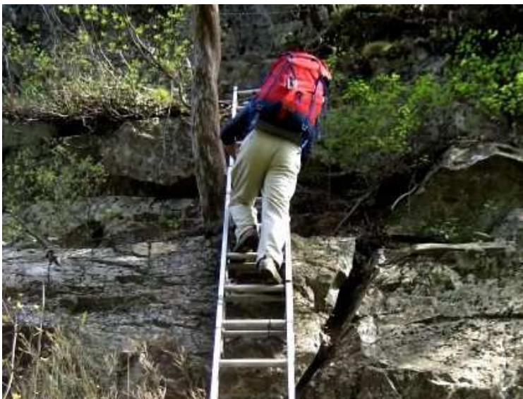
アルミ梯子を登る