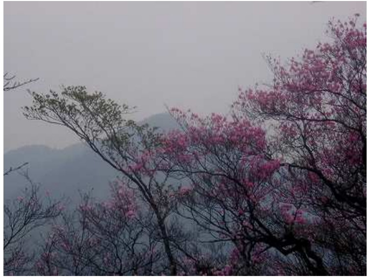
アケボノ平への下降路から檜山