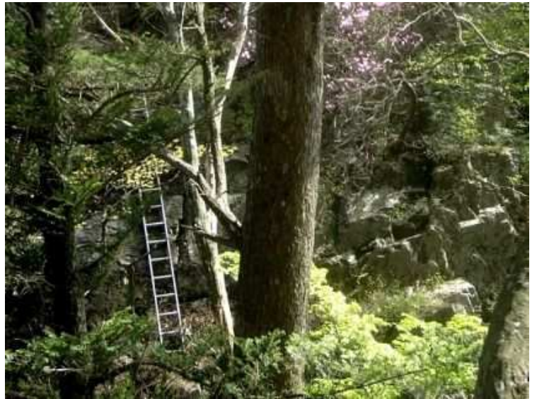
崖下にアルミ梯子