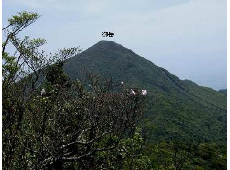
妻岳から御岳を望む