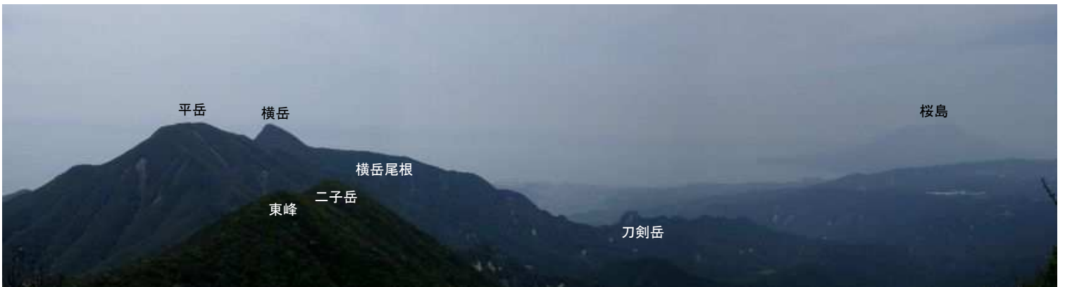
妻岳から二子岳・平岳・横岳～横岳尾根・刀剣岳・桜島を望む