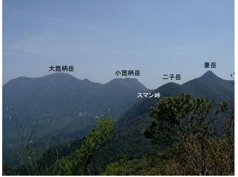
平岳から大笹柄岳・妻岳を望む