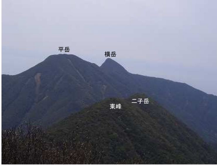
妻岳から二子岳・平岳・横岳を望む