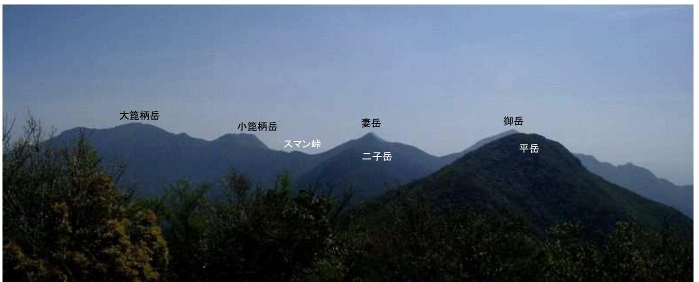
横岳から平岳・妻岳・大笹柄岳方面を望む