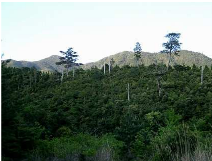
テント設営地から横岳と横岳尾根を望む