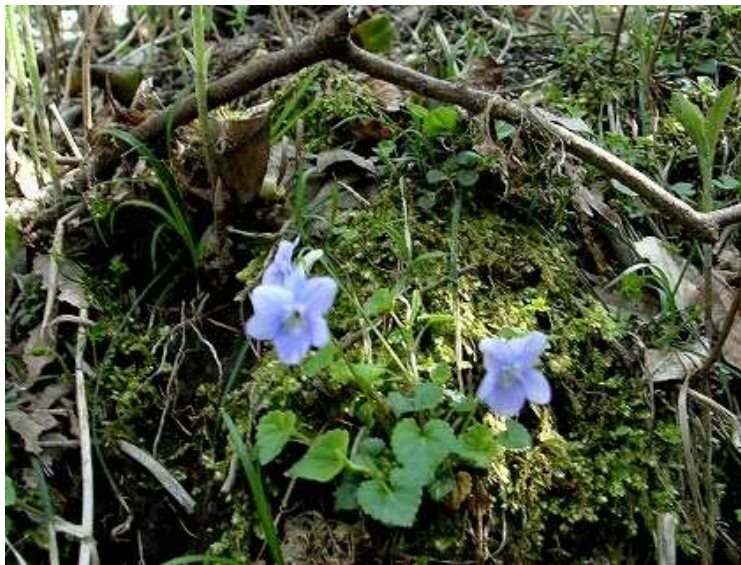
タチツボスミスレ