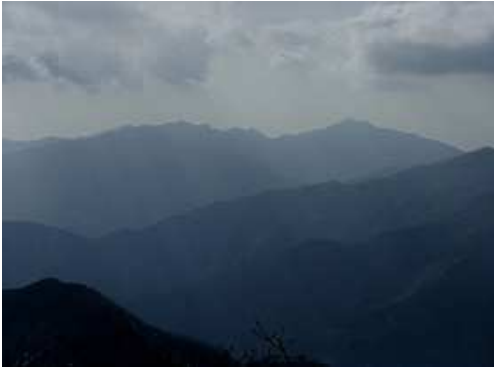
五葉岳から祖母山を望む。