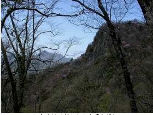
兜巾分岐手前から兜巾岳を望む。

大吹広場～兜巾岳登山口～兜巾分岐～兜巾岳(1484m)～夏木分岐～五葉岳(1570m)～乙女山分岐～乙女山(1517m)～お姫山(1550m)～ブナ分岐～大吹分岐～大吹広場