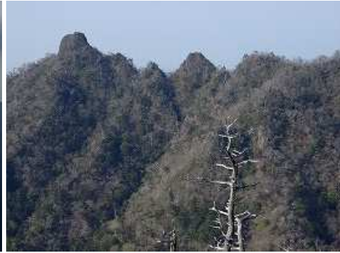
乙女山から鹿納山を望む。