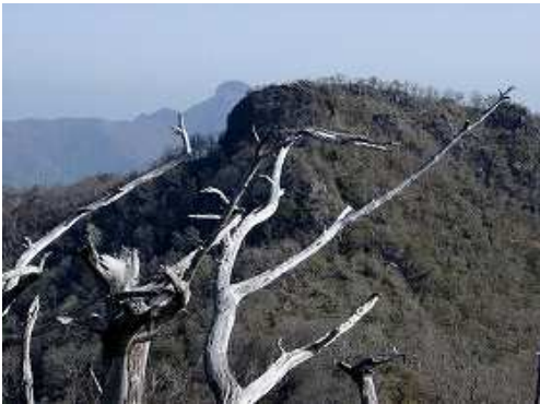
お姫山から鹿納の野を望む。