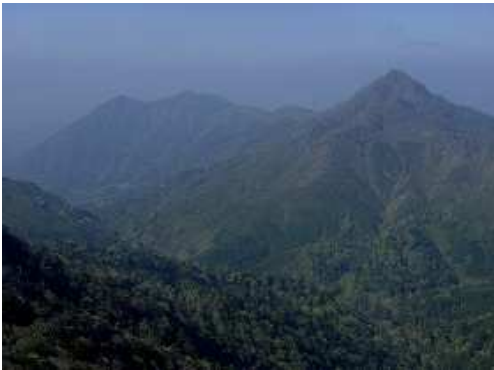
鹿納山から日隠山を望む。