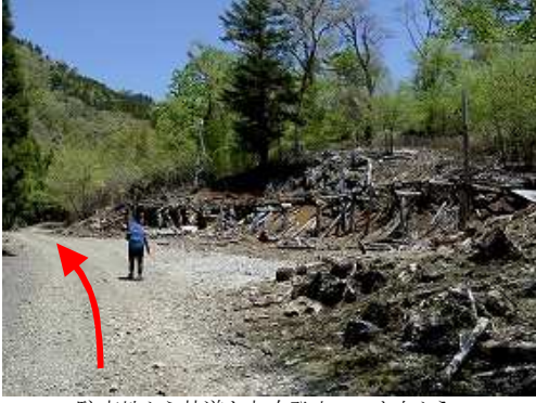
駐車地から林道が大吹登山口へと向かう。

駐車地～大吹登山口～五葉岳(1570m)～お姫山(1550m)～ブナ分岐～鹿納の野(1548m)～鹿納Ⅲ峰～鹿納山(1567m)～鹿納の野(1548m)～ブナ分岐～お化粧山(1450m)～お化粧山登山口