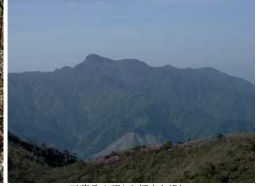
五葉岳山頂から傾山を望む。