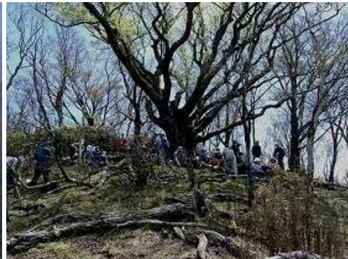
ブナ分岐を通過する。