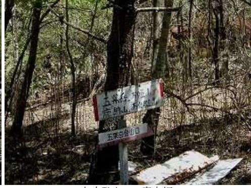
大吹登山口の案内板。