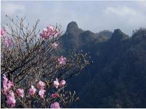
五葉岳山頂から鹿納山を望む。