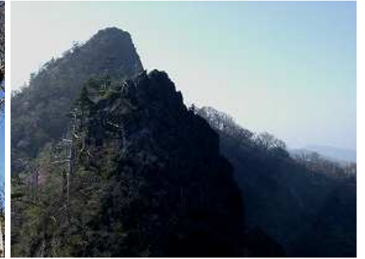
鹿納Ⅲ峰の奥に鹿納山を望む。