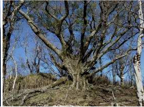
ブナ分岐を通過する。